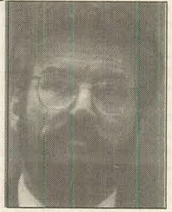
சின்பின் தலைவர் ஜெரி அடம்ஸ்

பழைய அரசியல் உறவுகளுக்கும் பரந்த சந்தைகளுக்கும் மூலப் பொருட்களுக்கான புதிய மூலங்களையும் பொதுவில் பூகோள ரீதியான பொருளாதாரத்தினை ஈட்டிக் கொள்வதற்கான ஒன்றிணைக்கப்பட்ட, நிதி நலன்களின் அவசியங்களுக்கும் இடையேயான வேறுபாடுகளும் தென் ஆபிரிக்காவில் சட்டரீதியான இனஒதுக்கலை சிதறடிக்கச் செய்ததற்கும் மத்திய சிழக்கில் ஒரு புதிய அரசியல் நிலைமையினால் பீ.எல்.ஓ.வை இணைத்துக் கொண்டதற்கும் அடிப்படையாக உள்ளது. இதே சக்திகளே வட அயர்லாந்திலும் மூலதன முதலீடுகளுக்கும், இலாப உழைப்புக்கும் தடையாக இருந்து கொண்டுள்ள பழைய தடைகளை தாண்டுவதில் முன்னணியில் உள்ளன.