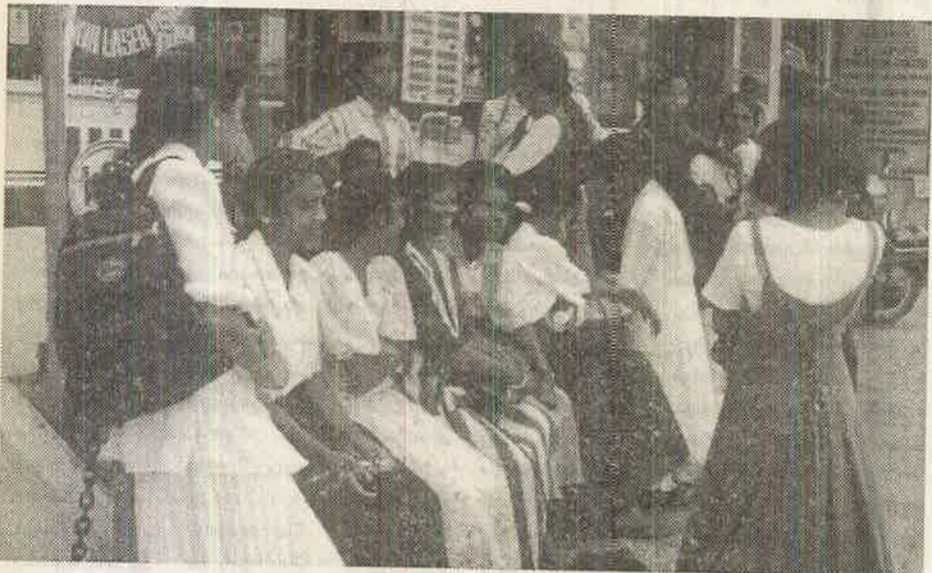
மாலைத்வ ட்ரைஸ்டார் தொழிலாளர் அதன் பம்பலப்பிட்டி தலைமையகத்தில் வேலையிழந்ததையிட்டு எதிர்ப்புக் காட்டி வந்திருந்த போது எடுத்த படம்

தொழில் இழந்த தொழிலாளர்கள் கடந்த மார்ச் 31ம் திகதி பம்பலப்பிட்டியில் அமைந்துள்ள ட்ரைஸ்டார் நிறுவனத்தின் தலைமையகத்துக்கு வந்து புகார் செய்து