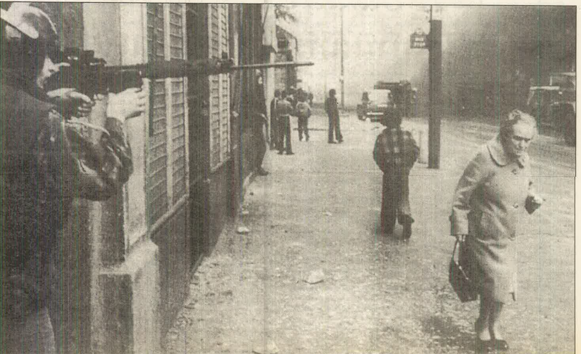
அயர்லாந்து வீதிகளில் இராணுவ பயங்கரங்களில் ஈடுபட்டுள்ள பிரித்தானிய இராணுவம்

பிரித்தானிய ஆளும் வர்க்கம் அயர்லாந்து அரசாங்கத்துடன் எல்லைக்கு குறுக்கேயான ஆரம்பிப்புக்களை அபிவிருத்தி செய்து வைக்க முயற்சிக்கின்றது. இதன்மூலம் வடக்கு ஐரோப்பாவில் முக்கிய மலிவு உழைப்பு சுரங்கத்தில் கூடிய பிரித்தானிய மூலதனத்தின் மூலம் இலாபம் உழைக்க முயற்சிக்கின்றது. வட அயர்லாந்தின் பொருளாதார வீழ்ச்சி எனக் கூறும் போது அது பிரித்தானியா ஆண்டு ஒன்றுக்கு 3.2 பில்லியன் ஸ்டீர்லிங் பவுண்டுகளை பாதுகாப்புக்கும், நலன்புரி செலவுகளுக்கும் மானியமாகச் செலவிடுகின்றது. சுருங்கச் சொன்னால் ஒரு ஆளுக்கு 2000 ஸ்டீர்லிங் குகளை (ரூபா. 200000)