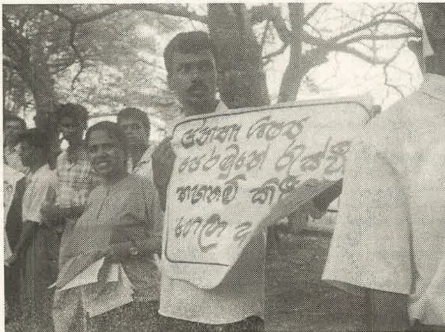
கொழும்பு பல்கலைக்கழக நிர்வாகத்தின் செடுபிடிக்களை எதிர்த்து சோ.ச.க.வும் அதன் மாணவர் அமைப்பும் பல்கலைக்கழக எதிரில் நடாத்திய மறியல் போராட்டம்

கூட்டத்தை தடை செய்த நிர்வாகிகள் இந்த பகிடிவதை மசோதா இப்போது அமுலுக்கு வந்துள்ளதால் பல்கலைக்கழகத்தில் அரசியலில் ஈடுபட்டுள்ள பதிவு செய்யாத மாணவர் அமைப்புகளின் நடவடிக்கைகளுக்கு முன்னர் போல் அனுமதி வழங்க முடியாது எனத்