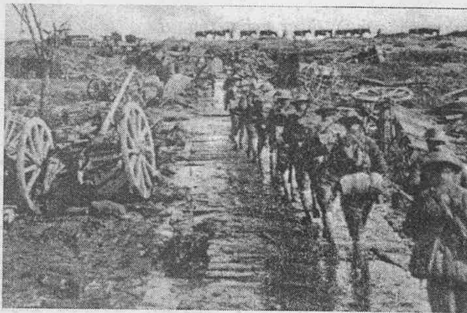
முதலாம் உலக யுத்தம் உற்பத்தி சக்திகள் தேசிய அரச எல்லைகளைத் தாண்டி வளர்ந்து விட்டதை குறித்து நின்றது.

முதலாம் இடத்தில் உற்பத்தியின் பூகோளமயமாக்கம் வெறுமனே "முன்றாம் உலகின்" நாடுகளுக்கு உற்பத்தியை மாற்றுவதோ அல்லது "பன்னாட்டு கம்பனி"களினால் முன்றாம் உலக நாடுகளிற்கு உற்பத்தியை" பேரளவில் " மாற்றுவதோ அல்ல. இந்தப் போக்குகள் உலக முதலாளித்துவ உற்பத்தியில் தீர்க்கமான மாற்றங்களின் ஒரு வெளிப்பாடாகுவதோடு பூகோளமயமாக்கல் போக்கின் ஒரு அம்சம் மட்டுமே.