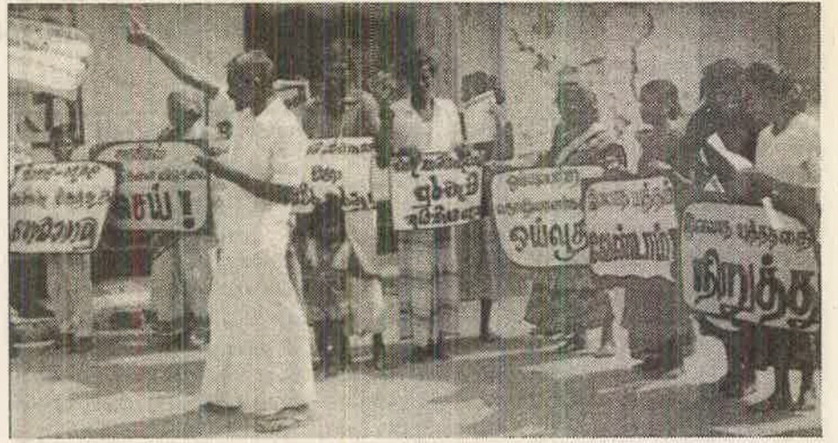
சம்பளப் போராட்டத்தில் ஈடுபட்டுள்ள பண்டாரவளை-குருகுந்த தோட்ட தொழிலாளர்

இன்று இந்தத் தொழிற்சங்கங்கள் குறைந்த உற்பத்திச் செலவுகளை ட்ரான்ஸ் நஷனல் கூட்டுத்தாபனங்களுக்கு அதுவது ஏகாதிபத்திய முதலீட்டாளர்களுக்கு விநியோகிக்கச் செயற்படும் ஏஜன்சியாகி உள்ளன. அவை பொருளாதார ரீதியில் அதிக வரிசை திறனை தொழிலாளர்களிடமிருந்து கசக்கிப் பிழியவும் குறைந்த வாழ்க்கை நிலைமைகளுக்குத் தள்ளவும் அத்தாக்குதல்களுக்கு எதிராக கிளர்ந்து எழும் தொழிலாளர்களை நசுக்கும் பொருட்டு முதலாளித்துவ அரசியல் பொலிஸ் ஏஜன்டு வேலையையும் ஏற்பதாகும். தொழிற்சங்கங்கள் தொழிலாளர்களுக்கு எதிரான கால் விலங்காகியுள்ளது. தொழிற்சங்கத் தலைவர்களின் முன்னொருபோதும் இல்லாத அளவிலான காட்டிக் கொடுப்புகளும் முதலாளித்துவ சலுகைகளுக்கான கையேந்தல்களும் தொழிற்சங்கங்களின் இந்த பரிமாணத்தின் ஒரு வெளிப்பாடாகும்.