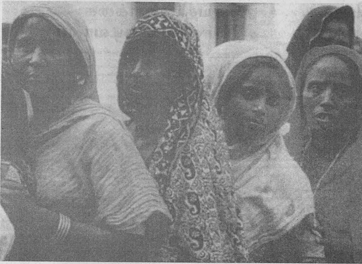
கடந்த பொதுத் தேர்தலில் வாக்களிக்க சியூவில் நிற்கும் இந்தியப் பெண்கள்

அமைப்பின் கூட்டாகும். இந்திய அரசியலில் ஒரு கணிசமான சக்தியாக விளங்கவில்லை. மிகச் சமீபத்தில் 1984 தேர்தலில் கூட பா.ஜ.க.இந்திய பாராளுமன்றத்துக்கான தேர்தலில் இரண்டு ஆசனங்களை மட்டுமே வெற்றி கொண்டது.