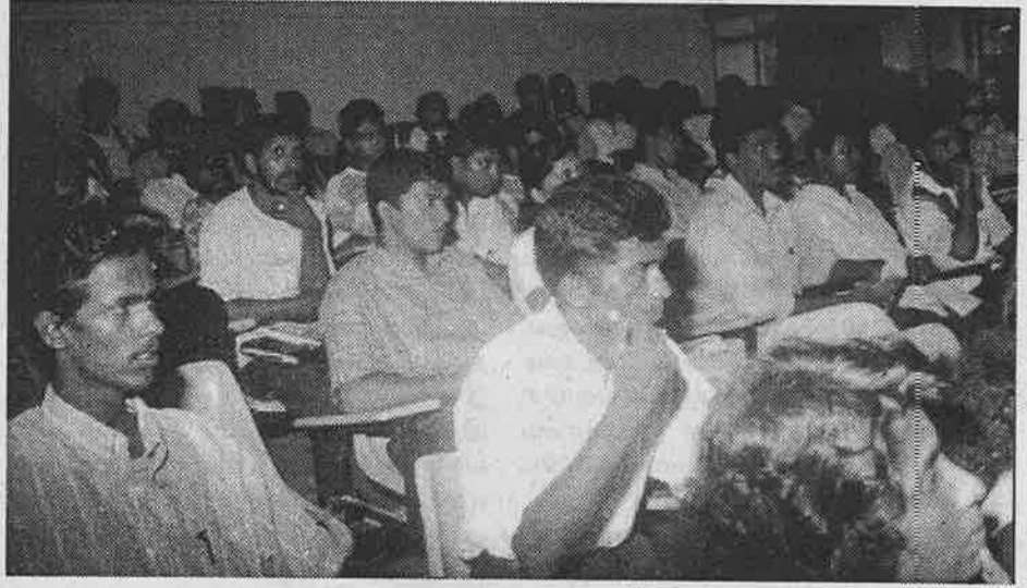
களனி பல்கலைக் கழகத்தில் நடாத்திய விரிவுரைகளில் கலந்து கொண்டவர்கள்

இந்த விரிவுரைத் தொடரின் இலக்கு, கிட்டத்தட்ட எட்டு தசாப்தங்களாக ஸ்டாலினிச அதிகாரத்து வத்தினாலும் அதன் பரிந்துரையாளர்களினாலும் காட்டிக்கொடுக்கப்பட்டு சீர்குலைக்கப்பட்ட மார்க்சிச புரட்சிகர கலாச்சாரத்தை புத்துயிர் பெறச் செய்வதன் மூலம் முதலாளித்துவத்துக்கு எதிரான போராட்டத்துக்கு தள்ளப்படும் தொழிலாளர்-ஒடுக்கப்படும் மக்களை ஆயுதபாணிகளாக்குவதேயாகும். தொழிலாளர்