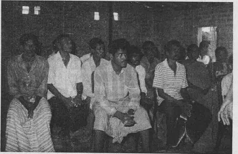
உட்புவில் இடம்பெற்ற ஆரம்ப விரிவுரையில் கலந்து கொண்டவர்கள்

வர்க்கத்தின் புரட்சிகர உலகக் கட்சியை கட்டி எழுப்பும் பணியுடன் பிரிக்க முடியாத வகையில் இணைந்து கொண்டுள்ள இப்போராட்டம் நான்காம் அகிலத்தின் அனைத்து லகக் குழுவின் பகுதிகளை உலகம் பூராவும் ஸ்தாபிதம் செய்யும்