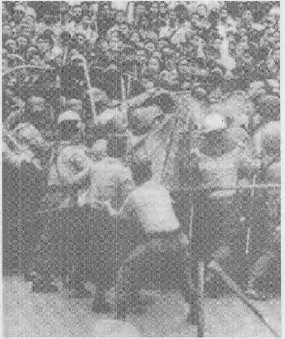
சர்வாதிகாரி சுகார்ட்டோவுக்கு எதிரான மாணவர் ஆர்ப்பாட்டங்கள்

சர்வதேச நாணய நிதியமும், அமெரிக்கா தலைமையிலான ஏகாதிபத்தியவாதிகளும் கோருவது என்ன? ஏகாதிபத்திய வங்கியாளர்களும் ட்ரான்ஸ்நஷனல் கம்பனிகளும் அவசியங்களுக்கு ஏற்ற விதத்தில் தொழிலாளர் ஒடுக்கப்படும் மக்களுக்கு எதிரான கொடிய தாக்குதல் நிறைந்த பொருளாதார "சீர்திருத்தத்தை" நடைமுறைக்கிடுவதில் வெற்றி கண்ட ஒரு "ஜனப்பிரிய" அரசாங்கமாகும். அத்தகைய ஒரு அரசாங்கம் அந்த "சீர்திருத்த" நடவடிக்கைகளை அதை எதிர்த்து வெடித்துள்ள சமூகப் போராட்டங்களை இராணுவ பொலிஸ் அடக்குமுறைகள் மூலம் நசுக்குவதன் மூலமே பொதுமக்கள் மீது திணிக்க முடியும். ஹபிபியின் கீழோ அல்லது அவனை வீழ்த்தி ஆட்சிக்குவரும் அமீன் ரையின் ஆட்சியின் கீழோ அல்லது மேகவதி சுகார்ட்டோவுக்கு புத்திரி போன்ற வேறு முதலாளித்துவ ஆட்சியாளர்களின் கீழோ இந்தோனேஷிய தொழிலாளர் ஒடுக்கப்படும் மக்கள் முகம் கொடுக்க நேரிடுவது என்ன? அத்தகைய கொடிய அடக்குமுறைகள் மூலம் நடைமுறைக்கிடப்படும் ஏகாதிபத்திய வங்கியாளர்களின் வேலைத்திட்டமேயாகும்.