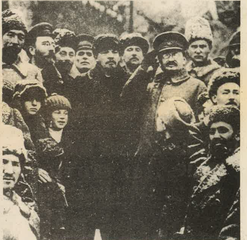
தொழிலாளர் செம்படையின் மத்தியில் லெனினும், புராட்ஸ்கியும்.

இந்த நாடுகளில் சுதந்திரமான தொழிலாளர் வர்க்க எழுச்சிகளை சோவியத் செம்படை கவச வண்டிகளைக் கொண்டு நசுக்கியது. 1953ல் ஹங்கேரியிலும், 1952ல் சி. ஜெர்மனியிலும் 1956-ல் செக்கோஸ்லோவாகியாவிலும் இத்தகைய நசுக்குதல்கள் கட்டவிழ்த்து விடப்பட்டன. இரண்டாம் உலகப் போரின் போது, 'நாட்டை விட்டு ஓடிப் போனவர்கள் (மன்னர்கள், முதலாளித்துவ வாதுகள்) திரும்ப அழைக்கப்பட்டு ஆட்சி அதிகாரத்தில் இருத்தப்பட்டுள்ளார்கள். இந்த முதலாளித்துவ வாதுகளையும்; மன்னர்களையும் ஏகாதிபத்தியம் பயன்படுத்தி, தாங்கள்