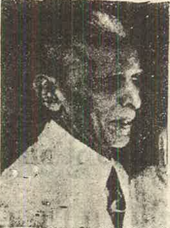
முகமட் அலி ஜின்னா

முதலாளித்துவப் புள்ளி விபரங்களின் பிரகாரம் 85 கோடியாயுள்ள இந்திய சனத்தொகையில் 35% வறுமைக் கோட்டிற்கு வெகு கீழ்க்காணப் படுகின்றனர். இந்த வறுமை எத்தகையது என்பதற்குப் பின் ஒரு தனி நபரின் வருவாய் ஆண்டொன்றிற்கு ரூ. 85 மட்டுமே (இப்போதைய இலங்கை ரூபா மதிப்புப்படி ரூ. 150 மட்டுமாகும்) உள்நாட்டு, வெளிநாட்டு முதலீட்டாளரால் வர்த்தக சந்தை எனக் கருதப்படுவது மொத்த சனத்தொகையின் 25%க்கு மேற்படாத எண்ணிக்கையினர் மட்டுமேயாகும். மொத்த சனத்தொகையில் மூன்றிலொரு பங்கினர் ஆண்டொன்றுக்கு ஒரு யார் துணிகூட வாங்கி