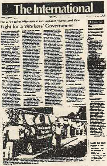
கனடியப் ரொட்ஸ்கிசு கட்சியின் 'த இன்டர்நஷனல்' பத்திரிகை

ஏப்ரல் 18-19ம் திகதிகளில் ஊடாவின மொன்றில் நகரில் நடைபெற்ற 'இன்டர்நஷனல் வேர்க்கள் கட்சியின் (I. W. P) ஸ்தாபக மகாநாடு கனடிய, அனைத்துலகத் தொழிலாள வர்க்கத்தினைப் பொறுத்தமட்டில் ஒரு வரலாற்று நடவடிக்கையாகும். மொன்றில், டொராண்டோ நகரங்களில் இருந்து வருகை தந்திருந்த 'ரோட்கிசு', 'நாங்காம் அகிலத்தின் அத்திவாரம், தீர்மானங்களின் அடிப்படையில் புதிய அமைப்பினை நிறுவவும், சோசலிசப் புரட்சியின் உலகக் கட்சியைக் கட்டியெழுப்பும் பொருட்டு நாங்காம் அகிலத்தின் அனைத்துலகக் குழுவின் கட்டுப்பாட்டின் கீழ் செயற்படவும்' ஏகமனதாக வாக்களித்தனர்.