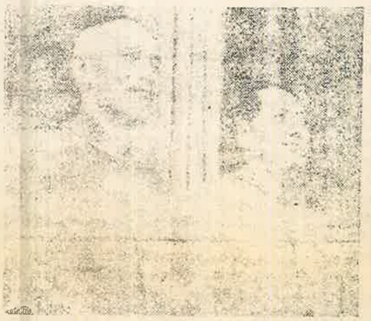
மாவோவும் அவரது ஐக்கிய முன்னணிக் கூட்டாளி ரியாங்கே ஷுக்கும்

டிராட்ச்கி சோவியத் யூனியனை விட்டு ஸ்டாலினால் பல வந்ததாக நாடு கடத்தப்பட்ட நிலையிலும், தனது எழுத்துக்கள் சோவியத் தொழிலாளர்களிடம் கிடைக்காமல் நசுக்கப்பட்ட போதிலும், பிரினைகளையும், கட்சிக்காரியாளர்களையும் ஸ்டாலின் உளவுப் படையின் மூலம் கொண்டு வந்த போதிலும், சென்று இடம்தோறும் முதலாளித்துவ அரசுகள் தொலைகள் கொடுத்த போதும் டிராட்ச்கி — ஸ்டாலினது ஜி.பி.யு.வின் மரண அச்சுறுத்தலை எதிர்த்துக்கொண்ட போதிலும் சோவியத் யூனி