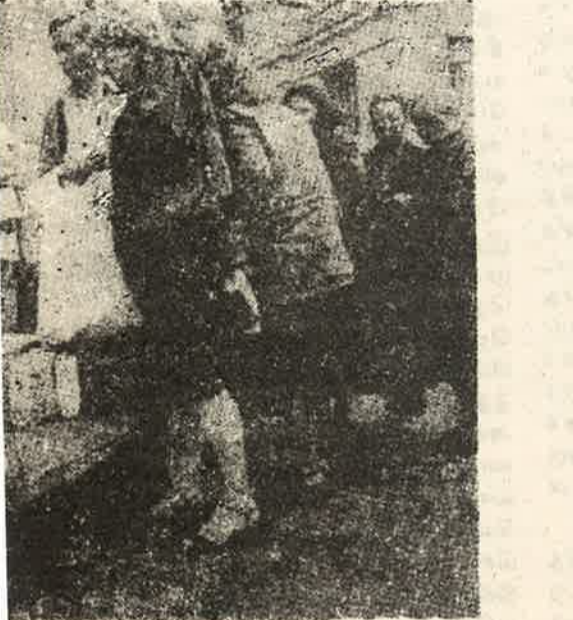
இல் உணவு 'கியூ' அவர்கள் தொழிலாளர்களின் உணவு முறையைக் கோருகிறார்கள்.

முடிவுரையாக நான் இதை குறிப்பிட விரும்புகின்றேன். அக்டோபர் புரட்சி எமது சகர்ப்பத்தின் மாபெரும் நிகழ்வினை உண்டாக்கியது. நாம் சோவியத் யூனியனின் சட்டநீதியான கலைப்பின் முக்கியத்துவத்தினை குறைக்கவில்லை. ஆனால் அது தொழிலாளி வர்க்கத்தின் போராட்ட இயலாப்பினை கலைப்பினைக் குறிக்காது. அத்தோடு அது அக்டோபரின் வரலாற்றுத் தாக்கங்களைச் செல்லுபடியற்ற தாக்கிவிடாது. பாரிஸ் கம்யூன் 71 நாட்களுக்கு நின்ற பிடித்ததோடு உலக வரலாற்றையும் மாற்றியது. தொழிலாளி வர்க்கத்தின் புரட்சிகர அபிவிருத்தியின் அடுத்த கட்டம், அந்த அனுபவங்களின் அத்தியாவசியமான வரலாற்றுப் படிப்பினைகளைத் தொழிலாளி வர்க்கம் உள்ளீர்த்துக் கொள்வதையே அடிப்படையாகக் கொண்டிருக்கும்.