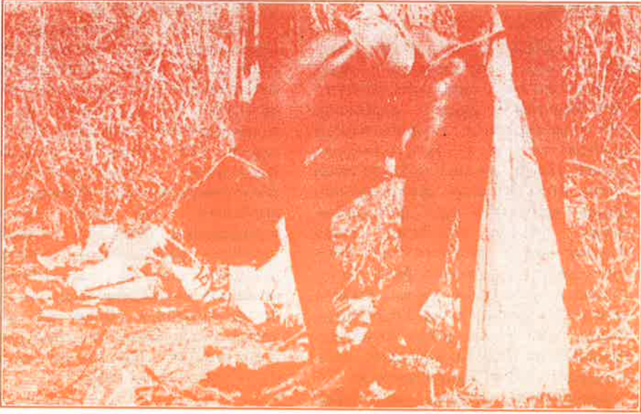
ஜெ.வி.பி ஈழக்குழுக்கள் போல் நடத்திய விளக்குக் கம்ப கொடிகளில் ஒன்று

நின்றதால் பல தேசபக்த சக்திகளை JVP இனால் கவர்ந்து இழுக்கமுடிந்தது. இதனால் மீண்டும் பலம் பெற்று இதன் ஓர் அங்கமாக DJV என்னும் வெகுசன அமைப்பையும் உருவாக்கியது. இவ்வெகுசன அமைப்பு சிங்களம் பேசும் மக்கள் மத்தியில் பெரும் செல்வாக்கை செலுத்தியது.