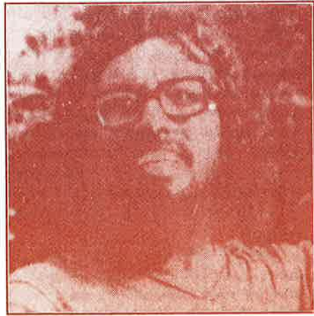
சுட்டுக் கொலை செய்யப்பட்ட ஜே.வி பி இன் தலைவர் ரோகண விஜயவீரா

ஏற்கனவே அமைப்பு ரீதியில் திரட்டப்பட்டுள்ள நகர்ப்புற தொழிலாளர்கள் புரட்சிக்கு முன்வர மாட்டார்கள், கிராமப்புற இளைஞர்களும், மாணவர்களுமே புரட்சிக்கு