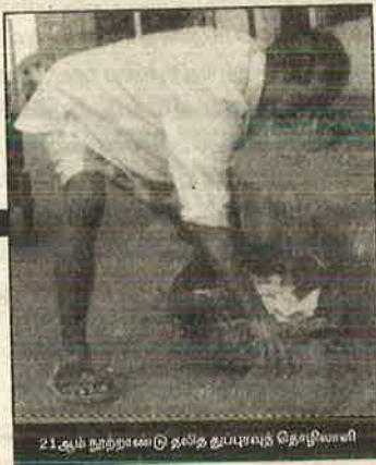
21ஆம் நூற்றாண்டு தனித் தூய்மைத் தொழிலாளர்

வது குறித்து டாக்டர் அம்பேத்கர் நிறைய விவாதித்துள்ளார்: