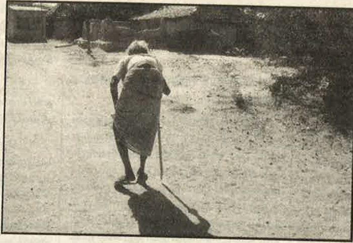
சுடுகாடாய் கிடக்கும் சங்கனாங்குளம் சேரி

பெண்களை வெறும் உடலாகப் பார்க்காதீர்கள் என்கிற வாதங்கள் தீவிரமடைந்து வருகின்றன. தலித் பெண்கள் வெறும் 'பெண் உறுப்பாக' மட்டுமே பார்க்கப்படுகின்றனர்.