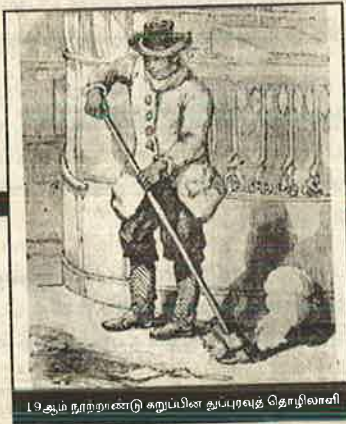
19ஆம் நூற்றாண்டு கறுப்பின தூய்மைத் தொழிலாளர்