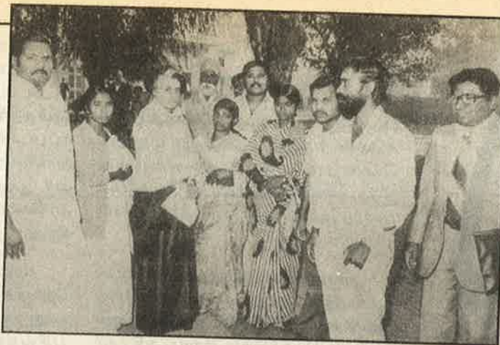
அப்போதைய பிரதமராக இருந்த இந்திரா காந்தியிடம் மனு கொடுக்கும் பாதிக்கப்பட்ட சங்கனாங்குளம் பெண்கள்