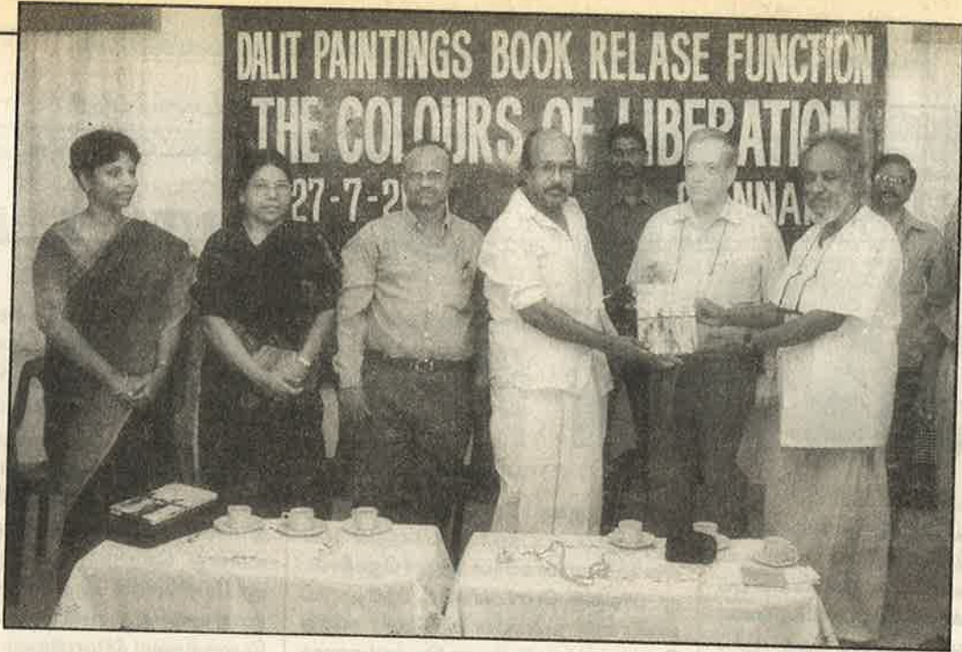
சிவகாமி, கண்ணகி, இந்திரன், போரவைத் தலைவர் காளிமுத்து, ரஷ்ய பண்பாட்டு மய்ய இயக்குனர், சந்தான ராஜ்

‘விடுதலையின் வண்ணங்கள்’ - தலித் ஓவியர்களின் நூல் வெளியீட்டு விழா