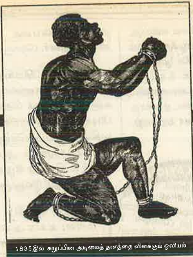
1835இல் சுரப்பின அடிமைத் தனத்தை விவசகும் ஓவியம்