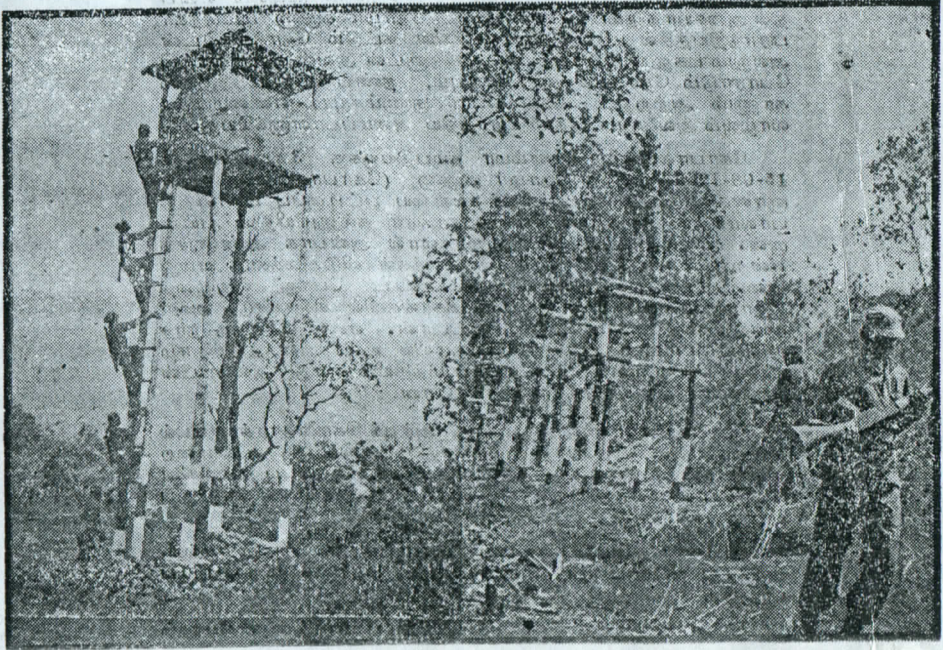
இராணுவ பயிற்சியில் ரெலோ (TELO) போராளிகள்.

இராணுவ வண்டிகளை நோக்கி ஏனைய ரெலோ (TELO) போராளிகள் ராக்கெட் மூலம் தாக்குதல் நடத்தினர். ரெலோ போராளிகளின் தாக்குதலுக்கு ஈடுகொடுக்க முடியாத இராணுவம் பின்வாங்கி ஓடிவிட்டது. இச்சம்பவத்தலேயே 5 இராணுவத்தினர் கொல்லப்பட்டனர்.