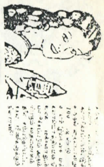
கவிதைப் பதிவு. கே. ஜி. வித்யா, 101, ஸ்ரீ லங்கா, ரெஸ்ட், கோலும்பு-11, சாங்காய், 25995.