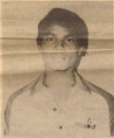
"உரசி எறிந்த தீக்குச்சியாய் உழன்று போன வாழ்வுக்கு உரங் கொடுக்கக் கரம் உயர்த்திய புரட்சிச் சூரியன்கள்."

தோழர் திக்கலஸ் [சாவகச்சேரிச் சமரில் உயிர் நீத்தவர்]