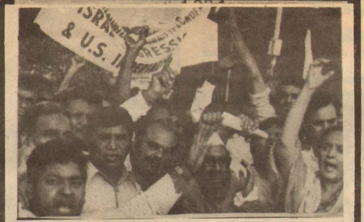
இஸ்ரேலுக்கெதிரான ஆர்ப்பாட்ட ஊர்வலம்.