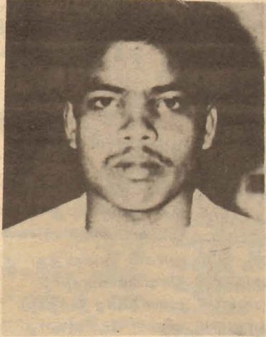
மரணத்தைச் சூடியதால் மனத்தின் மன்னர்களான வீரர்களே! திரிகள் மறைந்தும் நீங்கள் தீபங்களே!!

தோழர் திக்கலஸ் [சாவகச்சேரிச் சமரில் உயிர் நீத்தவர்]