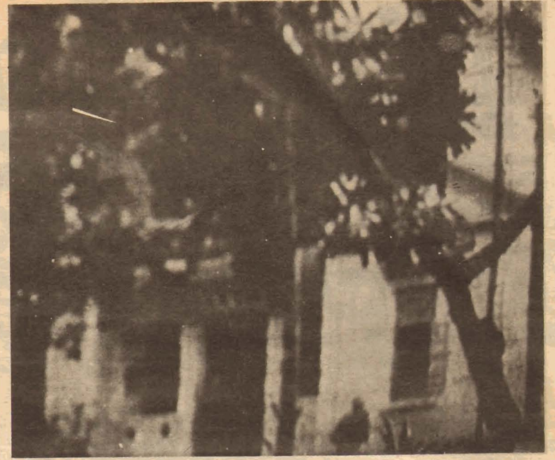
சாவகச்சேரி, ரிபலிஸ் நிழையம் சுன்பக்கத் தோற்றம்.