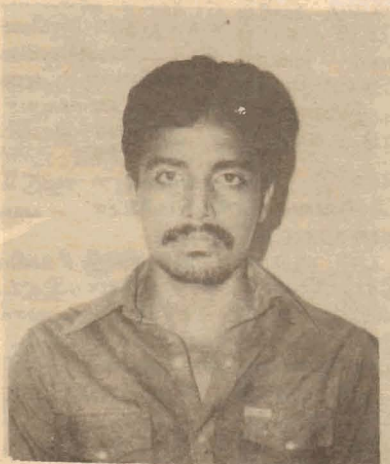
அரசு கலப்பைகள் உழுது ஆதிக்கத்தார் வீசி விதைத்த இனவாதம், எம் நிலம் தொடர, விடலை வயதுகளில் விழிகள் வினாவெழுப்பி மீசையரும்பிதும் படலை திறந்து பயணம் தொடங்கியதும்— பின், மனது வியாபித்து 'மார்க்ஸியம்' மலர்ந்து, இன்று களத்து மரணத்தில் முகங்கள் புதைந்ததும்— நாளான சரித்திர ஏட்டின் முன்னுரை வரிகள்!