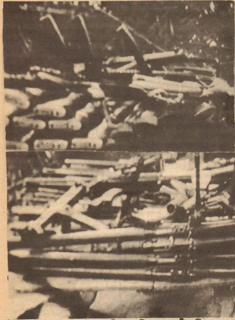
சாவகச்சேரி மாவட்டம் திண்டிவனத்தில் பெருமளவுக்குக் காயல் அகப்பட்ட கலிணைக் கட்டிடங்களில் ஒரு மீது.