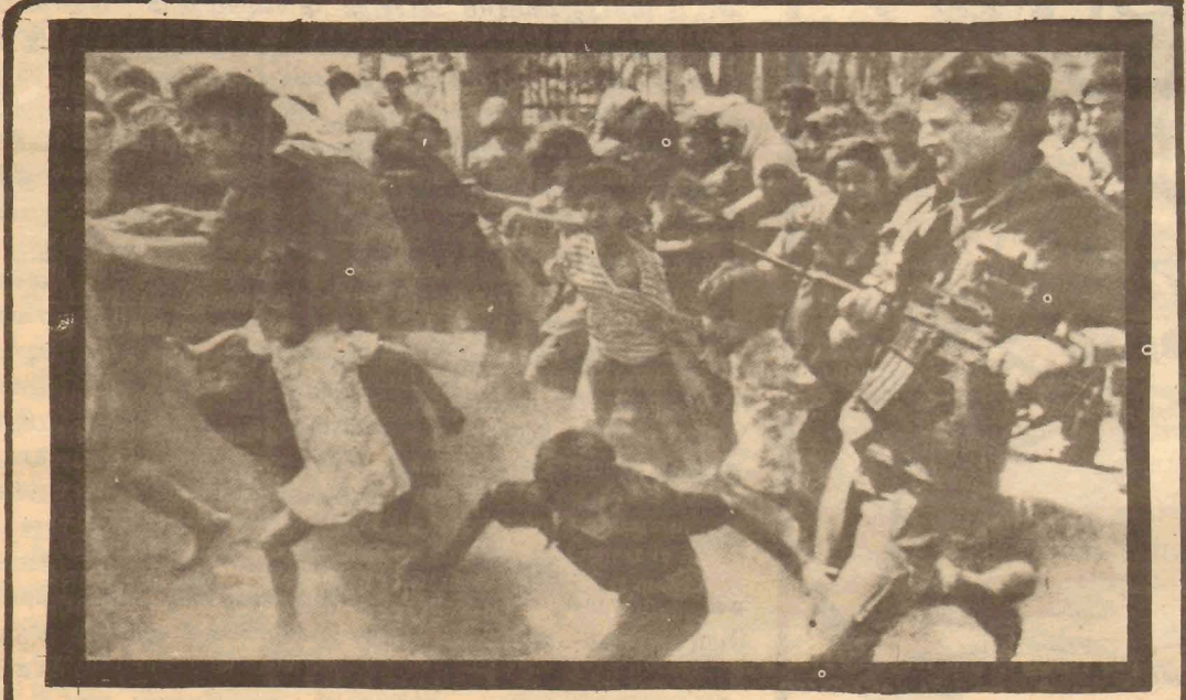
ஜசீர் அரபாத் துக்கிரமியிப்பு

1974 இல் ஐக்கிய நாடுகள் சபையில் ஒரு தீர்மானம் நிறைவேற்றப்பட்டது PLO. போராட்டத்தை 105 நாடு