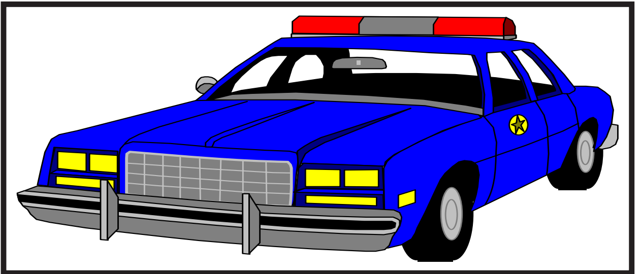
தமிழ்த் தேசிய ஆவணச் சுவடிகள்

இன்று தமிழீழப் போராட்டத்தைக் காட்டிக் கொடுத்தபடி உள்ள இயக்கங்களை நாம் தமிழினத்தின் துரோகிகள் என அழைக்கின்றோம். அதேவேளை இவ்வாறு புலம்பெயர்ந்தநாடுகளில் மாற்றுக் கருத்துடையோரைக் காட்டிக் கொடுக்கும் இவர்களை என்னவேன்று அழைப்பது என்பதை மக்களாகிய உங்களிடமே விட்டுவிடுகிறோம்.