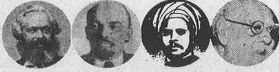
மார்க்ஸ் லெனின் சிங்காரவேலர் பெரியார்