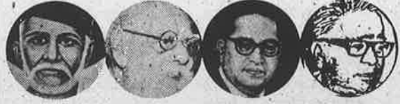
புலே பெரியார் அம்பேத்கர் லேலியா

இந்தியாவில் பொதுவுடைமை மலர மார்க்சிய - பெரியாரிய நெறியில் தேசிய இனவழிப்பட்ட சம உரிமை உடைய சமதர்மக் குழுஅரசுகள் ஓருங்கிணைந்த உண்மையான கூட்டாட்சி அமைய ஆவன செய்தல்