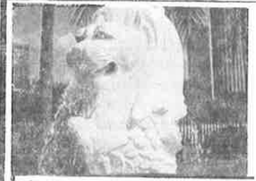
The Merlion - symbol of Singapore.