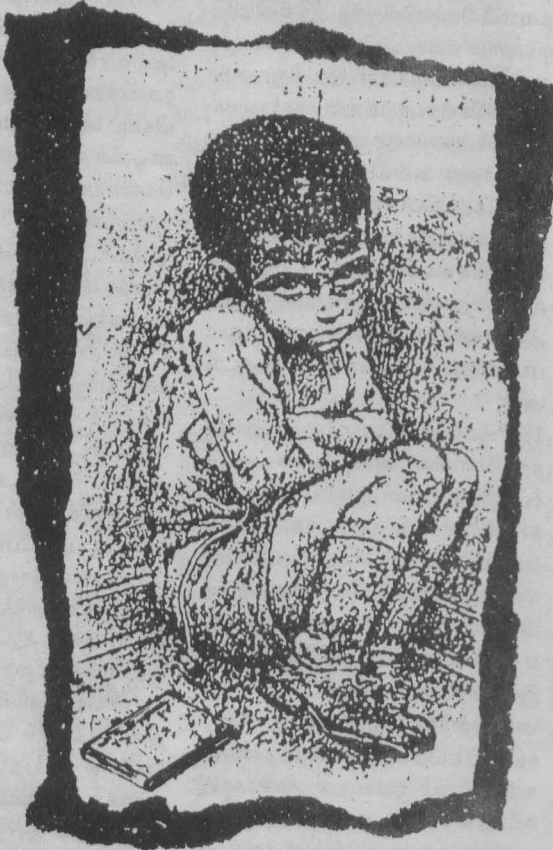
மூலம்: டொடர் ஜெயிம் ஜி ஜினோவா தமிழில்: அருண்

கட்டாயம் கொண்டிருக்க வேண்டும். பெற்றோர் வீட்டுவேலைகளைச் செய்ய மாறு குழந்தைகளை நச்சரிக்கக் கூடாது. குழந்தைகளைக் கேட்டுக் கொண்டால் ஒழிய பெற்றோர்கள் அவர்களது வீட்டுவேலைகளை மேற்பார்வை செய்வதோ, சரிப்பாற்படாதோ அவசியமில்லை. (பெரும்பாலான ஆசிரியர்கள் இக்கருத்துடன் முரண்படுவார்கள் என்பது உண்மையே) பெற்றோர், குழந்தையின் வீட்டுவேலைகள் குறித்த பொறுப்புக்களை தாம் எடுத்துக் கொண்டால் குழந்தைகள் அதை ஏற்றுக் கொண்டு விடுகின்றன. பிறகு பெற்றோர்கள் இடிலிருந்து ஒருபோதும் விடுபடவே முடியாது. பெற்றோரைத் தண்டிக்கவும், குற்றம் சுமத்தவும் ஏன் மிரட்டவும் கூட இந்த வீட்டுவேலையை ஒரு ஆயுதமாகக் குழந்தைகள் பயன்படுத்தத் தொடங்கி விடுவார்கள். குழந்தைகளின் வீட்டு வேலைகளில் உள்ள சிள்ளிச் சிள்ளி விடயங்கள் குறித்து பெருமளவு சிரத்தையை காட்டாதிருப்பது பெருமளவு பிரச்சினைகளைத் தவிர்ந்துக் கொள்ளவும், குடும்ப வாழ்வில் சந்தோஷத்தை ஏற்படுத்திக் கொள்ளவும் வாய்ப்பளிக்கிறது. பெற்றோர்கள் பெரும் சிரத்தை காட்டுவதற்குப் பதிலாக எந்தவிதமான தயக்கமும் இல்லாமல் உறுதியாக இவ்வாறு அவர்களுக்கு கூறலாம். "வீட்டுவேலை என்பது உங்களது பொறுப்புக்குட்பட்ட விடயம். வீட்டு வேலை உங்களுக்குத்தான் எங்களுக்கு அதில் உள்ள வேலை இருக்கிறது" வீட்டு வேலைகளுக்கு ஆரம்ப வகுப்புகளில் அளவுக்கு மீறிய பெறுமதி கொடுப்பது அவசியமற்றது. பெரும்பாலான நல்ல பாடசாலைகள் குழந்தைகளுக்கு வீட்டு வேலைகளை வழங்குவதில்லை. இந்த மாணவர்களும் கூட ஆறு, ஏழு வயதுகளில் பெருமளவு வீட்டு வேலைகளுடன் மாடுக்கும் குழந்தைகளைப் போல அதே அறிவும், திறமையும் உடையவர்களாக இருப்பதைக் காணலாம். வீட்டுவேலைகளின் முக்கியத்துவம் உள்ளவென்றால், அவர்கள் சுயமாக தம்பாட்டில் தமது வேலைகளைச்