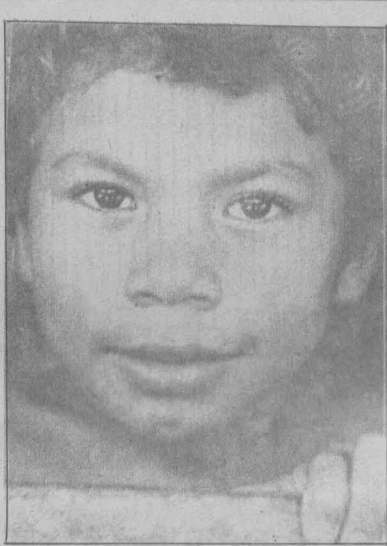
தேசிய இனங்களின் விடுதலைப் போராட்டங்கள் - மோதல்களும் தீர்வுகளும்

எடுத்த முயற்சியை முறியடித்து விட்டன. அநீதி உண்டேல் அமைதி இல்லை என்பதே வட அயர்லாந்து தரும் பாடம். தென்னாபிரிக்கா பற்றிய கட்டுரையிலும் எல் டபிள்யூ. டெக்ளேர்க்குக்குக் கட்டுரையாளர் தெரிவிக்கும் பாராட்டுகள், இதே க்ளேர்க்கின் பழைய இனவெறி அரசியலை மூடிமறைக்கின்றன. இந்த மனமாற்றங்களை இயலுமாக்குவதிலும் தெற்கு ஆபிரிக்கா முழுவதிலும் தமது மறைமுக/நேர்முக ஆதரவுடன் நிகழ்ந்த உள்நாட்டுப் போர்களை முடிவுக்குக் கொண்டு வருவதிலும் அமெரிக்க ஏகாதிபத்தியவாதிகளது அக்கறையை இயலுமாக்கியது என்ன என்ற கேள்வியைக் கட்டுரையாளர் தவற விட்டுவிட்டார். இன்றைய தென்னாபிரிக்காவின் பிரதான கேள்வி, வெள்ளை இனத்து வசதிபடைத்த வர்க்கத்தினரை மகிழ்விப்பது தொடர்பானதல்ல; மாறாக முன்னூறு வருட காலம் அடக்கி வைக்கப்பட்ட மக்களை நிமிர்ந்து நடக்க வைப்பது தொடர்பானது. இதற்கான முயற்சிகளை உலக சமாதானத்தின் புதிய காலவர்களும், மனித உரிமையாளர்களும் எவ்வாறு எதிர்கொள்வார்கள் என்பதே நம்