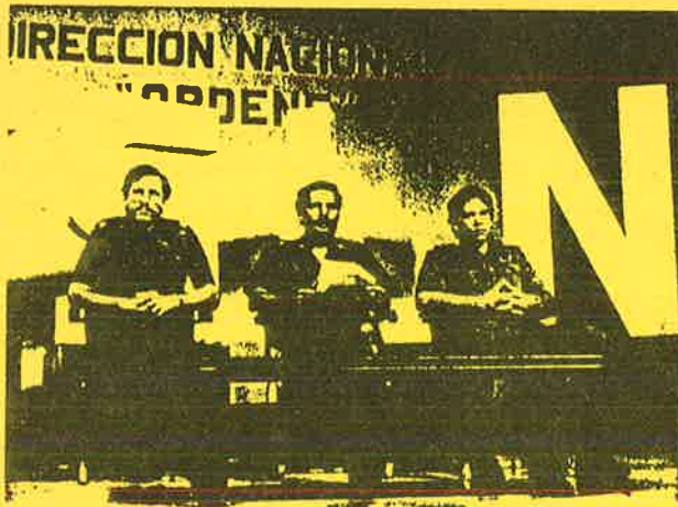
நிபேர்டே பல்பிரெட்டி ஜாஹிமி அட்டேகி லீசி வீலொகி

அண்டை நாடான கொண்டுராஸ்க்கும் எசைவடோருக்கும் ஓடி ததப்பிலுர்கள். ஜூலை 19ம் திகதி பிராங்கிஸ்கோ உரையோ வும் மிதுதித்தளபதிகரும் தலைநகரைவிட்டுத் தப்பியோடினார்கள் சனாடாண்டா ஆழதப்படையினர் மானசுவா நகரத்திற்குள் பிரவ வேசித்தனர். "தேசத்தை மீளக் கட்டியெழுப்பும் நிக்கரகுவா அரசாங்கம்" அதிகாரத்திற்கு வந்தது. அமெரிக்க ஏகாதிபத்தி யத்திக் கைப்பொம்மையாக இருந்த சமோசாவின் சர்வதிகார ஆட்சி முடிவுக்குக் கொண்டுவரப்பட்டது.