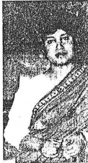
கக் கொள்வோம்." - இதுதான் அறிக்கை.

அண்மையில் ஸ்டேட்ஸ்மேன் பத்திரிகையில் 'சுர்ஆன் காலவதியாகிவிட்டதா' நஸ்ரீன் பேட்டி கொடுத்திருந்தார் என்று பிரச்சினை ஒன்று கிளம்பியது. தஸ்லிமா மறுப்பு ஒன்றை வெளியிட்டார். "மக்களின் வாழ்க்கையைத் தீர்மானிக்கிற குரான், வேதங்கள், பைபிள் போன்ற எல்லா மதநூல்களும் 'இடப் பொருத்தமில்லாதவை, காலப் பொருத்தமில்லாதவை' எந்த சமூக வரலாற்று நிலைமைகளில் அவை வெளியிடப்பட்டனவோ அந்த சந்தர்ப்பத்தை நாம் கடந்து விட்டோம். எனவே அந்தக் கருப்பொருள் நம்மை வழி நடத்தக் கூடாது. அவற்றை முழுவதும் திருத்த வேண்டுமா வேறு ஏதாவது செய்ய வேண்டுமா என்ற கேள்விக் கே இடமில்லை. நாம் முன்னே வேண்டுமானால், பழைய நூல்களைக் கடந்து நாம் போக வேண்டும். நமது ஆன்மீகத் தேவைகளுக்கு நாம் மனித நேயத்தையே புதிய நம்பிக்கையா