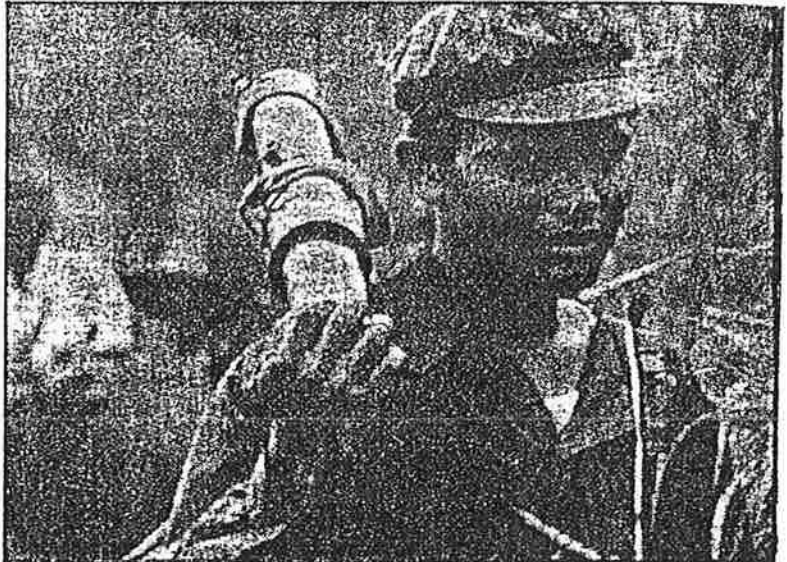
கட்சி, "ஃபன்சின்பெக்" கட்சிச் சரிகட்டி கடந்த ஜூலை 7-ம் தேதியன்று "கேமர் ரூஜ்" இயக்கத்துக்குத் தடை விதித்துள்ளது.

நன்றி : புதிய ஜனநாயகம் பொருளாதார யதார்த்தத்தை உலோக்குகிறது. (பிசீ) ஜெ. பெர்னாட் என்பவர் எழுதிய "உலகக் களவுகள்: ஏகாதிபத்திய தொழிற்கழகங்களும் புதிய உலக சூழலும்" என்ற நூலின் ஒரு அத்தியாயத்தின் சுருக்கம். நன்றி : தேர்வு வோர்ல்டு ரிளேஜன்ஸ்