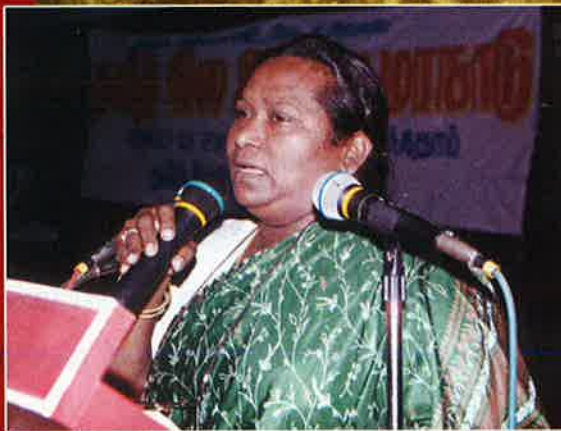
- நேர் காணல் உந்தி மனோரமா