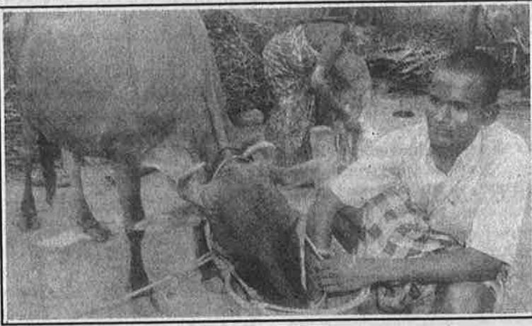
சிவகங்கை ராஜாவுக்கு 'இலவச விளம்பரம்' அளிக்கும் தினமணி சுயநிதிக் கல்லூரிக் கொள்ளையர்களுக்கும் சிறப்பு மலர் வெளியிடுகிறது.

இந்த நிலை, நேர்மையாகவும், நியாயமாகவும் சிந்திப்பவர்களுக்கு ஆத்திரத்தைத்தான் கிளறிவிடும். உயர் கல்வியை தனியாருடைய வியாபாரப் பொருளாக்கி, உயர்கல்வி நிறுவனங்களைப் பகற்கொள்ளைக் காடுகளாக்கி, ஏழை எளிய மக்களின் எட்டாப் பொருளாக்கியுள்ளவர்களுக்கு எதிரான ஆத்திரமாகத்தான் வெடிக்க வேண்டும். அதற்கு மாறாக, அனுதாபமும், இரக்க உணர்வும் கொண்டு தர்ம சிந்தனை மேலோங்கி, பரோபகாரம் செய்ய எண்ணுவது குற்றமாகும்.