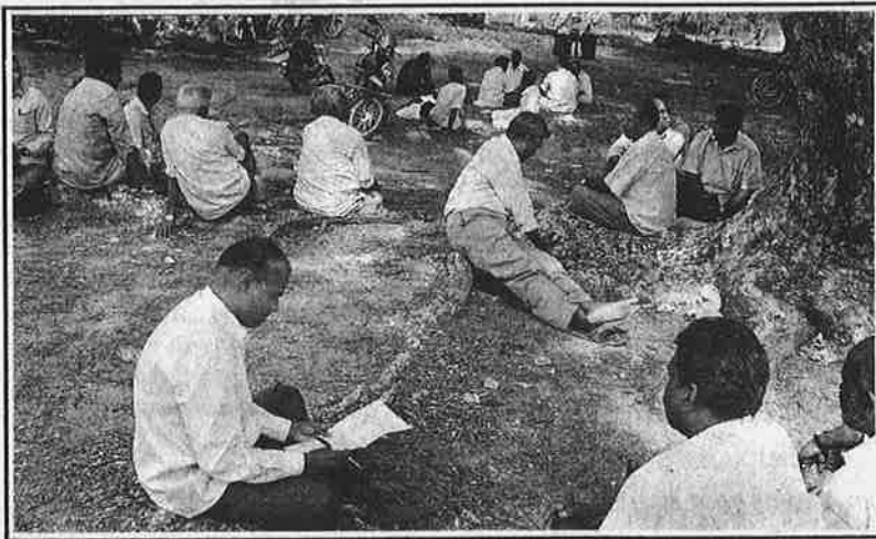
மன்னிப்புக் கடிதங்கள் எழுதும் கைகள் : கோழைத்தனமா - புத்திசாலித்தனமா?