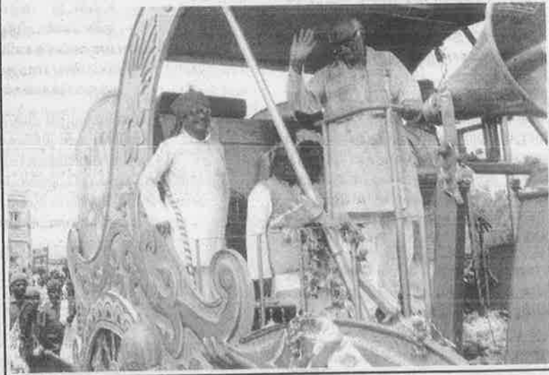
300 இடங்களில் முசுலீம்களுக்கெதிராக கலவரத்தை நடத்திய அத்வானியின் ரதயாத்திரை.

ராஜீவுக்கு எதிராக போபர்ஸ் ஊழலை முன்வைத்து பாரதீய ஜனதா மற்றும் போலிக் கம்ப்யூனிஸ்டுகளுடன் தேர்தல் கூட்டணி அமைத்திருந்த வி.பி. சிங்கோ அயோத்திப் பிரச்சினை குறித்து ஒரு வாக்குறுதி தருமாறு பாரதீய ஜனதா விடம் மன்றாடினார். "எந்த விதமான வாக்குறுதியும் தர முடியாது" என்று