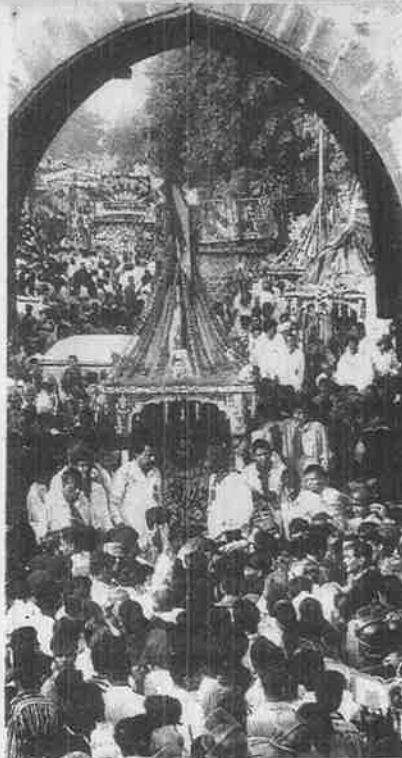
படுகொலைக்குப் பின் சென்ற மாதம் நடைபெற்ற ஜெகந்நாதர் யாத்திரை. 1969-இல் இந்த யாத்திரையை ஓட்டித் தூண்டப் பட்ட கலவரத்தில் 2000 பேர் கொல்லப்பட்டனர்.

பாகிஸ்தானிலிருந்து ஓடிவந்த அத்வானியைப் போன்ற அகதிகள் - குறிப்பாக வணிகர்கள் மற்றும் நடுத்தர