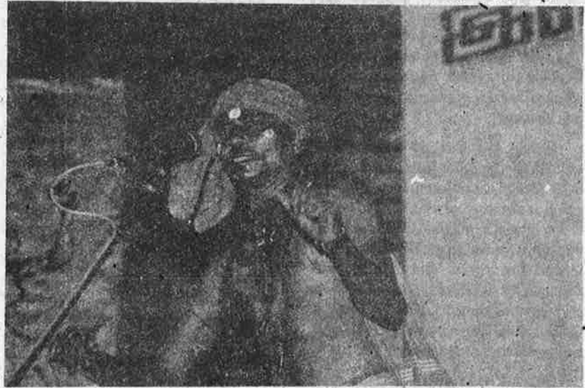
'நாகரிக' சமுதாயத்தின் இரட்டை வேடத்தைக் கேலி செய்யும் குறவன் குறத்தி ஆட்டம்.

நாடகத்தில் நாங்கள் அந்தக் கேள்வியை எழுப்பினோம். தருமன், பீமன், அர்ஜுனன், நகுலன், சகாதேவன், அம்மா குந்தி ஆறு பேரும் தப்பிச்சுட்டாங்க என்று சந்தோசப்பட்ட எந்த மனிதனும், அவர்களுக்குப் பதிலாக ஒடுக்கப்பட்ட ஆறு பேர் உயிரைக் கொடுத்தார்களே, அவர்களை எரித்து விட்டார்களே என்று கேள்வி கேட்டதே கிடையாது.