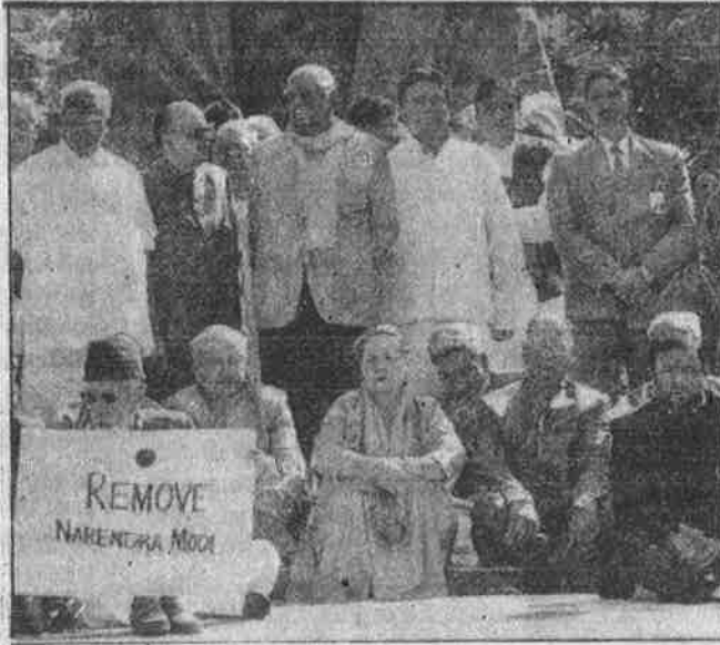
"மோடிக்குப் பதிலாக வேறொரு கேடி" எதிர்க்கட்சிகளின் கோரிக்கை.

என்ன கொள்கை? இனப்படுகொலை நடத்தும் மாநில அரசின் உரிமையைப் பாதுகாக்கும் கொள்கை! அரசியல் சட்டம் குஜராத் முசுலீம் மக்களுக்கு வழங்கியுள்ள உயிர்வாழும் உரிமையை குஜராத்