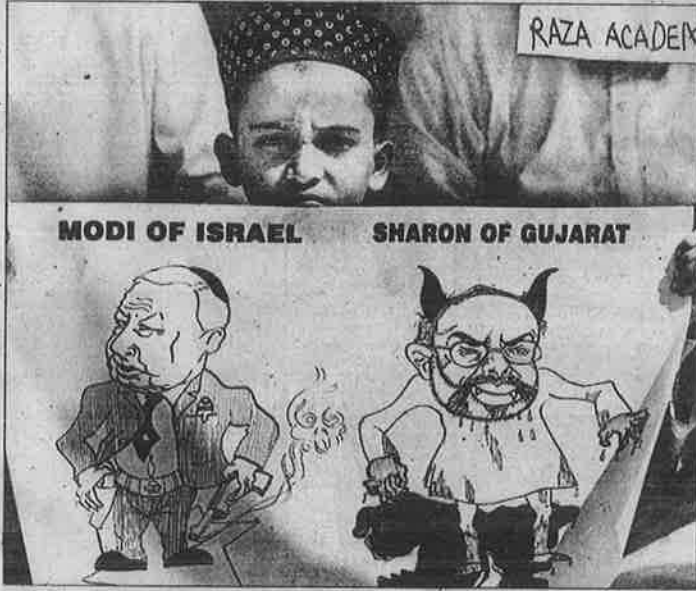
“இசுரேலின் மோடி, குஜராத்தின் ஷரோன்” மும்பையில் ஆர்ப்பாட்டம்.

உயிருடன் எரிப்பது, குழந்தைகளைக் கண்டதுண்டமாக வெட்டிக் கொல்வது, வாக்காளர் பட்டியலை வைத்துக் கொண்டு முசுலீம்களை வீடு வீடாகத் தேடிக் கொல்வது, முசுலீம் வர்த்தகர்களை ஒழித்துக் கட்டுவது, இந்து நடுத்தர வர்க்கத்தினரும் கொள்ளையில் பங்கேற்பது, இந்து மதவெறியர்களுடன் போலீசும் கூட்டுச் சேர்ந்து முசுலீம்களைக் கொலை செய்வது, மசூதிகளை இடிப்பது... என 1993 பம்பாய்ப் படுகொலையில் சிவசேனா - பா.ஜ.க. சும்பல் எதையெல்லாம் செய்ததோ அவையனைத்தும் முன்பைவிட விரைவாக, சூரமராக, திட்டமிட்ட முறையில் குஜராத்தில்