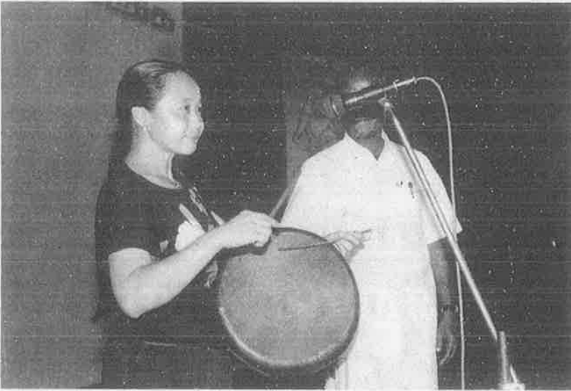
பறை குறித்து ஆய்வு செய்யும் ஜப்பானிய ஆய்வாளர், கலை நிகழ்ச்சிகளைத் துவக்கி வைக்கிறார்.