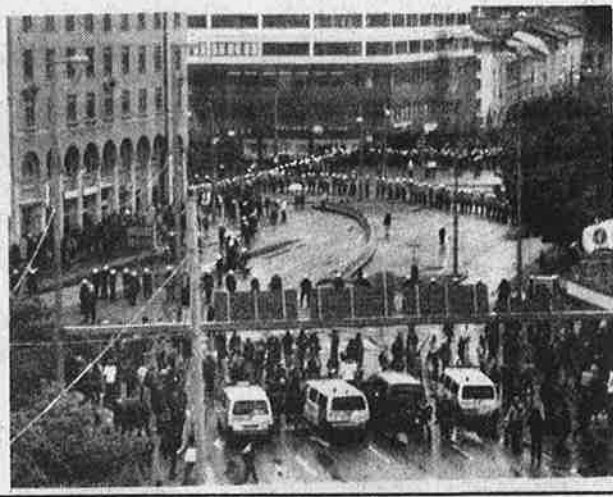
புஷ் மற்றும் ஐரோப்பிய ஒன்றியத் தலைவர்கள் கூடிய இடத்தை இரும்புக் கோட்டையாகக் காக்கும் போலீசு!

அவர்களெல்லாம் இருட்டடிப்பு செய்த ஒரு உண்மை என்ன தெரியுமா? சிறிய கடைகளோ வர்த்தக நிறுவனங்களோ ஒன்று கூடத் தாக்கப்படவில்லை. உலகம் முழுவதும் ஏழை மக்களைச் சுரண்டியும், குழந்தைகளைக் கசக்கிப் பிழிந்தும் கோடிக்கணக்கில் சொத்து சேர்த்த மெக்டொனால்டு போன்ற பேய்களை (பன்னாட்டு நிறுவனங்கள்) மட்டும்தான் ஆர்ப்பாட்டக்காரர்கள் குறி வைத்துத் தாக்கினார்கள். இந்த யுத்தம் சுமார் 2 மணிநேரம் நீடித்தது.