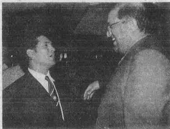
பிராண்டு டெண்டுல்கர் - ஏஜென்டு மங்கரேனிடம் தன்னுடைய 'திறமை'யால் கிடைத்த புகழை 100 கோடி ரூபாய்க்கு விற்கிறார்.

இல்லை. மங்கரேனஸ் சொல்லும் பணியனையோ, ஜட்டியையோ, துடைப்பக் கட்டையையோ காட்டி "இதை வாங்குங்கள்" என்று சொன்னால் போதும். டெண்டுல்கர் மேல் இருக்கும் நம்பிக்கையினால் மக்கள் அதை வாங்கி விடுவார்கள்.