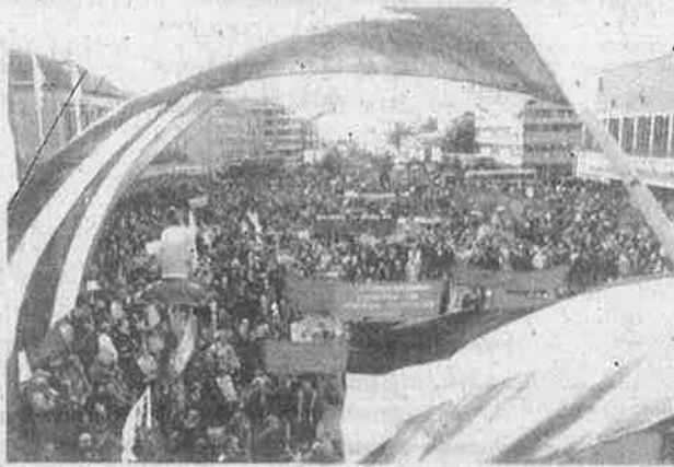
கோதன்பார்க் நகரில் போராட்டத் திரண்ட மக்களும் தொழிலாளர்களும்.

மறுநாள் ஸ்டாக்க்ஹோம் திரும்பிவிட்டோம். பத்திரிகை, வானொலி, தொலைக் காட்சி அனைத்திலும் எங்கள் வன்முறைதான் செய்தி. போலீசுதான் வன்முறையைத் துவக்கி வைத்தது என்பது பற்றி ஒரு வரிகிடையாது. துப்பாக்கிச் சூடு நடத்திய அதிகாரியைக் கதாநாயகன் போல சித்தரித்தனர். அவர்கள் தற்காப்புக்காகத்தான் சுட்டார்களாம். குண்டடிபட்டதோ முதுகில்!