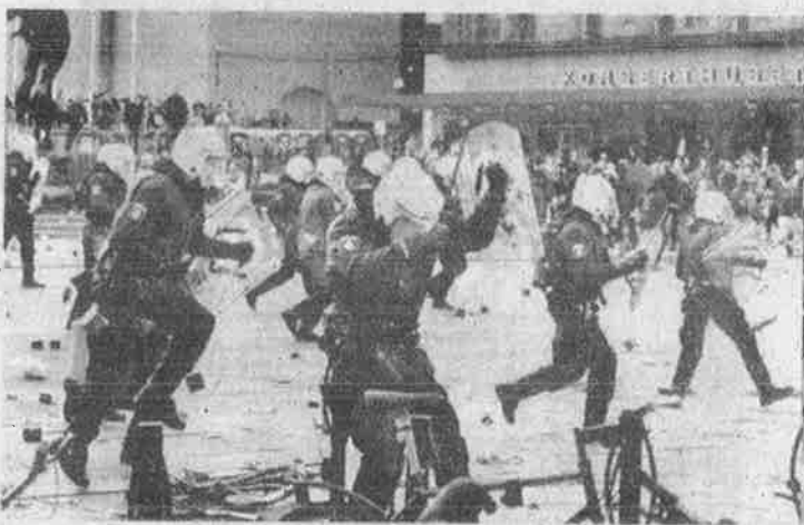
சுவீடன் போலீசின் வெறியாட்டம்.