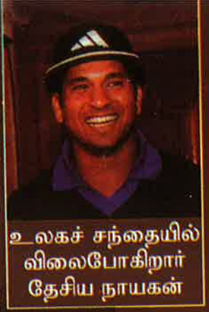
உலகச் சந்தையில் விலைபோகிறார் தேசிய நாயகன்