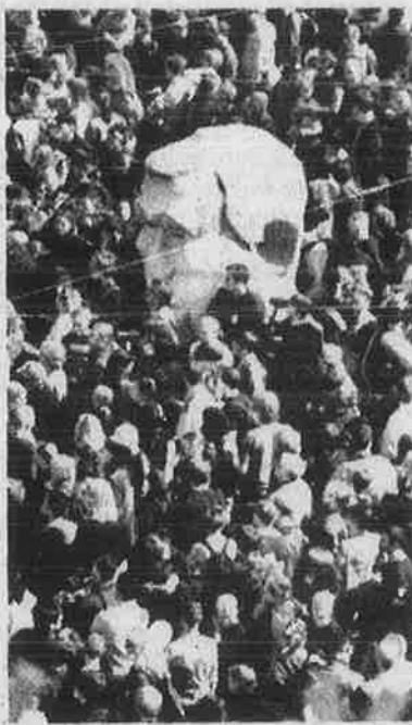
'அமெரிக்கா மனித குல எதிரி' சுவீடன் மக்கள் முழக்கம்.

ஐரோப்பிய ஒன்றியம், ஜி-8 நாடுகள், உலக வர்த்தகக் கழகம் ஆகிய இவர்களது