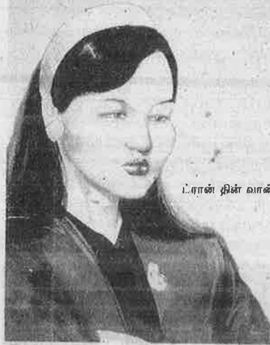
ட்ரான் தின் வான்

காக போலீசால் வீட்டுக்கு அழைத்து வரப்படுகிறார். வீட்டில் எங்காவது வெடிகுண்டுகள் உண்டா என்று சோதிக்கிறது போலீஸ்; நகூயென் ஒரு நேர்மையான தொழிலாளி - தனது இனிய நண்பன், காதலன் - அது மட்டுமே குயென்னுக்குத் தெரியும். கட்டுப்படுத்த முடியாமல் குயென்கதறுகிறார்; அழுகிறார்.