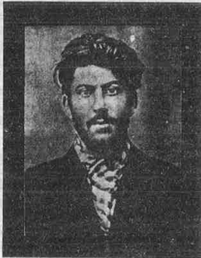
இளவயதில் தோழர் ஸ்டாலின்

காங்குவல்ட், சோல்ஜெனிதிசின், மேட்வேடேவ் மற்றும் பிறர் சோவியத் ஒன்றியம் பிரசுரித்த புள்ளி விவரங்களைத்தான் பயன்படுத்தியுள்ளனர்; உதாரணமாக தேசிய மக்கள் தொகைப் புள்ளி விவரங்கள்; இவற்றோடு அந்த நாட்டின் குறிப்பான நிலைமையைக் கணக்கில் கொள்ளாமல் எந்த விகிதத்தில் மக்கள் தொகை அதிகரித்திருக்க வேண்டும் என்று யூகித்தார்களோ அதைச் சேர்த்தார்கள்; தமது சொந்த யூகத்தின்படி குறிப்பிட்ட ஆண்டின் இறுதியில் இவ்வளவுபேர்