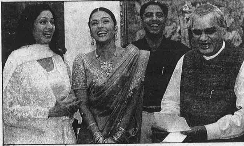
வறட்சி நிவாரணநிதியளிக்கும் பம்பாய் நட்சத்திரங்களிடம் - வாஜ்பாயின் அரட்டை.

தண்ணீருக்குக் காசா? என்று தவித்துக் கேட்பவர்கள் இருக்கும் இந்த நாட்டில்தான் தாய் தந்தைக்கு ஒரு கழிப்பறை தனக்கு ஒரு கழிப்பறை தன் நாய்க்கு ஒரு கழிப்பறை கட்டிக் கொண்டு அத்தனைக்கும்