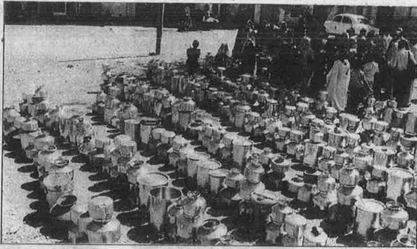
குஜராத், ராஜ்கோட்டிற்கு அருகே வாரம் இருமுறை அரைமணிநேரம் நிற்கும் தண்ணீர் வண்டிக்காக அணிவகுக்கும் பாத்திரங்கள்.

ஊத்தி மூடக் காத்திருக்கிறது கலைஞர் அரசு.