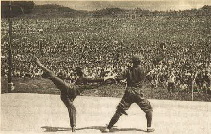
1967 சீனாவின் ஹார்பின் மாநிலத்தில் நடைபெறும் புரட்சிகர கலை நிகழ்ச்சி

'எத்தனை ஆண்டுகள்' - என்று என்னை வேண்டிய ஜெயலலிதா 'இந்திய நாகரீகத்திற்கு 5000 ஆண்டு' - என்று கணக்குச் சொல்கிறார்.