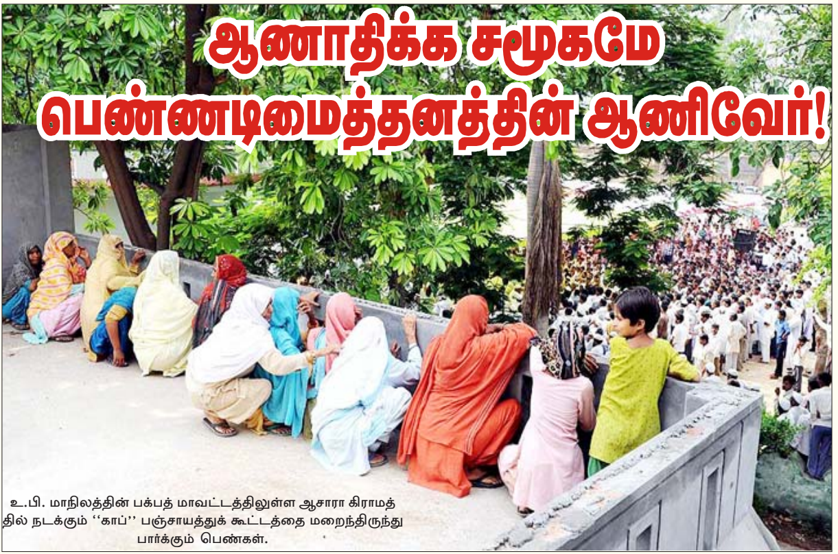
உ.பி. மாநிலத்தின் பக்பத் மாவட்டத்திலுள்ள ஆசாரா கிராமத்தில் நடக்கும் “காப்” பஞ்சாயத்துக் கூட்டத்தை மறைந்திருந்து பார்க்கும் பெண்கள்.

“பெண்களைப் பொருத்தவரை, தெருக்களும் வெளியிடங்களும் அவர்களுக்குப் பாதுகாப்பற்றவை என்றும்; வீடுதான், குடும்பங்கள்தான் அவர்களுக்கு முழுமையான பாதுகாப்பைத் தரும் ஒரே இடமென்றும்” சராசரியான இந்திய மக்களால், குறிப்பாகப் பெண்களாலும் நம்பப்படுகிறது.