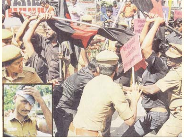
அனைத்து சமுதாயப் பாதுகாப்பு பேரவை சென்னையில் நடத்திய கூட்டத்தைக் கண்டித்து விடுதலைச் சிறுத்தைகள், திராவிட விடுதலை இயக்கம் மற்றும் தமிழ்நாடு மக்கள் கட்சியினர் நடத்திய ஆர்ப்பாட்டத்தை தடியடி நடத்திக் கலைக்கும் போலீசு.

சாதாரண மக்கள்தரும் எந்தவொரு புகாரையும் இழுத்தடிக்காமல் போலீசுக்காரர்கள் பதிவு செய்து விடுவதில்லை என்பது ஊரறிந்த உண்மை. அதிலும் கிராமப் புறங்களைச் சேர்ந்த தாழ்த்தப்பட்டோர் போலீசு