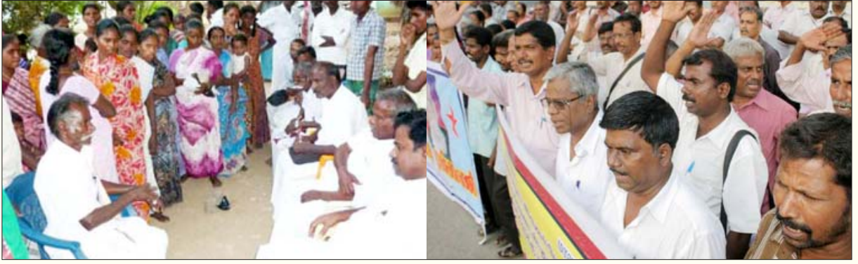
புதுக்கோட்டை மாவட்டம் வண்ணாரப்பட்டியில் தப்படிக்க மறுத்ததற்காகத் தாழ்த்தப்பட்டோர் குடியிருப்பு தாக்கப்பட்டது குறித்து நடந்த விசாரணை (இடது); இருகூர் பஞ்சாயத்தைச் சேர்ந்த ஆதர்பகவுண்டன்புதூரில் வசிக்கும் தாழ்த்தப்பட்ட மக்களுக்குப் பொது சுடுகாட்டில் புதைக்கும் உரிமை மறுக்கப்படுவதால், தனிச்சுடுகாடு கேட்டு, அம்மக்கள் தீண்டாமை ஒழிப்பு முன்னணியின் கீழ் அணிதிரண்டு நடத்திய போராட்டம்.

பெருமை பேசும் இணையதளமொன்று குளுரைக்கிறது. ஆனால், வன்னிய சாதிப் பெண்களுக்கு வன்னிய னாலும், கவுண்டர் சாதிப் பெண்களுக்கு கவுண்ட னாலும்தான் ஆபத்து என்பதை இக்கொளவக் கொலை கள் எடுத்துக் காட்டுகின்றன.