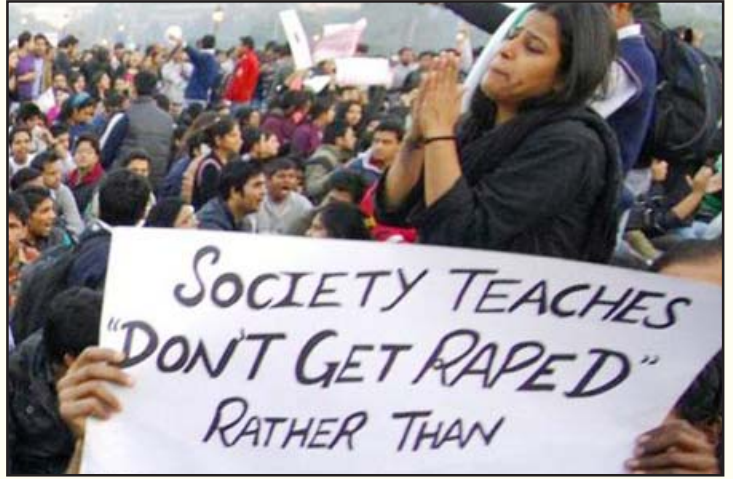
ஆணாதிக்க சமூகத்தின் இழிவைச் சாடி, "வல்லுறவை ஏவாதே என்று ஆண்களுக்குக் கற்றுக்கொடுப்பதற்குப் பதிலாக, பாலியல் வல்லுறவுக்கு ஆளாகாதே என்று பெண்களுக்குத்தான் சமூகம் பாடம் நடத்துகிறது" என்ற முழக்க அட்டையுடன் டெல்லியில் நடந்த ஆர்ப்பாட்டம்.

மே.வங்கத்தில், ஒரு பெண்ணை 5 பேர் கொண்ட கும்பல் ஒரு பூங்காவில் பாலியல் வன்முறைக்கு ஆளாக்கிய விவகாரம் அண்மையில் வெளிச்சத்துக்கு வந்த போது, "அந்தப் பெண்ணுக்கும் வாடிக்கையாளர்களுக்கும் இடையே பணப்பட்டுவாடாவில் தகராறு வந்ததால், அவர்கள் தன்னை வல்லுறவு கொண்டதாக அப்பெண் பொய்ப்புகார் கொடுத்துள்ளார்" என்று கூச்சநாச்சமின்றி பேசியுள்ளார், திரிணாமுல் காங்கிரசு கட்சியின் மூத்த தலைவர்களுள் ஒருவரும் நாடாளுமன்ற பெண் உறுப்பினருமான டாக்டர் கோகோலி கோஷ். இந்த விவகாரம், தனது அரசாங்கத்தை இழிவுபடுத்துவதற்காக இட்டுக்கட்டப்பட்டுள்ளது என்றார், அம்மாநிலத்தின் பெண் முதல்வரான மமதா பானர்ஜி.