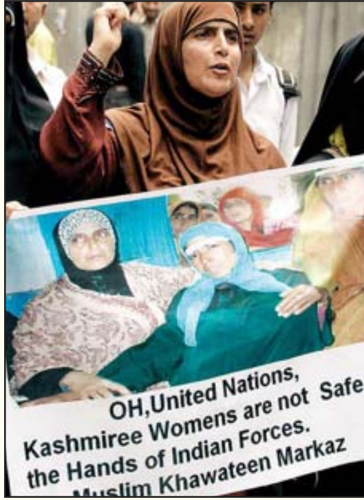
இந்தியப் பெண்களின் முதல் எதிரி யார் என்பதை உலகுக்கு உணர்த்திய போராட்டம்: “ஐ.நா. மன்றமே, இந்திய இராணுவப் படைகளின் இரும்புப் பிடியில் சிக்கியுள்ள காஷ்மீரின் பெண்களுக்குப் பாதகாப்பு இல்லை!” என்ற பதாகையுடன் காஷ்மீர் பெண்கள் நடத்திய ஆர்ப்பாட்டம்.

காஷ்மீரிலும் வடகிழக்கு மாநிலங்களிலும் குவிக்கப்பட்டுள்ள இராணுவத்தினர் மீது பொதுமக்கள் எவரும் அச்சீருடை அணிந்த கிரிமினல் கும்பல்கள் நடத்திவரும் பாலியல் வன்கொடுமைகளை, மனித உரிமை மீறல்களைப் பற்றி வாய்திறக்கக் கூடாது என்பதற்காகவே ஆயுதப்படை சிறப்பு அதிகாரச்சட்டமும், கலவரப்பகுதி தடைச்சட்டமும், பயங்கரவாதத் தடுப்புச்சட்டங்களும் போடப்பட்டுள்ளன. தீவிரவாதத்தையும் பயங்கர