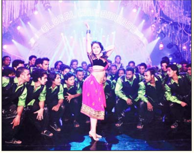
குத்தாட்டம்: கும்பல் பாலியல் வன்முறையின் கலை வடிவம்.

தமிழ் சினிமாவின் குத்துப்பாட்டு, இந்தி சினிமாவின் “ஐட்டம்” பாடல்கள் போன்றவை இதுவரை இலைமறை காயாக இருந்த பாலியல் உறவுக்காட்சிகளை அப்பட்டமான நடன அசைவுகளாக மாற்றி, பெண்களைச் சீண்டுவதற்குத் தோதானபுது விதமான கழிசடைவார்த்தைகளையும் அறிமுகப்படுத்திச் சீரழிவையே கலாச்சாரமாக்குகின்றன. இந்த வகைப்பட்ட பாடல் காட்சிகளால் உசுப்பேற்றப்படும் ஆண், பொது இடங்களில் நடமாடும் பெண்கள் அனைவரையும் போகப் பொருளாகவே பார்க்கிறான். பேருந்துகள், திரையரங்குகள், வேலை செய்யும் இடங்கள் என ஆண், பெண் இருபாலரும் புழங்கும் எல்லா வெளிகளிலும் ஆண்கள் பெண்களைச் சீண்டுவதும் பாலியல் ரீதியாகத் துன்புறுத்துவதும் அதிகரித்து வருகிறது.