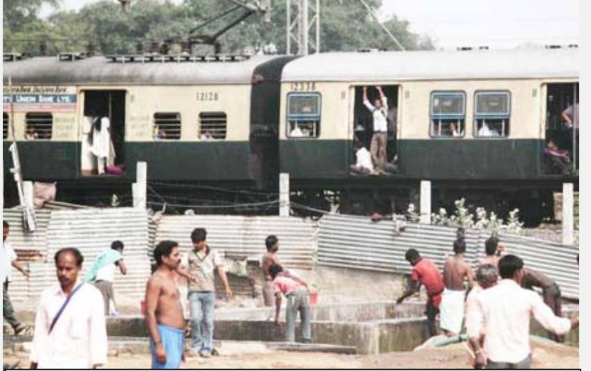
சென்னை-திரிகுலத்தில் 450-க்கும் மேற்பட்ட வடமாநிலக் கட்டிடத் தொழிலாளர்கள் தங்க வைக்கப்பட்டுள்ள தகரக் கொட்டகைக் குடியிருப்பு.

“புதிதாக வந்த வெளிமாநிலத்தவர்களுக்குக் குடும்ப அட்டை, வாக்காளர் அட்டை ஆகியவை வழங்கக் கூடாது. த.தே.பொ.க.வின் இந்நிலைப்பாடு உலகெங்கு முள்ள ஒவ்வொரு நாடும் கடைப்பிடிக்கும் விதி