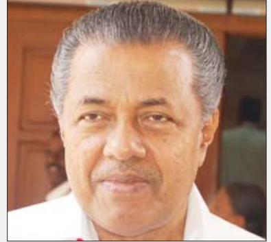
“கட்சிக் கட்டுப்பாட்டை மீறிய அச்சுதானந்தனைக் கட்சியிலிருந்து தற்காலிக நீக்கம் செய்ய வேண்டும்” என்று தலைமைக்கு நெருக்கடி கொடுக்கும் கேரள சி.பி.எம். செயலாளர் பினாரயி விஜயன்.