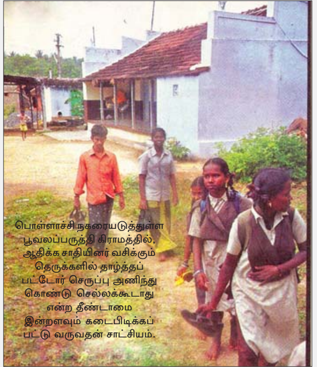
பொள்ளாச்சி நகரையடுத்துள்ள பூவலப்பருத்தி கிராமத்தில், ஆதிக்க சாதியினர் வசிக்கும் தெருக்களில் தாழ்த்தப்பட்டோர் செருப்பு அணிந்து கொண்டு செல்லக்கூடாது என்ற தீண்டாமை இன்றளவும் கடைபிடிக்கப்பட்டு வருவதன் சாட்சியம்.