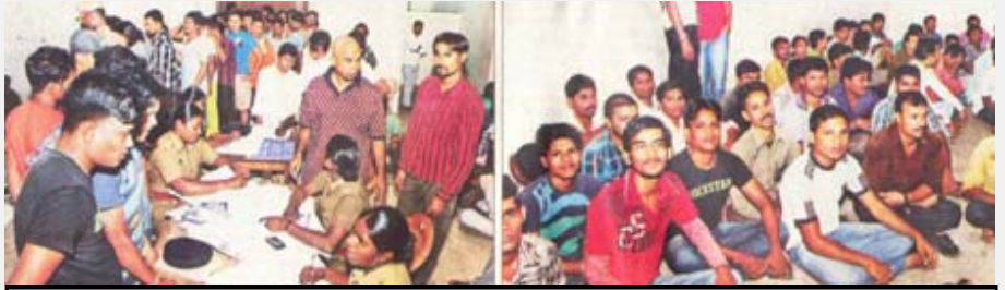
திருப்பூரில் வேலை செய்துவரும் வட மாநிலத் தொழிலாளர்கள் பற்றிய விவரங்கள் மற்றும் அவர்களின் கைரேகைகளைப் பதிவு செய்யும் போலீசார்