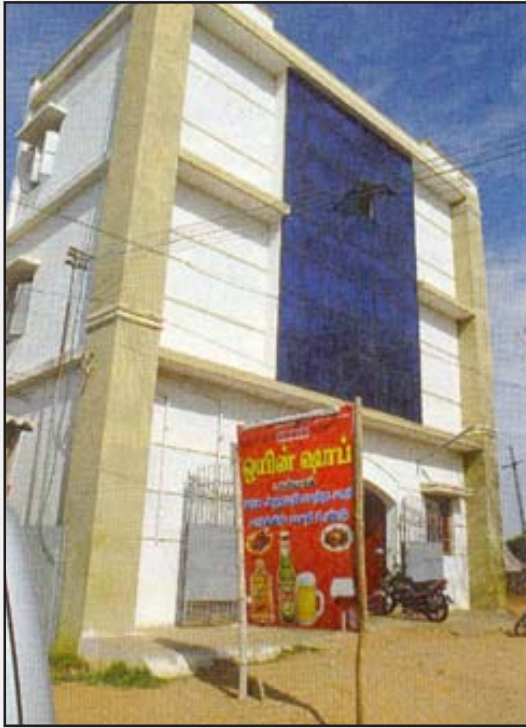
ஏற்றுமதிமந்த நிலையால் நெருக்கடியில் சிக்கிய திருப்பூரின் ஜவுளி நிறுவனம், இன்று டாஸ்மாக் பாராக மாறியுள்ள அவலம்.

ஆளும் கும்பல் முன்வைத்துள்ள தீர்வுகள் மீண்டும் ஏகாதிபத்திய நிதிமூலதனம் மற்றும் தரகுப் பெருமுதலாளிகளின் நலனைத்தான் அடிப்படையாகக் கொண்டிருக்கிறதே தவிர, நெருக்கடிக்குத் தீர்வாக உள்நாட்டுச் சந்தையை வலுப்படுத்த திட்டம் ஏதுமில்லாததால், அது தவிர்க்கவியலாமல் மீண்டும் பொருளாதாரத்தை நெருக்கடிக்குத்தான் தள்ளும். உள்நாட்டுச் சந்தையை விரிவாக்கி வலுப்படுத்த வேண்டுமானால், புரட்சிகரமான முறையில் அரைநிலப்பிரபுத்துவ உறவுகள் வீழ்த்தப்பட்டு, நிலச் சீர்திருத்தமும் விவசாயத்துறையில் மாற்றங்களும் செய்வதோடு, அபிவிருத்தித் திட்டங்களுக்கு அரசாங்கம் பெருமளவில் முதலீடும் செய்ய வேண்டும். அதற்கு மாறாக, முதலீடு பற்றாக்குறை என்ற வாதத்தை வைத்து அந்நிய நிதி மூலதனத்துக்குக் கதவை அகலத் திறந்து விடுவது தான் ஆளும் கும்பல் முன்வைக்கும் தீர்வு. “குடிகாரனின்