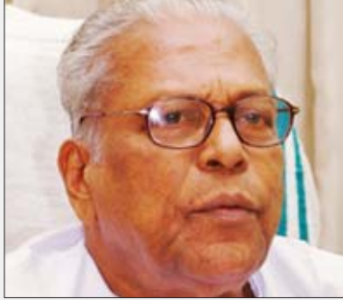
“பினாரயி விஜயனின் தூண்டுதலாலேயே இப்படுகொலை நடந்துள்ளது” என்று பகிரங்கமாகக் குற்றம் சாட்டும் முன்னாள் கேரள முதல்வரும் தற்போதைய கேரள சட்டமன்ற எதிர்க்கட்சித் தலைவருமான அச்சுதானந்தன்.