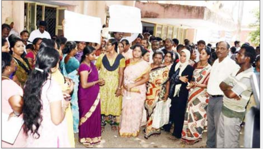
சென்னையில் உள்ள மெட்ரிகுலேசன் பள்ளிகள் இயக்குநர் அலுவலகத்தின் முன்பாகத் திரண்டு தனியார் பள்ளி முதலாளிகளின் கட்டணக் கொள்ளைக்கு எதிராக முழக்கமிடும் பெற்றோர்கள்.

மேல் தீனி போட்டு பங்களா நாய் போல வளர்த்து வருகிறார், ஜெயா. போலீசு துறையில் புதிதாக 13,320 பேரை நியமிக்க நடவடிக்கை; போலீசுக்கு 36,000 வீடுகளைக் கட்டிக் கொடுக்க 337 கோடி ரூபாய் ஒதுக்கீடு; போலீசாரின் மருத்துவ வசதிகளை மேம்படுத்த ஒரு கோடி ரூபாய் ஒதுக்கீடு; போலீசு நிலையங்கள் என்பதே வதை முகாம்கள் என அம்பலப்பட்டுப் போனபின்னும், அந்நிலையங்களை ஏதோ மக்கள் வசதிக்காக நவீனப்படுத்துவதாகக் கூறி, அதற்கு 100 கோடி ரூபாய் நிதி ஒதுக்கீடு; இராணுவத்தினரைப் போல போலீசுக்கும் மது பாட்டில் கள் உள்ளிட்ட நுகர்வுப் பொருட்களை மலிவாக விற்கச் சிறப்பு அங்காடிகள் என இந்த ஓராண்டிற்குள் பல சலுகைகள் போலீசுக்கு வாரி வழங்கப்பட்டுள்ளன.