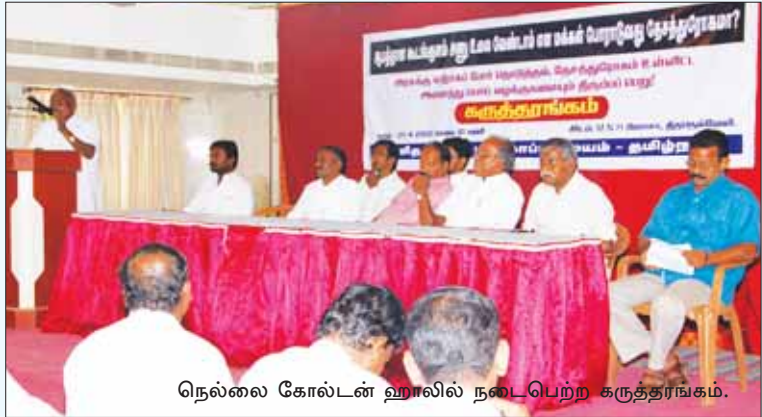
நெல்லை கோல்டன் ஹாலில் நடைபெற்ற கருத்தரங்கம்.

பாகிஸ்தானுக்கு 5000 மெகாவாட் மின்சாரம் விற்கப் போவதாக கூறிக்கொண்டே, மின்சாரப் பற்றாக்குறையைப்