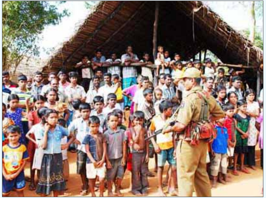
போர் முடிந்து மூன்றாண்டுகளாகியும் தீராத அவலம்: முள்வேலி முகாம்களில் வதைப்படும் ஈழத்தமிழர்கள்.

இதுதான் காரணமெனில், காஷ்மீரில் கருத்துக் கணிப்பை நடத்திவிட்டு அப்புறம் ஈழத்தைப் பற்றி பேச என்று இலங்கை அமைச்சர் சாடுவதைக் கேட்டுக் கொண்டு மன்மோகன் -சோனியா கும்பல் மட்டுமின்றி, இந்துத்துவ பா.ஜ.க.வும் மவுனம் சாதிக்கிறதே அது, ஏன்? இலங்கையுடன் இந்தியா அனுசரித்துப் போவது மட்டுமல்ல. பாகிஸ்தானுக்கு எதிரான போர்களை நடத்தி, இந்திய தேசியத்தை பாக்க. எதிர்ப்பின்மீது கட்டிய இந்திய ஆட்சியாளர்கள், இப்போது பாகிஸ்தானுடன் பொருளாதார-வர்த்தக ஒப்பந்தங்களைப் போட்டுக் கொண்டுள்ளதோடு மின்சாரமும் கொடுக்கப் போவதாக அறிவித்துள்ளார்கள். ஏன் இப்படி பாகிஸ்தானுடன் இந்தியா இணக்கமாக நடந்து கொள்கிறது என்பதையும் பரிசீலிப்பது அவசியம்.