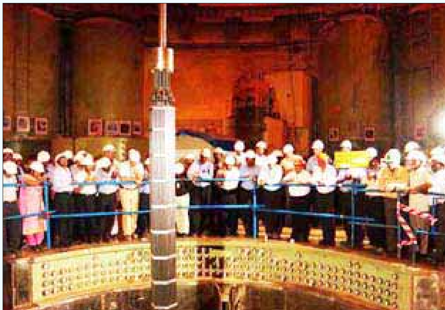
கூடங்குளம் அணு உலையில் மீண்டும் பணிகள் தொடங்கிய நிலையில், அணு உலையில் வெற்று எரிபொருள் பொருத்தப்படுவதை மேற்பார்வையிடும் நிபுணர்கள்.