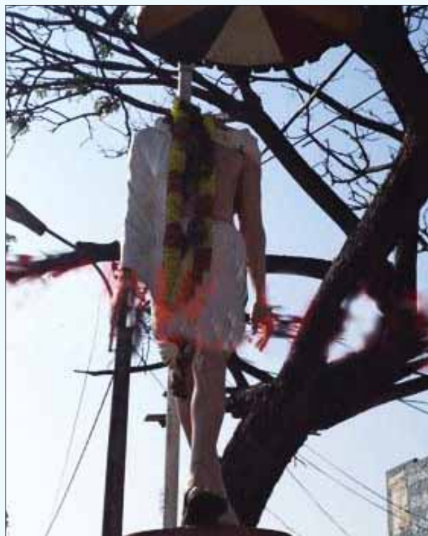
மட்டக்கிளப்பில் சிங்கள வெறியர்களால் உடைக்கப்பட்ட காந்தி சிலை. உணர்ச்சியற்றுக் கிடப்பது சிலை மட்டுமல்ல, இந்திய அரசும்தான்.

ஈழத் தமிழர்களை அடைத்து வைத்துள்ள முகாம்களில், தேர்ந்தெடுக்கப்பட்ட ஒரு சில முகாம்களை மட்டும் பார்வையிட அனுமதித்த ராஜபக்சே அரசு, இந்திய எம்.பி.க்கள் குழுவை குருகுரு அறைகளில் உட்காரவைத்து, தட்புடல் விருந்து வைத்து வழியனுப்பி வைத்துள்ளது. இன்னமும் ஒரு லட்சத்துக்கு மேற்பட்ட தமிழர்கள் மீள்குடியேற்றம் செய்யப்படாத நிலையில், முள்வேலி முகாம்களில் 6,000 பேர்கள் தான் இருக்கிறார்கள்.