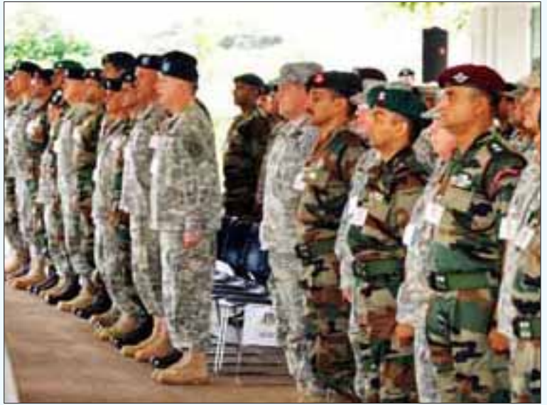
இந்தியாவும், அமெரிக்காவும் இணைந்து தீவிரவாத எதிர்ப்பு தொடர்பாக கடந்த மார்ச் மாதம் இந்தியாவில் நடத்திய "யுத் அப்யாஸ்" என்ற இராணுவப் பயிற்சியில் கலந்து கொண்ட இரு நாடுகளைச் சேர்ந்த சிப்பாய்கள்.

அரியானா மாநிலத்தில் மேல்சாதி ஒடுக்குமுறைகளுக்கு எதிராகப் போராடிய தாழ்த்தப்பட்டோரும், பஞ்சாபில் அரசின் நாசகார விவசாயக் கொள்கைகளுக்கு எதிராகப் போராடிய விவசாய சங்கத்தைச் சேர்ந்தவர்களும் தீவிரவாதிகளாக முத்திரை குத்தப்பட்டு இச்சட்டத்தின்கீழ் கைது செய்யப்பட்டுள்ளனர். மாவோயிஸ்டுகளின் செயல்பாடுகளே இல்லாத குஜராத்தில் மாவோயிஸ்ட் ஆதரவாளர்கள் எனக் குற்றஞ்சுமத்திப் பலரைக் கைது செய்துள்ள மோடி அரசு, அவர்கள் இன்னென்ன குற்றங்களைச் செய்துள்ளனர் என்பதைக் கூட இதுநாளவரை பதிவு செய்ய மறுத்து வருகிறது.