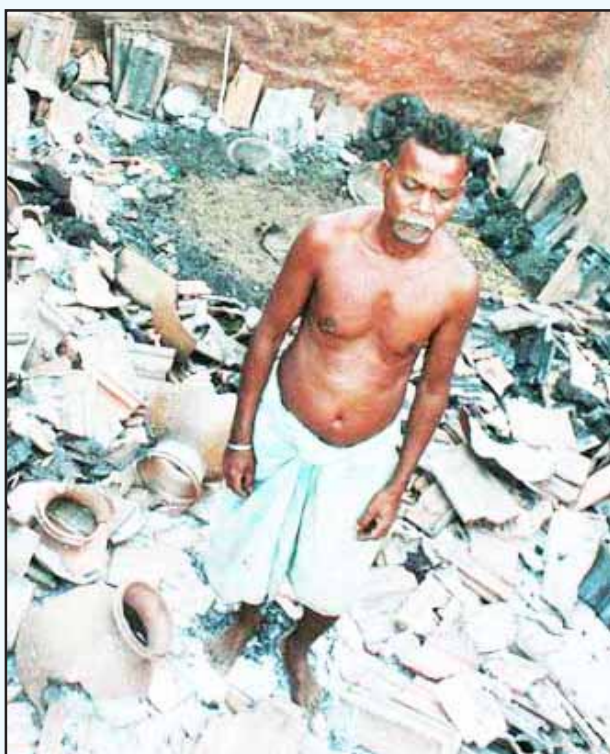
கடந்த ஆண்டு மார்ச் மாதம் கோயா கமாண்டோ படையும் மத்திய ரிசர்வ் போலீசு படையும் இணைந்து சத்தீஸ்கரின் மொர்பள்ளி, திம்மாபுரம், தர்மேதிலா கிராமங்களில் புருந்து நடத்திய தேடுதல் வேட்டையின் பொழுது, அப்படைகளால் அடித்து நொறுக்கப்பட்ட ஒரு பழங்குடியின விவசாயியின் வீடு (கோப்புப் படம்)

பன்னாட்டு நிறுவனங்களுக்கு நாட்டைக் கூறு போட்டு விற்பதில்தான் இவர்களின் நலன்கள் பின்னிப் பிணைந்துள்ளன. அதனால் தான் சொல்லி வைத்தாற்போல இவர்கள் அனைவரும் இவ்விசயங்களில் ஒரே விதமாக நடக்கிறார்கள். நமது உரிமைகளுக்காகச் சட்டரீதியாகப் போராடி வெற்றி பெற முடியும் என்பது போன்ற