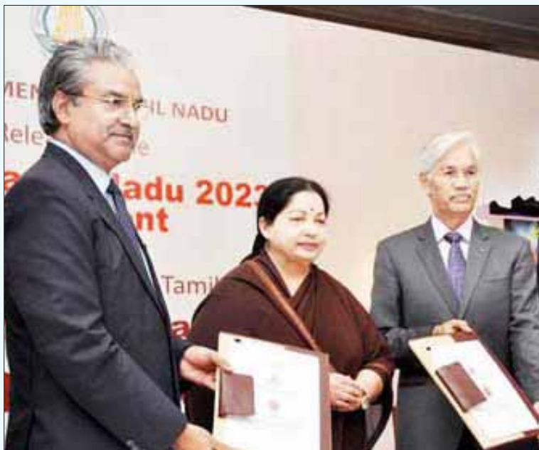
பல இலட்சம் கோடி அரசுப் பணத்தை வாரியிறைத்து, உள்நாட்டு - வெளிநாட்டு கார்ப்பரேட் நிறுவனங்களின் கொள்ளைக்காக உலக வங்கி அதிகாரிகளால் தயாரிக்கப்பட்ட “2023 தொலைநோக்குத் திட்ட”த்தை வெளியிடும் ‘நிர்வாகச் சூர்ப்புலி’ ஜெயலலிதா.

நாலாந்தர நடிக்கைக்குரிய தகுதி கூட இல்லாத ஜெயலலிதா, எம்.ஜி.ஆரின் தயவால் முன்னணி நாயகியாகி விட்டதைப் போலவே, அரசியலிலும் அதிகார வர்க்கத்தினர், வல்லுநர்கள், நிபுணர்கள் தயாரித்துக் கொடுக்கும் உரைகள், அறிக்கைகள், திட்டங்களை வாசித்தே “புரட்சித்தலைவி” யாகவும் திகழ்கிறார். அந்தவகையில் இந்த ஆண்டு சட்டப்பேரவையின் வரவு-செலவுக் கூட்டத்தொடருக்கு ஓரிரு நாட்களுக்கு முன்பாக 2023 ஆண்டுக்கான “தொலைநோக்குத் திட்டம்” என்ற உலக வங்கி அதிகாரிகளின் தயாரிப்பு ஒன்றை வழக்கமான “ஜெயா புகழ்பாடி பூங்கொத்து வழங்கும்” விழாவில் வெளியிட்டார். அடுத்தநாளே, போலீசுக்கு பல நவீன மய, நலத்திட்ட நிதி ஒதுக்கீடுகள், பதவிகள் அறிவித்தார். கூடவே, கல்வியில் கணினி மயமாக்கம், புதிய பேருந்துகள் வருமென அறிவித்தார். வரவு-செலவுத் திட்ட சட்டப்பேரவைக் கூட்டத்திற்கு வெளியே திட்ட அறிவிப்புகள் செய்வதை, கருணாநிதியும், ஸ்டாலினும் கண்டித்த மறுநாளே வழக்கம்போலத் திடீர்பல்டி அடித்தார்; இந்த அறிவிப்புகள் எதுவும் புதிதில்லை; செய்தி ஏடுகள் தவறாக எழுதிவிட்டன என்று குப்புறவிழுந்து தனது அரசியல் “திறமை”யை வெளிப்படுத்தினார். ஆனால், ஜெயாவின் துதிபாடிகளான இந்து, தினமணி,