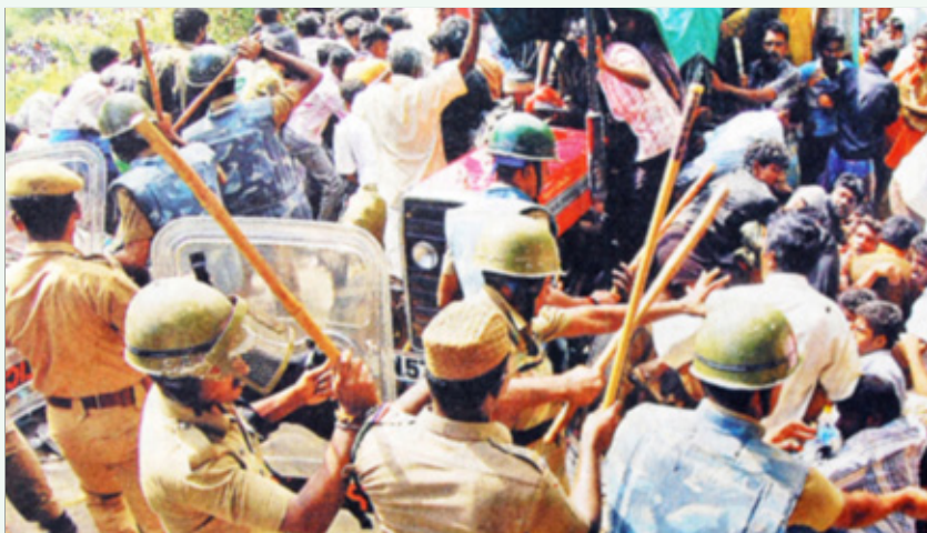
முல்லைப் பெரியாறு அணை நோக்கிச் சென்ற தேனி மாவட்ட விவசாயிகளை கம்பம் மெட்டு மலையடிவாரத்தில் வழிமறித்துத் தாக்கும் தமிழக போலீசு: ஜெயா அரசின் இரட்டை வேடம்

இந்தப் பொய்ப் பிரச்சாரத்தின் மூலம் கிளப்பப்பட்ட பீதி, இடுக்கி அணைக்கான நீர்த் தேவைக்காக கேரளம் கொடுத்து வந்த நிர்ப்பந்தம் ஆகியவற்றை முகாந்திரமாகக் கொண்டு எம்.ஜி.ஆர். ஆட்சியும் அதன் மலையாள அதிகாரிகளும் சதித்தனமாக கேரளாவுக்குப் பல சலுகைகளைத் தந்தனர். அணையின் பாதுகாப்பு பொறுப்பு கேரள அரசுக்கு அளிக்கப்பட்டது. நீர்த்தேக்கப் பகுதிக்கான நில வாடகை, மின் உற்பத்திக்கான குத்தகை ஆகியவற்றை உயர்த்தவும், இடுக்கி