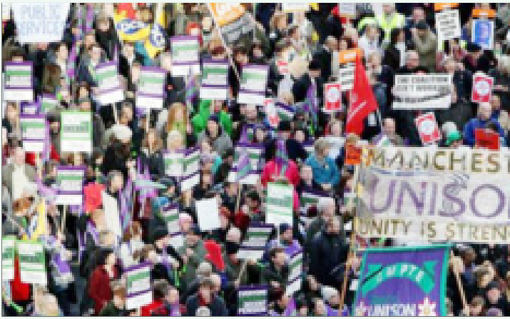
வருங்கால வைப்பு நிதியைப் பங்குச் சந்தையில் கொட்டிச் சூதாடும் நிதியாதிக்கக் கும்பல்களுக்கு எதிராக இங்கிலாந்தின்-மான்செஸ்டர் நகரில் நடந்த ஆர்ப்பாட்டப் பேரணி.

இத்தனியார் முதலீட்டு நிறுவனங்கள் கணக்கு வழக்குகளை ஒழுங்காக வைத்திருப்பார்களா, தொழிலாளர்கள் ஓய்வு பெறும்பொழுது அவர்களின் சேமிப்பை முறையாகத் திரும்ப ஒப்படைப்பார்களா எனக் கேட்டால், அவர்களைக் கண்காணிப்பதற்குத்தான் ஓய்வூதிய ஒழுங்குமுறை ஆணையத்தை உருவாக்கியிருப்பதாகக் கூறுகிறார்கள். வேலிக்கு ஓணாண் சாட்சியாம். தொலை தொடர்புத் துறையிலும் காப்பீடு துறையிலும் மின் துறையிலும் அமைக்கப்பட்டுள்ள ஒழுங்காற்று ஆணையங்கள் அத்துறைகளில் நுழைந்துள்ள தனியார் கார்ப்பரேட் நிறுவனங்களின் கொள்ளையைச் சட்டபூர்வமாக்கும் திருப்பணியைத் தான் செய்து வருகின்றன. ஒவ்வொரு தொழிலாளியிடமிருந்தும் மாதந்தோறும் பிடித்தம் செய்யப்படும் வருங்கால வைப்பு நிதியை ஒரு இருபது, முப்பது ஆண்டுகளுக்குத் தானே வைத்துக் கொண்டு, தமது விருப்பம் போலப் பயன்படுத்திக் கொள்ளத் தனியார் முதலீட்டு நிறுவனங்களுக்கு அனுமதி அளித்திருப்பதை, 2 ஜி - ஐ விஞ்சம் ஊழலாகத்தான் சொல்ல முடியும்.