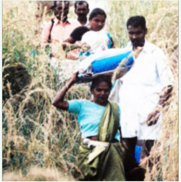
கேரளாவில் இனவெறிக்கும்பல் கட்டவிழ்த்து விட்டுள்ள தாக்குதல்களிலிருந்து தப்பித்து வரும் தமிழர்கள்.

இதற்கிடையே அணை வலுவிழந்துவிட்டது என்று காட்டும் நோக்கில் மத்திய இராணுவ அமைச்சரும் கேரளத்தைச் சேர்ந்தவருமான ஏ.கே. அந்தோணி மூலம் கடற்படைக் குழு, ரூர்கி ஐ.ஐ.டி.யிலிருந்து நில அதிர்ச்சி பாதிப்புகளை ஆய்வு செய்யும் வல்லுநர் குழு ஆகியவற்றை வைத்துத் தனக்குச் சாதகமான ஆதாரங்களைத் திரட்டி, அவற்றை வைத்து கேரள அரசு ஒரு புறம் வழக்காடியது. மறுபுறம், குறும்படங்கள், பிரச்சாரங்கள் மூலம் அணை உடைந்து பேரழிவு ஏற்படும் என பீதி திட்டமிட்டுப் பரப்பப்பட்டது. இறுதியாக, உச்ச நீதிமன்ற உயர்மட்டக் குழு அறிக்கையும் தீர்ப்பும் தனக்குச் சாதகமாக இராது என்ற அச்சம், வரவிருக்கும் பிரவம் சட்டமன்ற இடைத்தேர்தல் ஆகியவை காரணமாக இந்தப் பொய்ப்பிரச்சாரம் உச்சத்துக்குச்