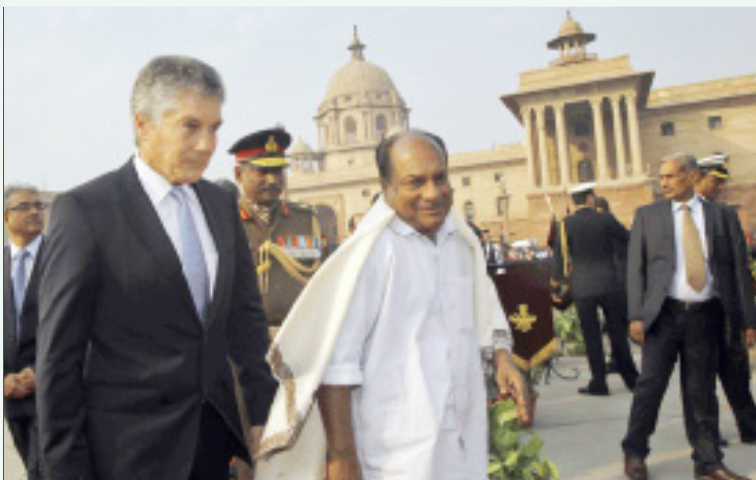
அமெரிக்காவின் போர்த்தந்திரத் திட்டப்படி இந்தியாவுக்கு வந்த ஆஸ்திரேலிய இராணுவ அமைச்சர் ஸ்டீபன் ஸ்மித்-உடன் இந்திய இராணுவ அமைச்சர் ஏ.கே. அந்தோணி.

ஏற்கெனவே மறுகட்டுமானப்பணிகள் என்ற பெயரில் ஆப்கானிலும், கடற் கொள்ளையர்களிடமிருந்து கப்பல்களைப் பாதுகாப்பது என்ற பெயரில் சோமாலியாவிலும், அமைதிப்படை என்ற பெயரில் பல ஆப்பிரிக்க நாடுகளிலும் அமெரிக்காவுக்கு விசுவாச சேவை செய்துவரும் இந்தியப் படைகள், இனி சீனாவுக்கு எதிரான பதிலிப் போர்களிலும் ஈடுபடுத்தப்படும். சீனாபாரம்பரிய உரிமை கோரும் - தற்போது வியட்நாமால் உரிமை கோரப்பட்டுள்ள தீவுப் பகுதிகளில் இருந்து எண்ணெய் தோண்டுவதில் வியட்நாமுடன் உடன்