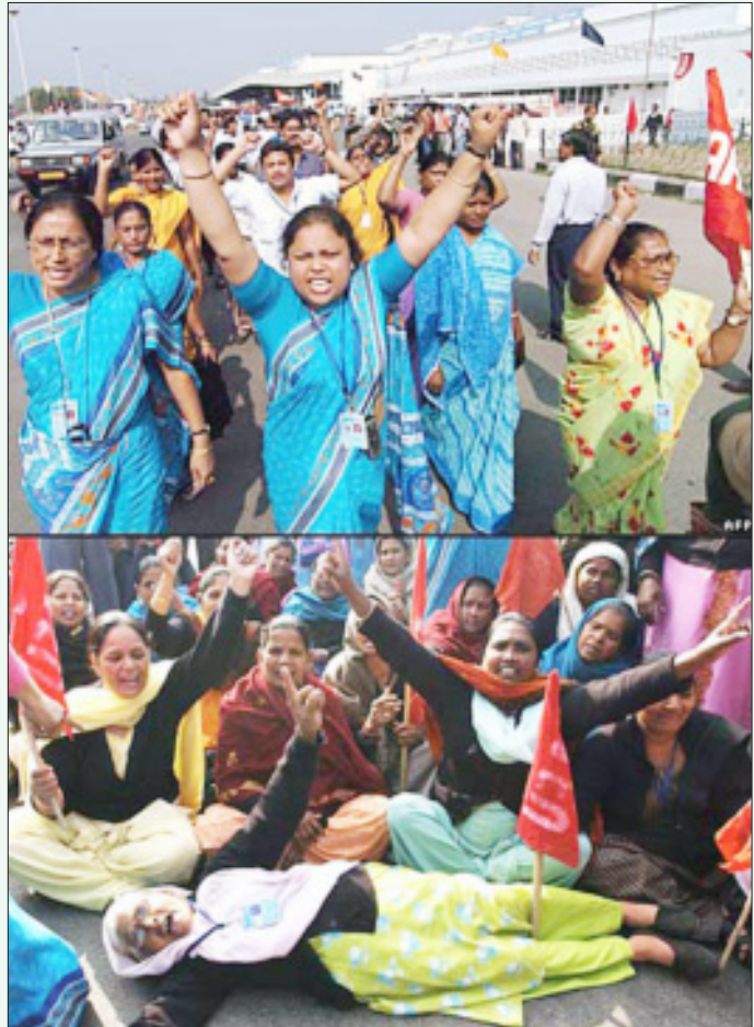
டெல்லி மற்றும் மும்பை விமான நிலையங்களைத் தனியார்மயமாக்கும் திட்டத்தை எதிர்த்து ஆர்ப்பாட்ட பேரணியும் (மேல் படம்) சாலை மறியலும் நடத்திய ஏர்-இந்தியா நிறுவன ஊழியர்கள் மற்றும் தொழிலாளர்கள்.

ஐக்கிய முற்போக்குக் கூட்டணி பதவியேற்ற பின், இந்தியாவிலிருந்து ஐரோப்பாவிற்கும் அமெரிக்கா, கனடா மற்றும் அரபு நாடுகளுக்கும் விமானச் சேவைகளை வழங்கும் உரிமங்கள் வெளிநாடுகளைச் சேர்ந்த பல தனியார் விமானப் போக்குவரத்து நிறுவனங்களுக்கு வாரி வழங்கப்பட்டன. அரபு நாடுகளைச் சேர்ந்த விமான நிறுவனங்கள் இந்த வாப்பைப் பயன்படுத்திக் கொண்டு ஏர்-இந்தியாவின் சந்தையை விழுங்கத் தொடங்கிய அதேசமயம், அரபு நாடுகள் ஏர்-இந்தியாதுபாய் வழியாக வட அமெரிக்க நாடுகளுக்குச் செல்லும் உரிமத்தை வழங்காமல் இழுத்தடித்தன. இது மட்டுமின்றி, உள்நாட்டிலும் வருமானமிக்க வழித்தடங்களும், நேரங்களும் கிங் ஃபிஷர், ஜெட் ஏர்வேஸ் ஆகிய தனியார் விமான நிறுவனங்களுக்குத் தாரைவார்க்கப்பட்டன. அதாவது, தனியார் பஸ் முதலாளிகளின் இலாபத்திற்காக அரசு போக்குவரத்துக் கழகம் மொட்டையடிக்கப்பட்டதைப் போல, ஏர்-இந்தியாவும் இந்தியன் ஏர்லைன்ஸும் மொட்டையடிக்கப்பட்டன. இதனால் இந்த நிறுவனங்களின் வருமானம் குறைந்து, அவை நடத்தலில் தள்ளப்பட்ட நேரத்தில்தான், வெளிச்