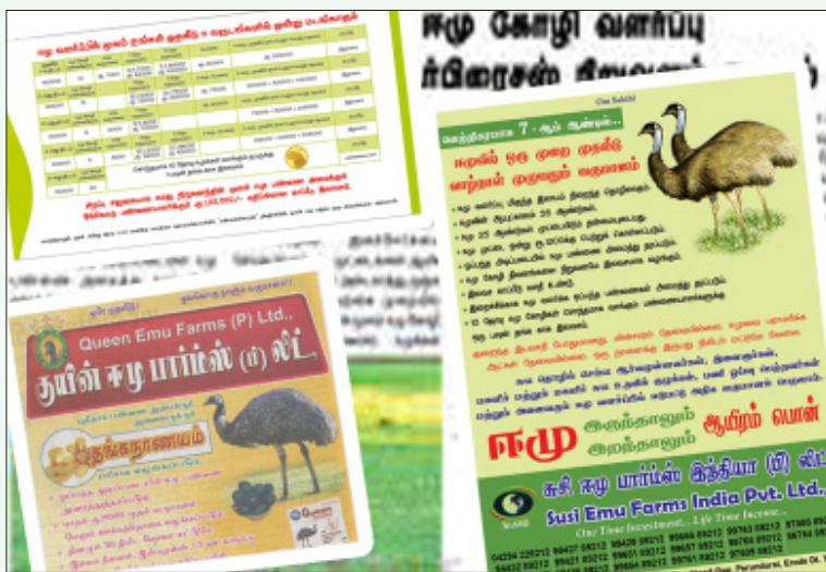
ஈமூ கோழிப்பண்ணை நிறுவனங்களின் விளம்பர வித்தை: ஈமூ கோழி வளர்ப்புத் தொழில் கொழுத்த இலாபத்துடன் விரிவடைந்து முன்னேறுவதாகக் காட்டி விவசாயிகளை ஏய்க்கும் மோசடி.

வரும் கால்நடை வளர்ப்பை ஒத்ததாக இருப்பதாலும் இத்தொழிலை விவசாயிகள் பெருத்த நம்பிக்கையுடன் பார்க்கின்றனர். தமிழகத்தில் ஈரோடு, திருச்சி, பல்லடம், புதுக்கோட்டை, வாலாஜாபாத், கொடைக்கானல் முதலான பகுதிகளில் இத்தகைய ஈமூ வளர்ப்புப் பண்ணைகள் அதிகரித்து வருகின்றன. தமிழகம் மட்டுமின்றி, புதுச்சேரி, ஆந்திரா, கோவா, மகாராஷ்டிரா, ஒரிசா, ம.பி. முதலான மாநிலங்களிலும் ஈமூ கோழிப் பண்ணைகள் விரிவடைந்து வருகின்றன.