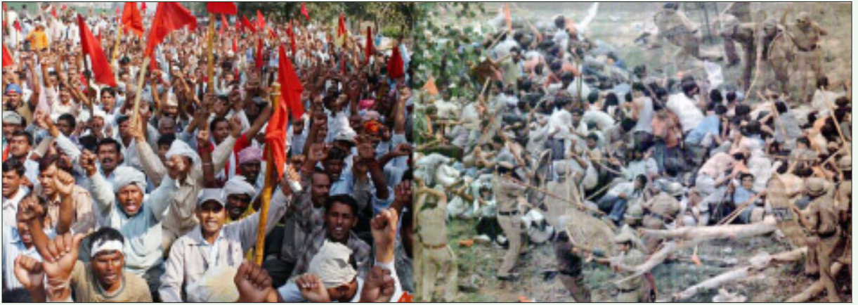
குர்கானிலுள்ள பன்னாட்டு நிறுவனமான ரிக்கோ தொழிற்சாலையில் தொழிற்சங்க உரிமைகளைக் கோரி நடந்த வேலைநிறுத்தத்தின்பொழுது அவ்வாலைத் தொழிலாளர்கள் நடத்திய மறியல் போராட்டம் (இடது); தொழிற்சங்க உரிமைகள் கோரிப் போராடிய ஹோண்டா மோட்டார் சைக்கிள் ஆலையைச் சேர்ந்த தொழிலாளர்கள் மீது நடத்தப்பட்ட காட்டுமிராண்டித்தனமான தாக்குதல். (கோப்புப் படங்கள்)

யைச்சீர்குலைப்பதாகவும் புளுகுணிப் பிரச்சாரத்தை நடத்தியது. இன்னொருபுறம் அரியானா மாநில அரசு வேலை நிறுத்தத்தை முடிவுக்குக் கொண்டுவருவது என்ற போர்வையில் போலீசு, நீதிமன்றம் மூலம் தொழிலாளர்களை மிரட்டி மாருதிக்கு ஆதரவாக நடந்து கொண்டது.