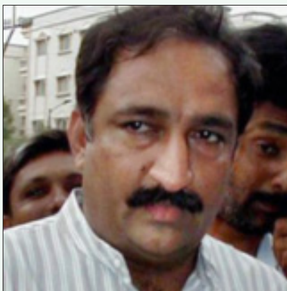
குஜராத் படுகொலை தொடர்பாக விசாரணை நடத்திய சிட்டிசன்ஸ் டிரிபியூனலின் முன் சாட்சியமளித்ததைத் தொடர்ந்து மர்மமான முறையில் கொல்லப்பட்ட குஜராத்தின் முன்னாள் வருவாய்த்துறை இணை அமைச்சர் ஹரேன் பாண்டியா.

2002 இனப்படுகொலையின் போது குஜராதில் அமைச்சராக இருந்த ஹரேன் பாண்டியாவுக்கு