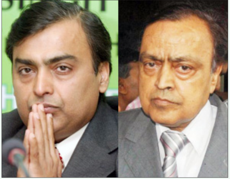
கே.ஜி. எண்ணெய் வயல் ஏலத்தில் நடந்துள்ள முறைகேடுகளால் பெரும் இலாபம் அடைந்துவரும் முகேஷ் அம்பானி (இடது) மற்றும் அவரது நிறுவனத்திற்குச் சாதகமாக நடந்துகொண்ட பெட்ரோலியத் துறையின் முன்னாள் அமைச்சர் முரளி தியோரா.

2-ஜி விவகாரத்தில் தொலைத்தொடர்புத் துறை முன்னாள் அமைச்சர் ஆ.ராசாவைக் குறிவைத்துத் தாக்கிய பத்திரிகைகள், ஏர்-இந்தியாவை நட்டத்திற்குள் தள்ளிவிட்ட