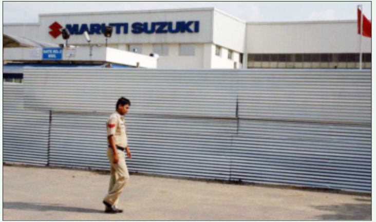
மாருதி நிர்வாகம் ஆலையைச் சுற்றிக் கோட்டைச் சுவர் போல நிறுவியிருந்த அலுமினியத் தடுப்புகள்: சட்டவிரோதக் கதவடைப்பின் சாட்சியம்.

இந்நிலையில் கடந்த 11 வருடங்களாக நடத்தாமலிருந்த, மாருதி நிர்வாகத்தின் எடுபிடி சங்கமான 'மாருதி உத்யோக தொழிலாளர் சங்கத்தின்' தேர்தலைத் திடீரென நிர்வாகம் நடத்தியது. மாணேசர் மாருதி ஆலைத் தொழிலாளர்கள் இந்தத் தேர்தலை மொத்தமாகப் புறக்கணித்தனர். வெறும் 8 ஓட்டுகள் மட்டுமே அந்தத் தேர்தலில் பதிவாகியது.