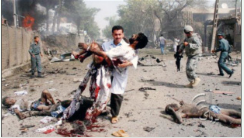
செப்டம்பர் 2008-இல் 41 பேரைப் பலிகொண்டு 140 பேரைப் படுகாயப்படுத்திய இந்தியத் தூதரகத்தின் மீதான தாலிபான் தற்கொலைப்படைத் தாக்குதலின் கோரம்: இந்தியாவின் அமெரிக்கக் கைக்கூலித்தனத்துக்குத் தரப்படும் விலை.

பெகிஸ்தானின் இஸ்லாமிய தீவிரவாத அமைப்பைத் தாக்கி அழிக்கும் நோக்கத்துடன் உருவாக்கப்பட்ட ஆப்கானின் அண்டை நாடான தாஜிகிஸ்தானிலுள்ள போர்விமானத் தளத்தையும் இந்தியா பயன்படுத்தும். ஆப்கான்மட்டுமின்றி, அதன் அண்டை நாடுகளிலும் தீவிரவாதத்தை வேரறுக்க இந்தியா பாடுபடும். இவற்றின் மூலம் இந்தியா தெற்காசியாவில் மட்டுமின்றி, மேற்காசியாவிலும் செல்வாக்கு செலுத்த வாய்ப்பு கிடைத்துள்ளது” என்று இராணுவ ஆலோசகர்கள் இந்த ஒப்பந்தம் குறித்துக் கருத்து தெரிவிக்கின்றனர்.