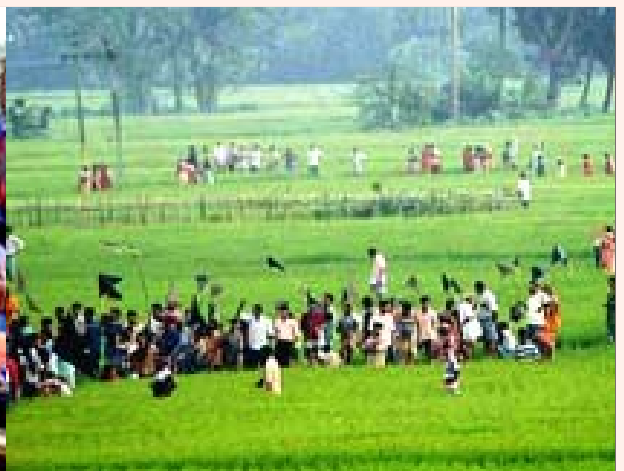
ஓரிசா-கலிங்கா நகரில் டாடா எஃகு நிறுவனத்தை எதிர்த்துப் போராடியதற்காக போலீசாரால் சுட்டுக் கொல்லப்பட்ட பழங்குடியினரின் சடலங்கள் (இடது); மே.வங்கம் சிங்கூரில் டாடாவின் நானோ கார் ஆலை அமையவிருந்ததை எதிர்த்துப் போராடும் விவசாயிகள். (கோப்புப் படங்கள்)

டாடாக்களின் வன்முறைகளும் படுகொலைகளும்: குவா படுகொலைகள்