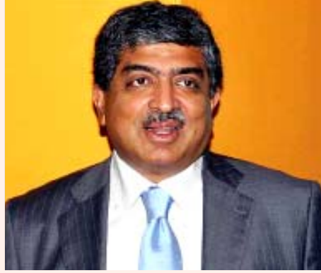
இந்தியத் தேசிய அடையாள அட்டை ஆணையத்தின் தலைவர் நந்தன் நிலகேணி.

விவசாயத்தின் சீரழிவால், பெரும் எண்ணிக்கையிலான விவசாயிகள் நாடு முழுவதும் அத்துக் கூலிகளாக அலைகிறார்கள். தன் மீது அதிருப்தியில் இருக்கும் இவர்களை அரசு எப்போதும் கண்காணிக்கவே விரும்புகிறது. மேலும், அரசின் மறுகாலனியாக்க நடவடிக்கைகளினால், பெரும் பான்மை உழைக்கும் மக்கள் வெறுப்படைந்து வரும் சூழலில், நாடு தழுவிய உளவுத்தகவல் ஒருங்கிணைப்பும், கண்காணிப்பும் தேவைப்படுகிறது. இதனை நிறைவு செய்யும் நோக்கத்துடனேயே இத்திட்டம் கொண்டுவரப்பட்டுள்ளது.