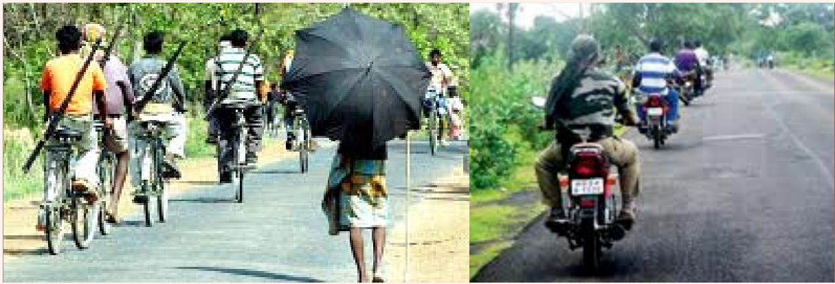
பாசிச குண்டர் படைகள்: சட்டில்கருக்கு சல்வாஜும்; மே.வங்கத்துக்கு ஹர்மத்வாகினி.

படைகள் மாவோயிஸ்டு மற்றும் திரிணாமுல் காங்கிரசு கட்சி ஆதரவாளர்களைத் தாக்குவது, வீடுகளைச் சூறையாடுவதுடன் ஆள்காட்டி வேலையையும் செய்து வருகின்றன. மேலும், இப்பகுதியில் மாவோயிஸ்டுகளின் நடமாட்டத்தைப் பற்றிக் கூட்டுப் படைகளுக்குத் தகவல் தெரிவிக்கும் உளவுப் படையாகவும் செயல்பட்டு வருகின்றன என்பதை அம்மாநிலத்தின் உள்ளூர் நாளேடுகளே அம்பலப்படுத்தியுள்ளன.