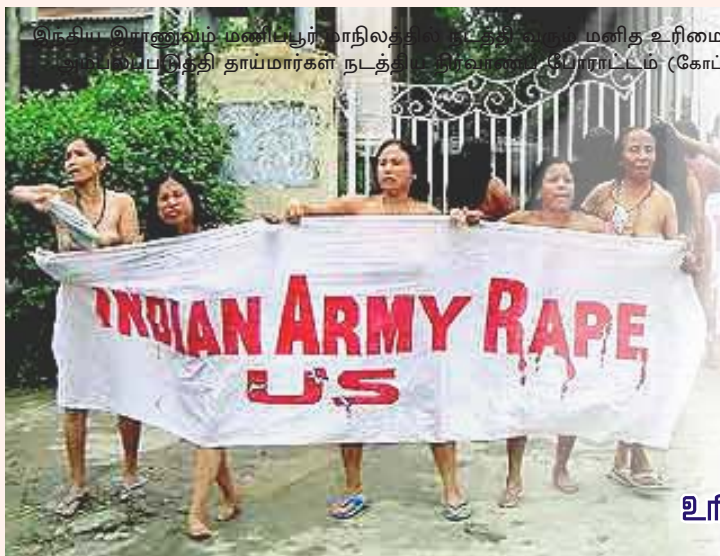
இந்திய இராணுவம் மணிப்பூர் மாநிலத்தை நடத்தி வரும் மனித உரிமை மீறல்களை அம்பலப்படுத்தி தாய்மார்கள் நடத்திய நிர்வாணப் போராட்டம் (கோப்புப் படம்)

ஐந்து அல்லது அதற்கு மேற்பட்ட நபர்கள் பொது இடங்களில் கூடுவதை இராணுவமே தடை செய்யலாம். ஒரு பொருளை ஆயுதமாகப் பயன்படுத்தக்கூடிய வாய்ப்பிருப்பதாக இராணுவம் கருதினால், அதனை எடுத்துச் செல்வதற்குத் தடை விதிக்கலாம்.