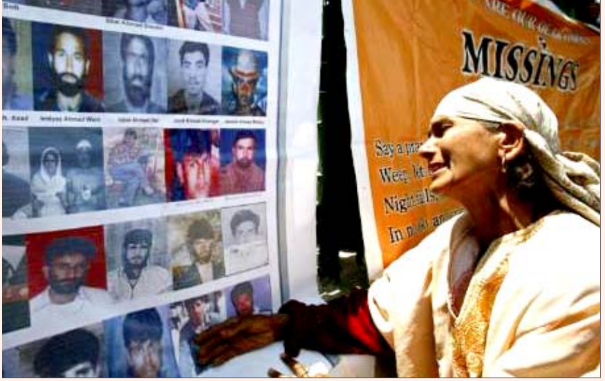
அரசுப் படைகளால் இழுத்துச் செல்லப்பட்டு, அதன்பின் “காணாமல் போனவர்களின்” புகைப்படங்களைக் கண்டு கதறியமும் காஷ்மீர்த்துத் தாய்.

இப்பொழுது பாதுகாப்பிற்கான அமைச்சர்கள் குழுவைக் கூட்டி, இச்சட்டத்தைத் திருத்துவது தொடர்பாக காங்கிரசுக்குள்ளேயே இரு வேறு கருத்துகள் நிலவுவதாகக் காட்டிக் கொண்ட அக்கட்சி, பின்னர் ஜம்மு காஷ்மீரைச் சேர்ந்த மூன்று மாவட்டங்களில் இருந்து இச்சட்டத்தை விலக்கிக் கொள்ள ஆலோசிப்பதாக பாவ்லா காட்டியது. அதன் பின்னர், நகரங்களில் இருக்கும் தேவையற்ற பதுங்கு குழிகளைக் கைவிடுவது என இந்த நாடகம் சுருங்கிப் போனது. காஷ்மீர் பிரச்சினையைத் தீர்ப்பதற்காக எட்டு அம்ச சலுகைத் திட்டத்தை அறிவித்த கையோடு காஷ்மீர் மக்களின் இக்கோரிக்கையை