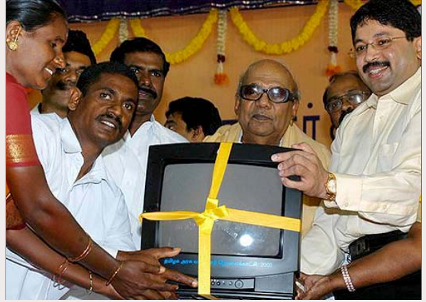
இலவச வண்ணத் தொலைக்காட்சிப் பெட்டி வழங்கும் விழாவில் தமிழக முதல்வர் மு.கருணாநிதி மற்றும் அவரது பேரணும் மத்திய அமைச்சருமான தயாநிதி மாறன்.

இப்போது தேர்தல் கூட்டணிகளை அமைப்பது என்பது ஒவ்வொரு கட்சிக்கும் உள்ள வாக்கு வங்கியின் ஆதரவு சதவீதம், அதன் மீதான கூட்டல் - கழித்தல் என்ற எண்ணிக்கைக் கணக்காகிவிட்டது. அரசியல் என்பது ஆளும் கட்சிகளின் இலஞ்ச ஊழல், அதிகார முறைகேடுகளை அம்பலப்படுத்துவதும் குற்றஞ்