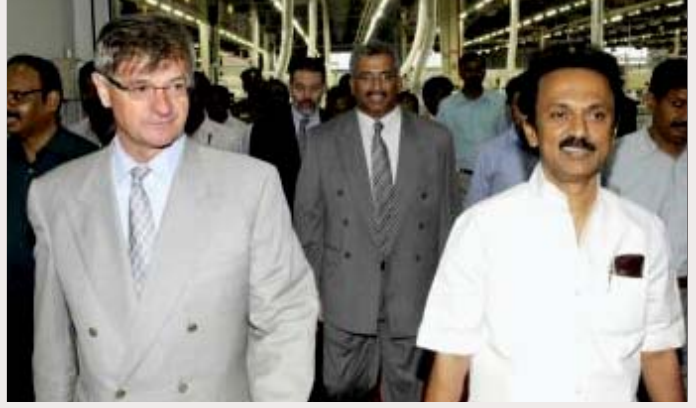
ஓரகடம் உயர் தொழில்நுட்ப சிறப்புப் பொருளாதார மண்டலத்தில் அமைந்துள்ள அமெரிக்காவைச் சேர்ந்த சான்மினா-எஸ்.எச்.ஐ என்ற மின்னணுப் பொருள்களைத் தயாரிக்கும் தொழிற்சாலையைத் திறந்து வைக்கும் தமிழகத் துணை முதல்வர் மு.க.ஸ்டாலின்.

மகாராட்டிரத்துக்கு அடுத்தபடி இரண்டாவது இடத்தை தமிழகம் பிடித்திருப்பதாகவும், தொழில்துறை வேலைவாய்ப்பின் எண்ணிக்கையில் இந்தியாவிலேயே தமிழகம் முதலிடத்தை எட்டியிருப்பதாகவும், சிறப்புச் சலுகைகள் மூலம் கடந்த 3 ஆண்டுகளில் மட்டும் தமிழகம் ஈர்த்திருக்கும் அந்நிய முதலீடு ரூ.60,000 கோடி என்றும், ஆக்ஸ்போர்டு அனலடிக்காவின் ஆய்வின்படி அந்நிய முதலீட்டாளர்களைப் பெரிதும் கவர்ந்திழுக்கும் மாநிலம் இந்தியாவிலேயே தமிழகம்தான் என்றும், பெருமை பொங்கப் பேசியிருக்கிறார் துணை முதல்வர் மு.க.ஸ்டாலின் (எகனாமிக் டைம்ஸ், மார்ச், 10, 2010). இந்தியத் தரகுமுதலாளிகள் சங்கமான எஃப்.ஐ.சி.சி.ஐ. வெளியிட்டிருக்கும் 'சாதகமான தமிழகம்' (Advantage Tamilnadu) என்ற -லை வெளியிட்டு தளபதி ஆற்றிய உரை இது என்பது குறிப்பிடத்தக்கது.