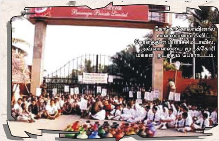
கோகோகோலாவினால் யாவைவன்மாகிவிட்ட கோளத்தின் பிளாச்சிமடாவில், அவ்வாலையை மூடக்கோரி மக்கள் நடத்தும் போராட்டம்.