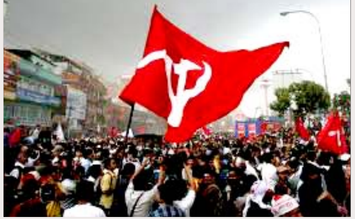
அமைதி ஒப்பந்தத்தைச் சீர்குலைக்கும் அரசியல் கட்சிகளையும் இந்திய மேலாதிக்கத் தலையீட்டையும் எதிர்த்து மாவோயிஸ்டுகள் தலைநகர் காத்தமண்டுவில் நடத்திய போராட்டம்.

மன்னராட்சிக்கு எதிரான எழுச்சி உச்சநிலையை அடைந்த போது, மன்னராட்சி இனியும் நீடிக்க முடியாமல் முட்டுச் சந்துக்கு வந்தபோது, மாவோயிஸ்டுகளு