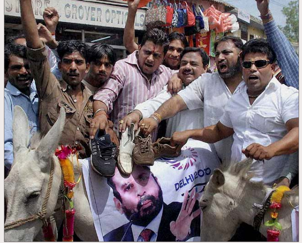
காமன்வெல்த் ஊழல்-மோசடியை அம்பலப்படுத்தி நடந்த -தன போராட்டம்.

2003-இல் திட்டமிடப்பட்ட போது, இப்போட்டியை நடத்த மொத்தத்தில் ரூ.1,899 கோடி செலவாகும் என்று மதிப்பிடப்பட்டது. ஆனால், எல்லா அதிகாரிகளும் முதலாளிகளும் போட்டி போட்டுக் கொண்டு பணத்தைச் சுருட்டியதால் தற்போது செலவு மதிப்பீடு 35,000 கோடி