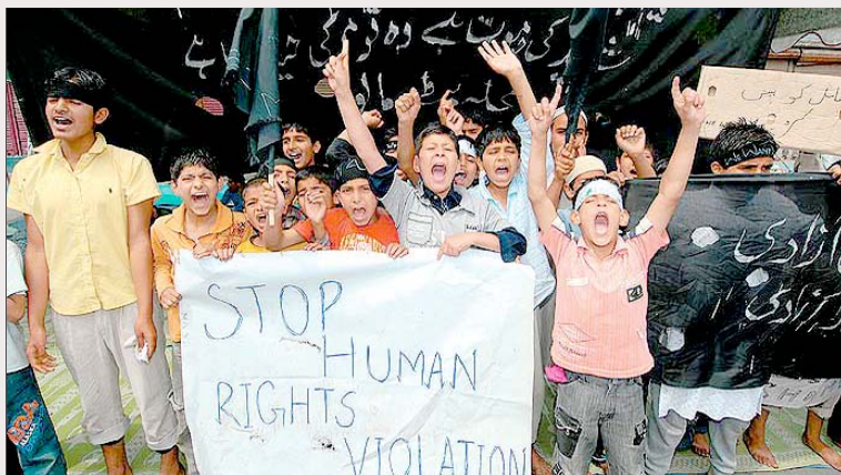
இந்திய இராணுவம் காஷ்மீரில் நடத்திவரும் போலி மோதல் கொலைகளையும்; கொட்டடிச் சித்திரவதைகளையும் கண்டித்துச் சிறுவர்கள் நடத்தும் ஆர்ப்பாட்டம்.

1990-ஆம் ஆண்டு தொடங்கி 2007-ஆம் ஆண்டு முடியவுள்ள 17 ஆண்டுகளில் இந்திய இராணுவமும் துணை இராணுவப் படைகளும் அம்மாநில போலீசும் நடத்திய துப்பாக்கி சூடுகள், போலி மோதல்கள், இரகசியக் கொலைகள், கொட்டடிச் சித்திரவதைகளில் ஏறத்தாழ 70,000-க்கும் மேற்பட்ட காஷ்மீரிகள் கொல்லப்பட்டுள்ளனர். அரசுப் படைகளால் விசாரணைக்கு அழைத்துச் செல்லப்பட்ட 8,000 காஷ்மீரிகள் சுவடே தெரியாமல் 'காணாமல்' போய்விட்டனர். அப்படைகள் நடத்தியிருக்கும் பாலியல் வல்லுறவுகள் இந்தக் கணக்கில் அடங்காது.