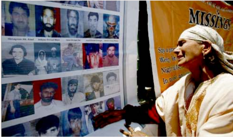
விசாரணைக்கு அழைத்துச் செல்லப்பட்டு 'காணாமல் போனவர்களின்' புகைப்படங்களைப் பார்த்து விம்மியமும் காஷ்மீரத்துத் தாய்.

டில் 9 வயது சிறுவன் கொல்லப்பட்டான். “அவன் அப்பாவி கிடையாது; கூலிக்காக வேலை செய்யும் போக்கிரி” என அச்சிறுவனைப் பற்றிக் கூறியிருக்கிறார், உள் துறை அமைச்சுச் செயலர். இப்படி வக்கிரமும், காலனியாதிக்க ஆணவமும் நிறைந்த இந்திய அரசை வெளியேறக் கோருவது எந்த விதத்தில் தவறாகிவிடும்?