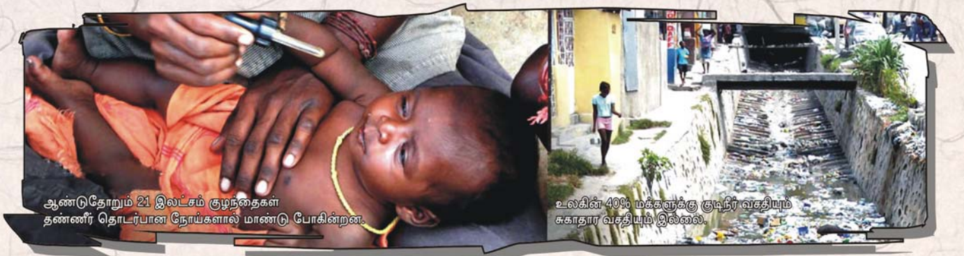
ஆண்டுதோறும் 21 இலட்சம் குழந்தைகள் தண்ணீர் தொடர்பான நோய்களால் மாண்டு போகின்றன.