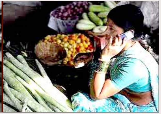
கட்டணம் குறைக்கப்பட்டதால், செல்போன்களைப் பயன்படுத்தும் ஏழைகளான உதிரித் தொழிலாளர்கள்.

பட்ட மாதத் தவணை முறை, ஏழை மக்களின் வருமானத்துக்கு ஏற்புடையதாக இருந்தது. ப்ரீபெய்ட் திட்டத்தில் வாழ்நாள்வரைத் திட்டமும் (லைப்டைம்), ஒரே குழுமத்துக்குள் பேசினால் இலவசம் எனும் திட்டமுமே செல்போனை அனைவர் கைகளிலும் கொண்டு வந்தது. வோடஃபோன் அறிக்கையே, குறைந்தபட்சம் இணைப்பைத் தொடர இம்மக்கள் ரூ.10 செலுத்தினால் போதும் என்று சொல்லியிருக்கிறது.