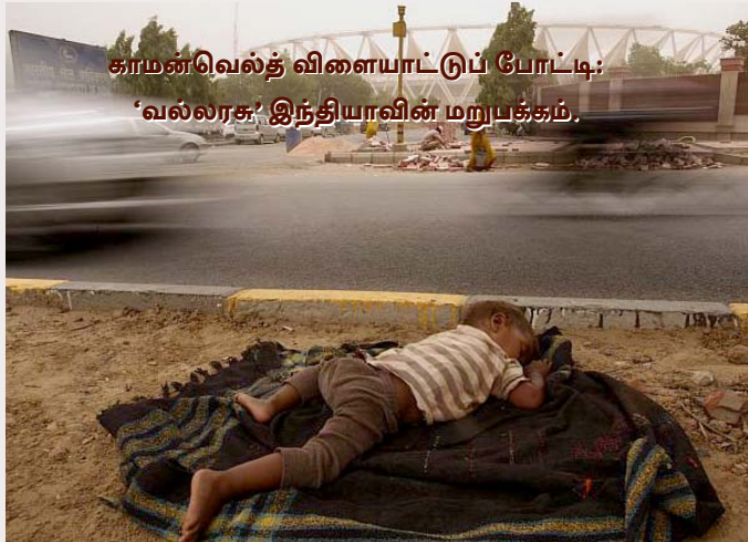
காமன்வெல்த் விளையாட்டுப் போட்டி: 'வல்லரசு' இந்தியாவின் மறுபக்கம்.

காமன்வெல்த் போட்டிக்காக டெல்லியின் உள்கட்டுமானத்தை மேம்படுத்தும் கட்டுமானப் பணிகளை ஓப்பந்தமெடுத்து ஊழல் செய்தவர்கள், இன்னொரு பக்கம் பீகார், ஜார்க்கண்ட் போன்ற மாநிலங்களில் இருந்து 10 இலட்சத்திற்கும் மேற்பட்ட தொழிலாளர்களை அற்பகூலிக்கு வரவழைத்து, கொத்தடிமைகளாகக் கசக்கி