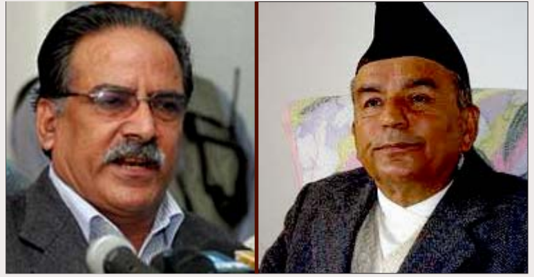
பிரதமர் பதவிக்கான தேர்தலில் போட்டியிட்டு பெரும்பான்மை கிடைக்காமல் தோல்வியடைந்த மாவோயிஸ்டு கட்சியின் தலைவர் தோழர் பிரசந்தா மற்றும் நேபாள காங்கிரசு கட்சியின் துணைத்தலைவர் பெளதேல்.

ஆனால், அமைதி ஒப்பந்தத்திற்கு எதிராகவும், புதிய இடைக்கால அரசின் ஒப்புதலோ, உத்தரவோ இல்லாமலும் மன்னராட்சியின் கீழிருந்த நேபாள இராணுவத்தின் தளபதியான ருக்மாங்கத் கடுவால், இந்தியாவின் ஆசியுடன் நேபாள இராணுவத்தில் 2800 பேரை தன்னிச்சையாகச் சேர்த்தார். பல இராணுவ அதிகாரிகளுக்குப் பதவி நீட்டிப்பு செய்தார். இது சட்டவிரோதமானது என்று மாவோயிஸ்டுகளின் அரசாங்கம் பிறப்பித்த உத்தரவை அவர் உதாசீனம் செய்தார். மக்களால் தேர்ந்தெடுக்கப்பட்ட அரசாங்கத்துக்குக் கட்டுப்பட மறுத்து, சட்டவிரோதமாகச் செயல்படும் இத்தலைமைத் தளபதியைப் பதவி நீக்கம் செய்ய மாவோயிஸ்டுகளின் அரசாங்கத்தின் பிரதமரான பிரசந்தா உத்தரவிட்டார். இருப்பினும், போலி கம்யூனிஸ்ட் கட்சி