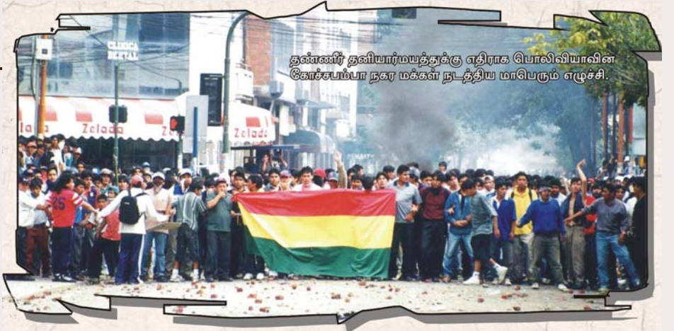
தண்ணீர் தனியார்மயத்துக்கு எதிராக யொலிவியாவின் கோச்சப்பா நகர மக்கள் நடத்திய மாபெரும் எழுச்சி.

இந்தியாவில் 1985-இல் குடிநீர் இல்லாமல் பாதிக்கப்பட்டுள்ள கிராமங்களின் எண்ணிக்கை 750. இது 1995-இல் 65,000 கிராமங்களாக அதிகரித்து விட்டதாக அரசாங்கமே ஒப்புக் கொள்கிறது. இந்தியாவில் பாதிக்கும் மேற்பட்ட நதிகள் மற்றும் ஏரிகளின் நீர் மாசுபட்டுள்ளது. அந்