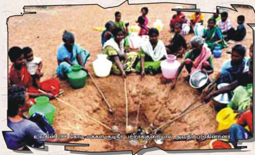
உலகின் 200 கோடி மக்கள் குடிநீர் பற்றாக்குறையால் அவதிப்படுகின்றனர்.

இத்தீர்மானத்தை நிறைவேற்றக் கூடாது என்றும், தீர்மானத்தில் திருத்தங்கள் செய்யப்பட வேண்டும் என்று கூறி அதை நீர்த்துப்போக வைக்கவும் ஏகாதிபத்திய நாடுகளும் தண்ணீர் ஏகபோக நிறுவனங்களும் கடும் முயற்சி செய்தன. ஏனெனில், இன்று உலகின் வேகமாக வளர்ந்து வரக்கூடிய, கொள்ளை இலாபம் தரக்கூடிய தொழிலாக தண்ணீர் வியாபாரம் முன்னணிக்கு வந்துள்ளது. இதனாலேயே தண்ணீரை ‘‘நீலத் தங்கம்’’ என்று பன்னாட்டு ஏகபோகக் கம்பெனிகள் அழைக்கின்றன. கடந்த ஆண்டில், எண்ணெய்க் கம்பெனிகளின் இலாபத்தில் ஏறத்தாழ 40 சதவீதத்தை தண்ணீர் கம்பெனிகள் அடைந்துள்ளன. இந்தக் கம்பெனிகள், உலகின் தண்ணீர் ஆதாரங்களில் 5% அளவுக்கு சொந்தம் கொண்டாடுகின்றன. இதிலேயே இவ்வளவு இலாபம் என்றால், இதர நீர் ஆதாரங்களையும் அவைக் கைப்பற்றிக் கொண்டால் அவற்றின் இலாபம் எவ்வளவு மடங்கு அதிகரிக்கும் என்று சொல்லத் தேவையில்லை.