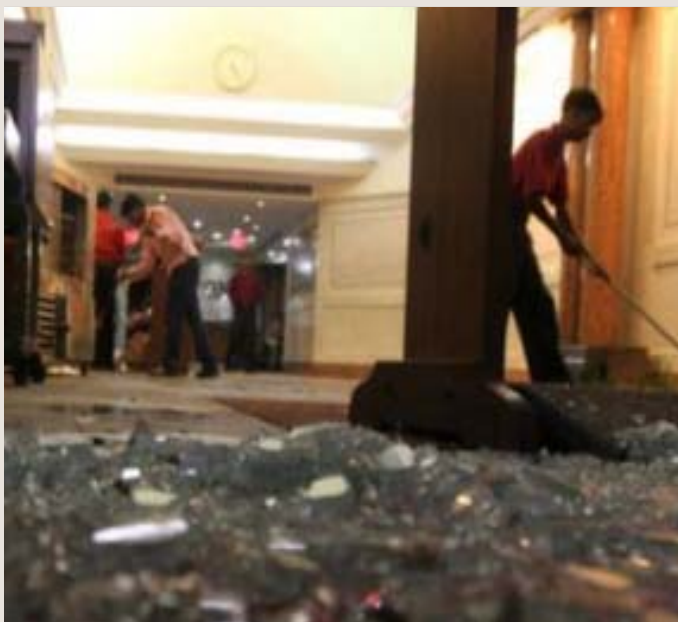
ஆர்.எஸ்.எஸ்.-இன் பயங்கரவாத நடவடிக்கைகளை அம்பலப்படுத்தியதால், இந்து மதவெறிக் குண்டர்களால் அடித்து நொறுக்கப்பட்ட “ஹெட்லைன்ஸ் டுடே” யின் அலுவலகம்.

எனினும் கடந்த பத்தாண்டுகளாக ஆர்.எஸ்.எஸ். இன் ஆசீர்வாதத்தோடு நடந்துள்ள இக்குண்டு