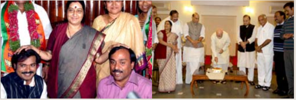
பா.ஜ.க.வின் உயர்மட்டத் தலைவர்களோடு ரெட்டி சகோதரர்களுக்கு இருக்கும் நெருக்கத்தைக் காட்டும் புகைப்படங்கள்: ஷமா வராஜ் (வலது படம்) மற்றும் அத்வானியோடு ஜனார்த்தன ரெட்டி (வட்டத்துக்குள்).

ஆனால், “தனது கட்சிக்காரர்களுக்கு எதிராக காங்கிரசின் சதி” என்ற தயார்நிலை பதிவை பா.ஜ.க. எல்லா வற்றுக்கும் தீர்வாக வைத்துக் கொண்டிருக்கிறது. ஆர்.எஸ்.எஸ். பயங்கரவாதிகளின் வெடிகுண்டுத் தாக்குதல், குஜராத்தில் நரேந்திர மோடி தலைமையிலான இசுலாமியர் படுகொலைகள் ஆகியவற்றிலிருந்து குற்றவாளிகளைத் தப்புவிப்பதில் அக்கட்சி எவ்வளவு அக்கறை கொண்டுள்ளதோ, அதேபோல பெல்லாரி ரெட்டி சகோதரர்கள் விவகாரத்திலும் கடமைப்பட்டுள்ளது. ரெட்டி சகோதரர்களின் பண்பலத்தைக் கொண்டு நடத்தப்பட்ட “தாமரை நடவடிக்கை”யால் தான் பா.ஜ.க. கர்நாடகாவில் ஆட்சிக்கு வந்தது. அக்கட்சி ஆட்சியில் நீடிப்பதும் வீழ்வதும் ரெட்டி சகோதரர்களின் கை அசைவில் இருக்கிறது.