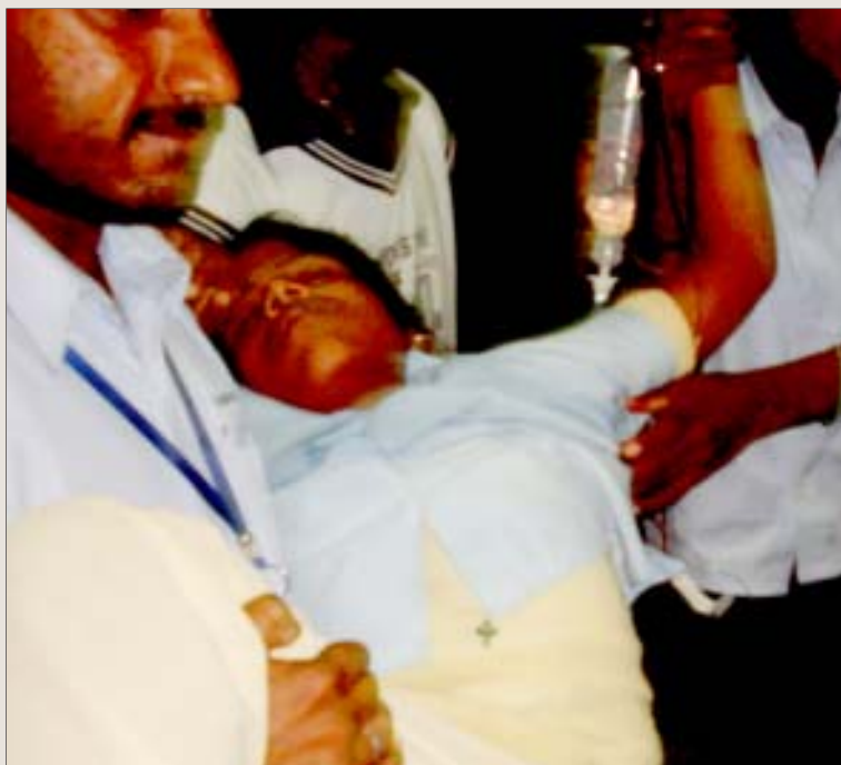
விஷவாயுக் கசிவால் மயங்கி விழுந்த பெண் தொழிலாளி மருத்துவமனைக்குத் தூக்கிச் செல்லப்படுகிறார்.

260-க்கும் மேற்பட்ட தொழிலாளர்கள் இராமச்சந்திரா மருத்துவமனைக்கு ஆம்புலன்சில் கொண்டு வரப்பட்ட வண்ணமிருந்தனர். அபாய நிலையில் இருந்தவர்கள் ஐ.சி.யு-வுக்குக் கொண்டு செல்லப்பட்டனர். மற்றவர்களுக்கு ஏதோ சிகிச்சை செய்துவிட்டு, அவசரம் அவசரமாக ‘டிஸ் சார்ஜ்’ செய்து அனுப்பியது மருத்துவமனை. ‘டிஸ் சார்ஜ்’ செய்யப்படும் தொழிலாளர்கள் தங்களது மருத்துவ அறிக்கையை வெளியே கொண்டுசெல்ல விடாமல் தடுப்பதில் நிர்வாகம் குறியாக இருந்தது.