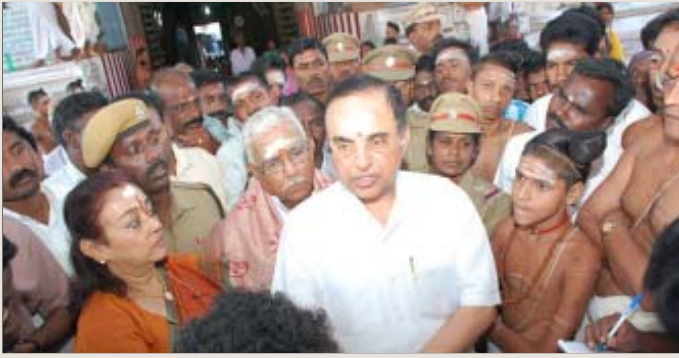
பார்ப்பன ஜெயாவின ஆசியோடு உச்சநீதி மன்றத்தில் தமிழக அரசின் ஆணையை எதிர்க்கும் ப்ரமணிய வாமிக்கு தீட்சிதர்கள் செலுத்தும் மரியாதை. (கோப்புப் படம்)

தி.மு.க. அரசின் வலது கையைப் பிடித்து இழுத்து, கட்டை விரலில் மை தடவி, உத்தரவில் கைநாட்டுப் போட வைத்தது மனித உரிமைப் பாதுகாப்பு மையம். மக்கள் மன்றத்தில் அதற்கான அரசியல் நிர்ப்பந்தத்தை உருவாக்கியவை ம.க.இ.க வும் அதன் தோழமை அமைப்புகளும். இதுதான் உண்மை. 'கட்டைவிரல் கழக அரசுக்குச் சொந்தம்' என்கிறார் கலைஞர். அந்த உண்மையை நாம் மறுக்க முடியுமா என்ன? எனினும், இத்தனை ஆண்டுகளில் தி.மு.க. அரசு தீட்சிதர்களுக்கு எதிராகத் தனது சுண்டுவிரலைக்கூட உயர்த்தியதில்லை என்பதற்கான ஆதாரங்களை நாம் அடுக்கமுடியும்.