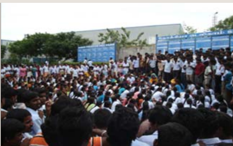
“நச் வாயு கசிவிற்கான காரணம் தெரியாமல் வேலைக்கு வரமாட்டோம்” எனக்கோரி ஆலையின் முன் போராடும் ஃபாக்ஸ்கான் தொழிலாளர்கள்.