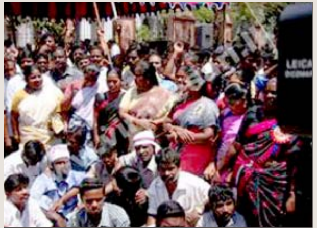
இந்திய மேலாதிக்கத் தலையீட்டை வலியுறுத்தும் தமிழக எதிர்க்கட்சிகளின் மீனவர் படுகொலைக்கு எதிரான ஆர்ப்பாட்டம்.

இதைத் தொடர்ந்து சென்னைக்கு வந்து இக்குழுவினர் கருணாநிதியையும் சந்தித்தனர். ஆனால், கருணாநிதி அவர்களிடம் கறார் குரலெழுப்பினாராம். கோபால புரத்தில் வெளிப்பட்ட வார்த்தைகள் இந்திய மேலாதிக்க நலன்களுக்கேற்ப கடுமையாகவும் உறுதியாகவும் வந்து