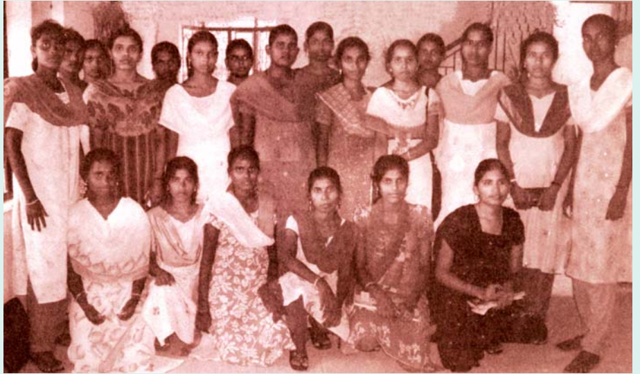
+2 தேர்வில் நல்ல மதிப்பெண்கள் பெற்றும், தனியார் கல்லூரிகள் கேட்கும் கட்டணத்தைக் கட்ட முடியாமல் பரிதவித்து நிற்கும் ஏழை மாணவிகள். (கோப்புப் படம்; நன்றி: ஜூனியர் விடான்)

பள்ளிகளைத் திறக்க வேண்டிய பருவம் நெருங்கிவிட்ட இவ்வேளையில், ஒருபுறம் கட்டணத்தை மறு நிர்ணயம் செய்வது தொடர்பாக அரசு பேரம் நடத்திக் கொண்டிருக்க, இன்னொருபுறமோ, மெட்ரிக் பள்ளிகள் பழையபடியே மாணவர்களைச் சேர்ப்பதற்குக் கட்டணக் கொள்ளையை நடத்திக் கொண்டிருப்பதாக முதலாளித்துவப் பத்திரிகைகளே அம்பலப்படுத்தி எழுதி