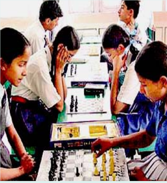
சென்னையிலுள்ள டி.ஏ.வி. பள்ளியில் மாணவர்களுக்கு நடத்தப்படும் சதுரங்கப் பயிற்சி: மாணவர்களின் பல்திறனை வளர்ப்பது என்ற பெயரில் நடந்துவரும் கொள்ளை. (கோப்பு படம்)

அரசுப் பள்ளிகள் தரத்தில் மின்னுகின்றன என்பதல்ல நமது வாதம். ஆனால், அரசுப் பள்ளிகளுக்கு மாற்றாகக் கல்வியில் தனியார்மயம் புகுத்தப்படுவதும், அதை ஆராதிப்பதும் அபாயகரமானது என்பதைத் தான் நாம் குறிப்பிட விரும்புகிறோம்.