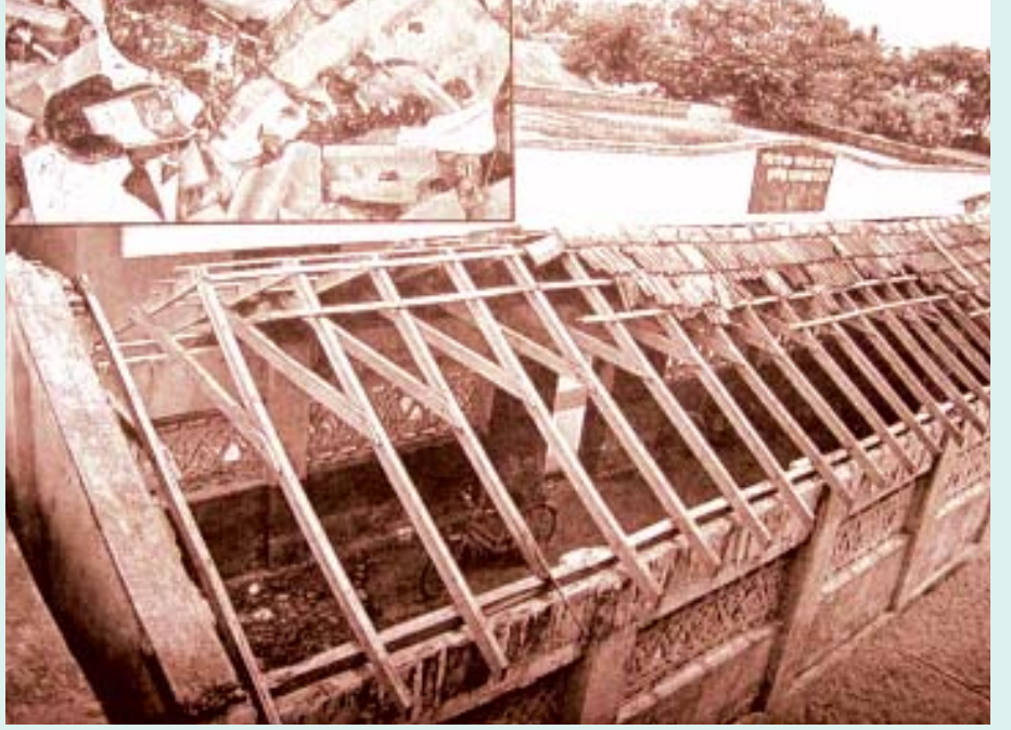
காஞ்சிபுரம் மாவட்டம் மேல்ஓட்டிவாக்கத்திலுள்ள ஆதிதிராவிட மற்றும் பழங்குடி இன நல நடுநிலைப்பள்ளியின் அவலத் தோற்றம்: கல்வியைக் கைகழுவும் அரசின் அயோக்கியத்த

களையோ கலந்து ஆலோசித்து இக்கட்டணத்தை நிர்ணயிக்கவில்லை. மாறாக, தமிழகத்திலுள்ள அனைத்து மெட்ரிக் பள்ளி முதலாளிகளிடம், அவர்களது வரவு-செலவு கணக்கையும், தரமான கல்வியைக் கொடுக்க ஒவ்வொரு பள்ளியும் என்னென்ன வசதிகளைச் செய்து கொடுத்திருக்கிறது என்ற விவரத்தையும் கேட்டு, அவற்றின் அடிப்படையில் தான் ஒவ்வொரு பள்ளிக்கும் ஏற்றவாறு, மேலே குறிப்பிடப்பட்டுள்ள வரம்புக்குள் கட்டணத்தை நிர்ணயித்திருக்கிறது