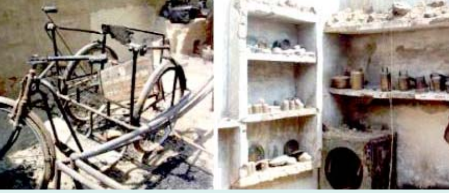
ஜாட் சாதிவெறி பயங்கரவாதம்: உயிருடன் எரிக்கப்பட்ட தாழ்த்தப்பட்ட - உடல் ஊனமுற்ற பெண்ணின் வீட்டில் நாசமாகிக் கிடக்கும் சைக்கிள் மற்றும் உடைமைகள்.