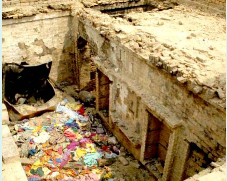
மிர்ச்பூர் கிராமத்தில் ஜாட் சாதிவெறியர்களால் கொளுத்தப்பட்ட தாழ்த்தப்பட்ட வால்மீகி சாதியினரின் வீடுகள்.

ஜாட்டுகளின் சாதிவெறி தாக்குதல்கள் இந்தப் பகுதிக்குப் புதிதல்ல. கடந்த வருடம் இதே பகுதியில், ஜாட் சாதி வெறியர்கள் தாழ்த்தப்பட்ட சாதியைச் சேர்ந்த இரண்டு பெண்களை நிர்வாணப்படுத்தி ஊர்வலமாக இழுத்துச் சென்றுள்ளனர். 1997-இல் தாழ்த்தப்பட்ட விவசாயக் கூலிகள், கூலி உயர்வு கேட்டுப் போராடிய பொழுது சமூகப் புறக்கணிப்பு செய்து, வீடுகளைத் தாக்கி எரித்துள்ளனர். 2005-இல் சோனாபட் மாவட்டம்