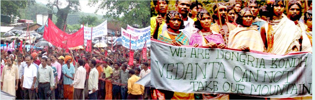
வேதாந்தா நிறுவனத்தின் நிலப்பறிப்பை எதிர்த்து ராஞ்சி நகரில் பழங்குடியினர் நடத்தும் ஆர்ப்பாட்டம். (இடது-கோப்புப் படம்) “நாங்கள் டோங்கிரியா கோந்த் இனப் பழங்குடியினர். எங்களிடமிருந்து நியம்கிரி மலையை வேதாந்தா நிறுவனம் அபகரிக்க முடியாது” - ஆகிரியரிப்புக்கு எதிராக ஆர்த்தெழுந்த கோந்த் பழங்குடியின மக்கள். (கோப்புப் படம்).

★ நான் இதுவரை கண்ட நிறுவனங்களிலேயே வேதாந்தா மிக மோசமானது; ஆனால் மிகவும் அதிர்ச்சியூட்டக் கூடியது என்னவென்றால், இது இருபத்தோராம் -ந்நாண்டில் நடக்கிறது. ஒப்பற்ற மக்கள் தொடர்பு பிரச்சாரத்தின் மூலம் உலகுக்கே தவறான புரிதலை உருவாக்குகிறது. பல்கலைக்கழகங்கள் கட்டுவது போன்ற நல்லவற்றை மக்களுக்காக அது செய்யப் போகிறது என்று மக்களை நம்ப வைக்கிறது; ஆனால், எல்லாம் பொய். அவர்கள் என்ன செய்கிறார்கள் என்பதற்கு இங்கு ஒரே ஒரு எடுத்துக்காட்டு மட்டும் தருகிறேன். அதன் அலுமினிய கச்சாப் பொருள் சுத்திகரிப்பு ஆலைக்கு மிக அருகில் உள்ள போந்தேகுடா என்றொரு இடத்தில் ஒரே ஒரு கிராமத்தை மட்டும் காலி செய்து ஒரு ஆலையை அமைத்து, ஒவ்வொருவருக்கும் வேலை தருவதாக கிராமத்தாருக்குக் கம்பெனி சொன்னது. ஏற்கெனவே நான்கு கிராமங்களைக் காலி செய்து