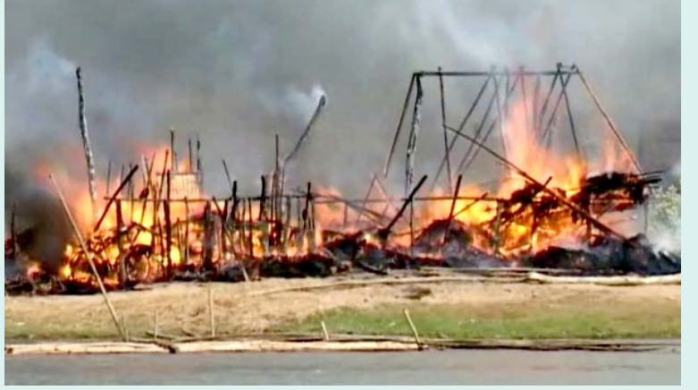
சாந்தியா கிராமத்தில் தர்ணா போராட்டம் நடத்திய விவசாயிகளைத் தாக்கி, போராட்ட அரங்கின் கொட்டகைகளைத் தீயிட்டுக் கொளுத்திய போலீசாரின் பயங்கரவாத வெறியாட்டம்.

யாகவே தாக்கி வருகிறது. இதன் உச்சகட்டமாக கடந்த மார்ச் மாதம் 30-ஆம் தேதி டாடாவின் குண்டர் படை பாலிகோதா கிராமத்தில் மிகப் பெரிய தாக்குதலை நடத்தியது. காட்டு வேட்டைக்கெனக் கொண்டு வரப்பட்ட துணை இராணுவப் படைகள் டாடாவின் குண்டர்களுடன் இணைந்து கொண்டு மக்களின் வீடுகளைக் கொளுத்தி, கால்நடைகளைக் கொன்றதுடன், குடிநீர் கிணற்றில் பெட்ரோலை ஊற்றின. 2006-இல் சுட்டுக் கொல்லப்பட்டவர்களின் நினைவிடங்களைச் சிதைத்துள்ளன.