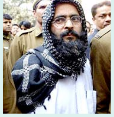
'தேசத்தின் இந்து' மனச்சாட்சியைத் திருத்திப்படுத்துவதற்காக, உச்சநீதி மன்றத்தால் தூக்குத் தண்டனை விதிக்கப்பட்ட அப்சல் குரு.