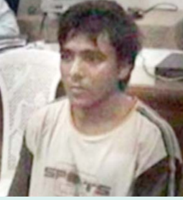
இந்தியா-பாகிஸ்தான் இடையே நடக்கும் போட்டி அரசியலின் பின்புலத்தில் அகப்பட்டுக் கொண்ட அஜ்மல் கசாப்.

அப்சல் குருவின் தூக்கு தண்டனையை உறுதி செய்தது.