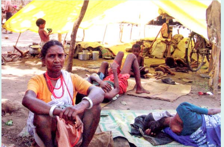
சட்டிஸ்கர் அரசு உருவாக்கிய சல்வாஜும் என்ற கூலிப்படையால், தமது கிராமங்களில் இருந்து துரத்தப்பட்டு, அகதி முகாம்களில் கட்டாயமாகத் தங்க வைக்கப்பட்டுள்ள பழங்குடியின மக்கள். (கோப்பு படம்)

“பழங்குடி மக்கள் பகுதிகளில் வளர்ச்சியைக் கொண்டுவராமல் நீண்டகாலமாக நாம் புறக்கணித்து விட்டோம். கிராமப் பொருளாதாரத்தைப் புறக்கணித்து விவசாயத்தை அழிய விட்டு விட்டோம். வேலையின்மை, வறுமை, ஏழைகளின் மீதான கொடுரச் சுரண்டல், நிலப்பிரபுக்கள்-கந்துவட்டிக்காரர்களின் சுரண்டல்-ஆதிக்கம், அதிகாரிகளின் ஊழல்.. எல்லாம் சேர்ந்து