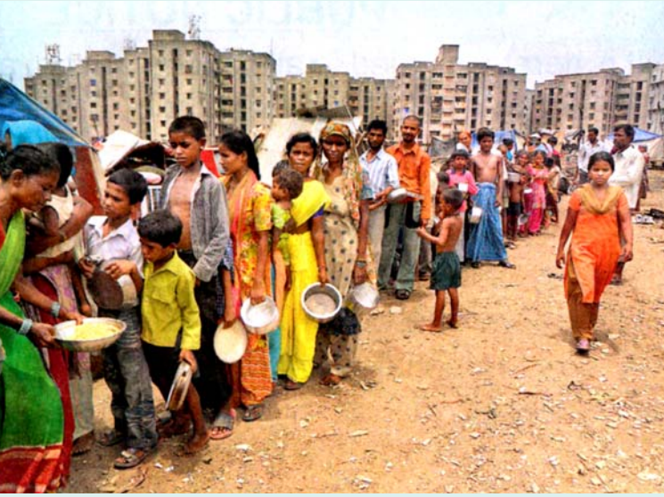
மும்பையில் உள்ள அன்னா பாவ் சாதேநகரில் உள்ள குடிசைகள் மாநகராட்சியால் இடித்துத் தள்ளப்பட்டதால், அகதிகளாக்கப்பட்ட உழைக்கும் மக்கள்.

கள், ரியல் எஸ்டேட் நிறுவன அதிபர்கள். மைய அரசும் இதே காரணத்தை முன்வைத்து, “அரசும் தனியாரும் கூட்டுச் சேர்ந்து புதிய நகரங்களை நிர்மாணிக்கும் பணிகளில் இறங்க வேண்டும்” என்பதை இந்த ஆண்டுக்கான பட்ஜெட்டிலேயே கொள்கை முடிவாக அறிவித்திருக்கிறது. “தற்பொழுதுள்ள பழைய நகரங்களில் நில வாடகை அதிகமாக இருப்பதால், தகவல் தொழில் நுட்ப நிறுவனங்களுக்கு மிகுந்த பாதிப்பு ஏற்படுவதாகவும், இதனைத் தவிர்ப்பதற்கு லாவாலா போன்ற புதிய நகரங்களை உருவாக்க மாநில அரசுகள் முன்னுரிமை தர வேண்டும்” எனத் திட்ட கமிசனும் அறிவித்திருக்கிறது. அதாவது, நகர உருவாக்கம் மற்றும் நகர நிர்வாகம் ஆகிய பொறுப்புகளை அரசு கைவிடத் தயாராகிவிட்டது என்பதைத்தான் இந்த அறிக்கைகள் மறைமுகமாகத் தெரிவிக்கின்றன.