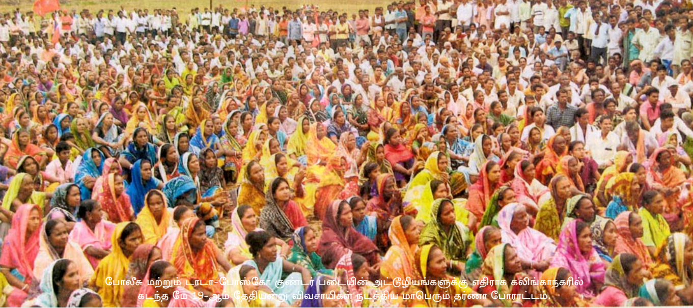
போலீசு மற்றும் டாடா-போஸ்கோ குண்டர் படையின் அடடூழியங்களுக்கு எதிராக கலிங்காநகரில் கடந்த மே 19-ஆம் தேதியன்று விவசாயிகள் நடத்திய மாபெரும் தர்ணா போராட்டம்.

தனியார்மயத்திற்கு எதிரான போராட்டங்களை அடக்குமுறைகளால் நசுக்கிவிட முடியாது என்பதற்கான களச்சான்று.