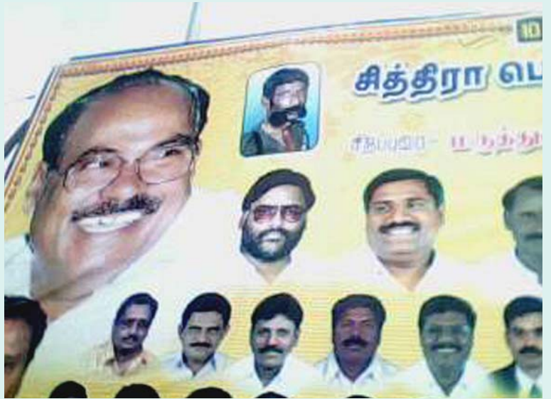
‘வீர வன்னியன்’ வீரப்பன் படத்துடன், “10 லட்சம் மானமுள்ள வீர வன்னியர்களே, சித்திரைத் திருவிழாவுக்கு வாருங்கள்!” என்ற வாசகங்களுடன் கொளத்தூர் பேருந்து நிலையத்தில் சாதியைப் பறைசாற்றி பாட்டாளி மக்கள் கட்சி வைத்திருந்த பிரம்மாண்ட விளம்பரத் தட்டி.

குமுறிய வன்னிய சாதி வெறியர்கள், தாழ்த்தப்பட்டோரைச் சமூகப் புறக்கணிப்பு செய்யத் தொடங்கினர். சித்திரைத் திருவிழாவின் போது, “நமக்கு அடங்காத ஆதிதிராவிடர்கள் இனிமே கோயில் விழாவுக்கு மேளம் அடிக்க கூடாது, அருந்ததியர்களை வெச்சு மேளம் அடிச்சுக்கலாம்” என்று வன்னிய நாட்டாமைகள் கடந்த ஏப்ரலில் உத்தரவிட்டனர். வன்னிய நாட்டாமைகளின் மிரட்டலுக்கு அஞ்சி மேளம் அடித்த அருந்ததியர்களிடம், முதல்நாள் திருவிழா முடிந்ததும் ஆதி திராவிடர்கள் சிலர் தகராறு செய்ய, அது வாய்ச்சண்டையில் முடிந்திருக்கிறது.