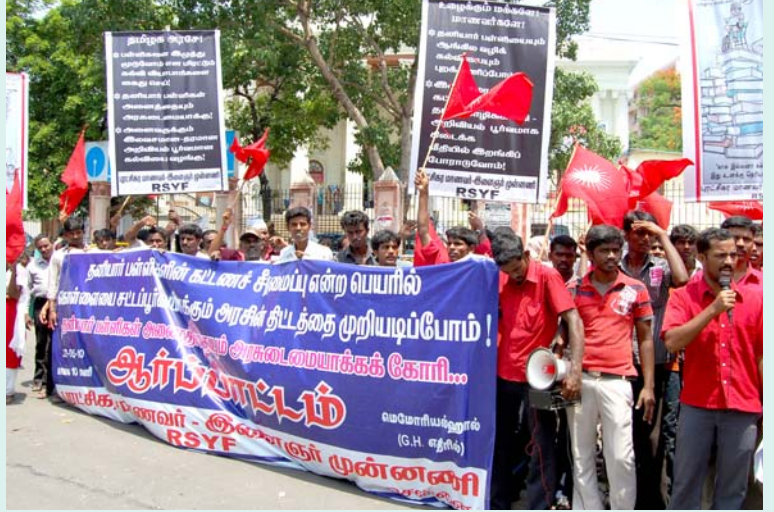
தமிழக அரசு கொண்டு வந்துள்ள கட்டண முறைப்படுத்தும் சட்டத்தின் மோசடத்தனத்தை அம்பலப்படுத்தி, புரட்சிகர மாணவர்-இளைஞர் முன்னணி சென்னையில் நடத்திய ஆர்ப்பாட்டம்.

இதற்குப் பெயர் தியாகம் அல்ல; தவறை எதிர்க்கத் துணியாத, நியாயத்திற்காகப் போராட விரும்பாத தன்