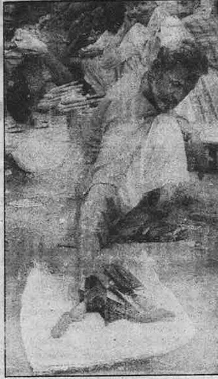
தில்லியின் ஜமா மசூதி பகுதியில் கூலி வேலைக்காகக் காத்திருக்கும் தொழிலாளர்கள்; திசையமற்ற வாழ்க்கை.

இதற்கு இணையாகவும், அரிசி, கோதுமை பயிரிடும் விவசாயிகளை அச்சாகுபடியில் இருந்து அப்புறப்படுத்தும் விதமாகவும், "உணவுப் பொருள் உற்பத்தியில் நாம் தன்னிறைவு அடைந்துவிட்டோம்; எனவே, விவசாயிகள் மலர் சாகுபடி போன்ற பணப்பயிர் உற்பத்தியில் ஈடுபட