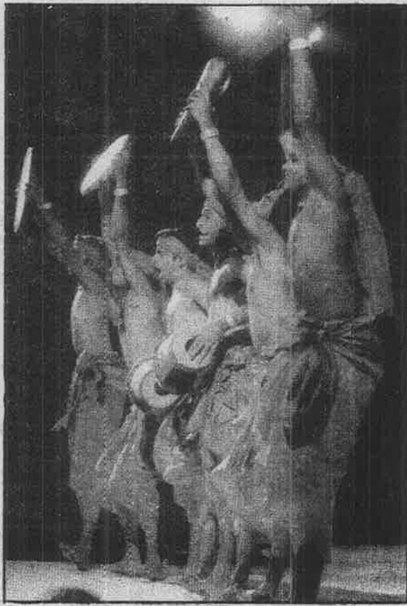
சென்னை சங்கமத்தில் நடந்த தப்பாட்டம்.

ஏற்கெனவே பேரனை மத்தியிலும், மகனை மாநிலத்திலும், கட்சியிலும் பதவிகளால் அலங்கரித்து வைத்துள்ள கருணாநிதி, தனது மகளையும் சங்கமம் மூலம்