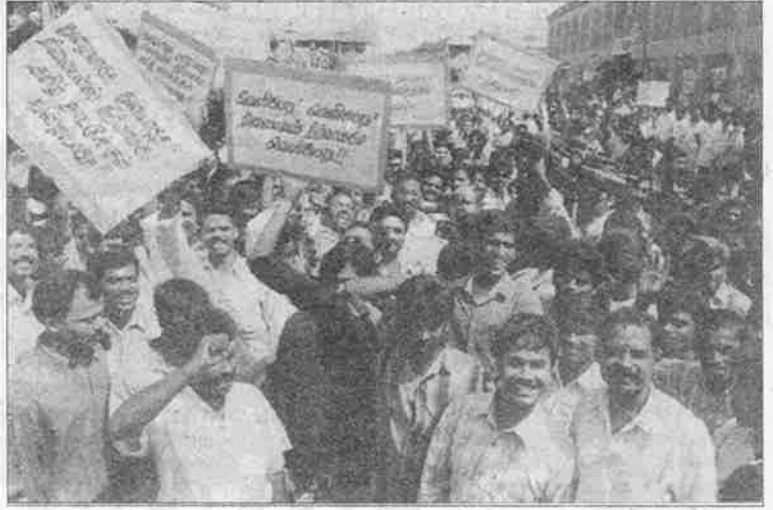
சென்னை - கோயம்பேடு மார்க்கெட்டைச் சேர்ந்த காய்கறி - பழ வியாபாரிகள் ரிலையன்ஸை வெளியேறக் கோரி நடத்திய கண்டன ஆர்ப்பாட்டம்.