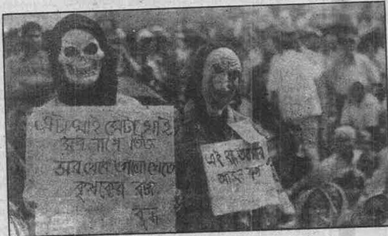
சி.பி.எம். கட்சியின் பாசிச கொலைவெறியாட்டத்துக்கு எதிராக கொல்கத்தாவில் எதிர்க்கட்சிகள் நடத்திய ஆர்ப்பாட்டம்.

யான விவசாயிகள் மீது கண்முடித்தனமாக 67 ரவுண்டுகள் துப்பாக்கிச் சூடு நடத்தினர். போலீசு சீருடை அணிந்து கொண்டு, அவர்களோடு சேர்ந்து வந்த 250-க்கும் மேற்பட்ட சி.பி.எம். குண்டர்கள் நாட்டுத் துப்பாக்கிகள், வெடிகுண்டுகள், கோடாரியோடு நந்திகிராம மக்கள் மீது கொலைவெறியாட்டம் போட்டனர். போலீசார் பூட்ஸ் அணிந்திருக்க,