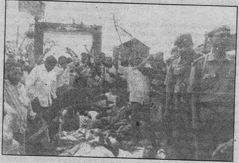
பத்திரிகையாளர்களை நந்திகிராமத்துக்குள் நுழைய விடாமல் தடுத்து மறியல் போராட்டம் நடத்தும் சி.பி.எம். குண்டர்கள்.

சி.பி.எம். குண்டர்கள் சாதாரண செருப் புடன், சீருடையில் அரசு இலச்சிணை இன்றி தாக்குதல் நடத்தியதை நந்திகிராம மக்கள் அனைத்துப் பத்திரிகைகள்-தொலைகாட்சி நிறுவனங்களிடம் சாட்சியமளித்துள்ளனர். நந்திகிராம மக்களைக் கொன்றொழிக்கும் வெறியோடு இந்தத் துப்பாக்கிச் சூடு நடத்தப்பட்டுள்ளது. ஏனெனில், கொல்லப்பட்டவர்கள் அனைவரும் முதுகு, வயிறு, நெஞ்சு, தலைப்பகுதியில் குண்டடிப்பட்டு மாண்டு போயுள்ளார்களே தவிர, முழங்காலுக்குக் கீழாகக் குண்டுக் காயம்பட்டவர்கள் ஒருவர் கூட இல்லை.