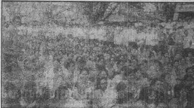
இரண்டாயிரத்துக்கும் மேற்பட்ட பிரிக்கால் தொழிலாளர்கள் கோவை-மேட்டுப்பாளையம் சாலையை மறித்து நடத்திய போராட்டம்.

இடமாற்றம் செய்யப்பட்ட மறுநாளே உள்ளிருப்பும் போராட்டத்தில் குதித்தது. நிர்வாகத்திற்கு அதிர்ச்சி வைத்தியம். கொடுத்தனர். அடாவடித் தனமான இடமாற்றலை ரத்து செய்யக் கோரி, மார்ச் 4-ஆம் தேதி முதல் காலவரையற்ற வேலை நிறுத்தத்தை நடத்தி வருகின்றனர்.