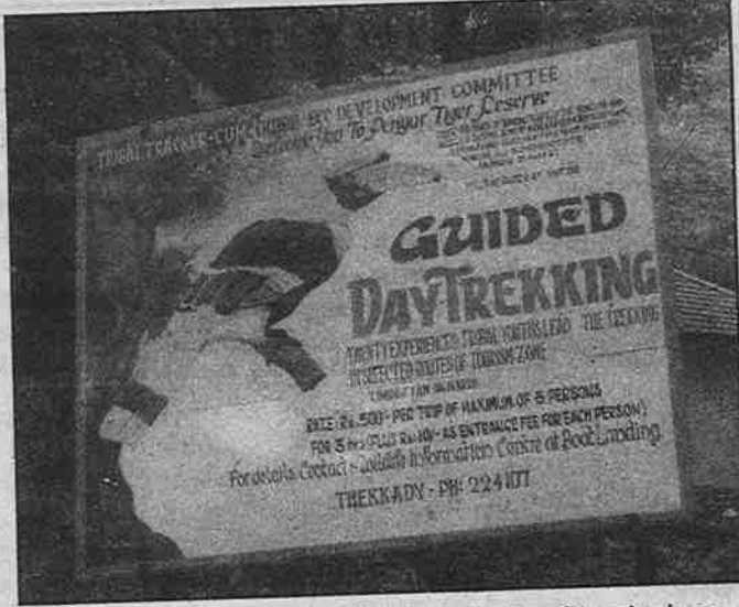
பழங்குடியினர் வனப்பகுதியில் நுழைவதற்கும், வசிப்பதற்கும் பல கட்டுப்பாடுகளை விதிக்கும் அரசு, சுற்றுலா என்ற பெயரில் அந்நியர்களைப் பாக்கு-வெற்றிலை வைத்து அழைக்கிறது.

என்று வாக்குறுதியளிக்கின்றனர். மக்களுக்குச் சாதகமான இச்சட்டத்தை விரைவில் அமல்படுத்தும் முயற்சிகளை மேற்கொண்டு, மலைவாழ் மக்களிடையே இச்சட்டம் குறித்த விழிப்புணர்வை ஏற்படுத்தி, பழங்குடி மக்களின் நில உடைமையை பாதுகாப்பதற்காகப் பாடுபட வேண்டும்; இந்த வாய்ப்பைப் பயன்படுத்திப் பழங்குடி மக்களின் மத்தியில் இடதுசாரி சக்திகளின் வலுவைக் கூட்டி அமைப்பை விரிவுபடுத்த வேண்டும் என்றும் சவடால் அடிக்கின்றனர்.