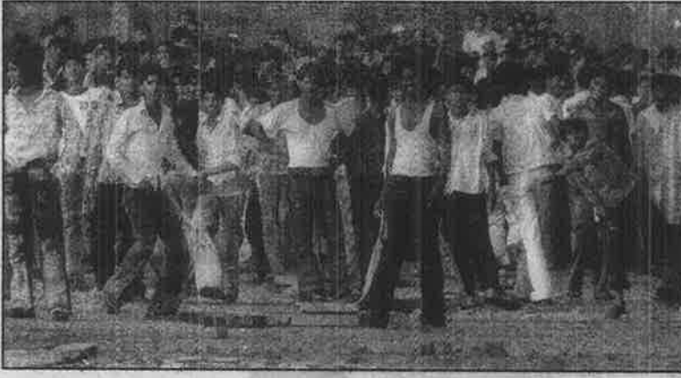
ஆயிரக்கணக்கான சில்லறை வியாபாரக் கடைகளை மூடச் சொல்லி உத்தரவு போட்ட உச்சநீதி மன்றத்தீர்ப்புக்கு எதிராக தில்லி வணிகர்களும், கடைச் சிப்பந்திகளும் நடத்திய போராட்டம். (கோப்புப்படம்)

கிறது உச்சநீதி மன்றம். சென்னை, மும்பை, டெல்லி, கல்கத்தா போன்ற பெரு நகரங்களில் நடைபாதை வியாபாரிகளை புல்டோசர் வைத்து அப்புறப்படுத்துகிறது அரசு. இதையும் மீறி உயிரோடிருக்கும் சிறு வணிகர்களை ஒழித்துக் கட்டுவதற்காகவே பன்னாட்டு நிறுவனங்களின் உத்தரவின் பேரில் வாட் என்ற வரி விதிப்பு முறை நாடு முழுவதும் திணிக்கப்பட்டிருக்கிறது.