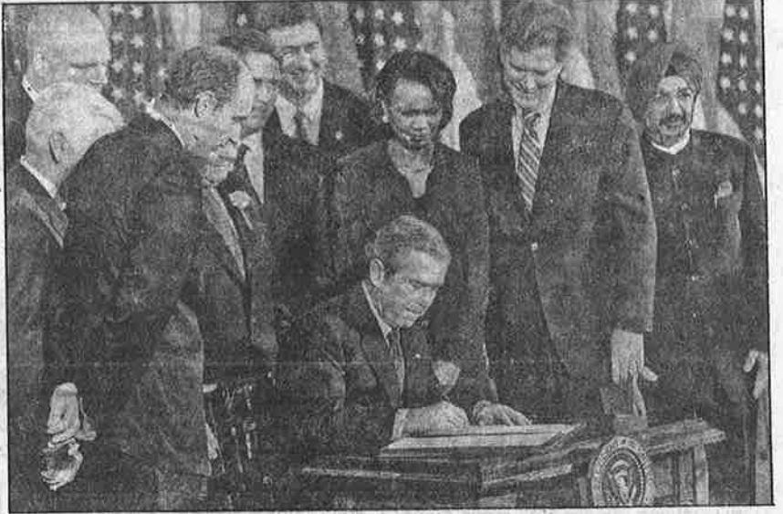
அமெரிக்க நாடாளுமன்ற உறுப்பினர்கள் முன்னிலையில் "ஹைட்" சட்டத்தில் கையெழுத்திடும் அதிபர் ஜார்ஜ் புஷ்.

இந்தியா - அமெரிக்கா இடையே அணு ஆற்றல் கூட்டுறவு தொடர்பாகப் பேச்சு வார்த்தை தொடங்கிய பொழுது, இந்தியா, "தனது சிவில் அணு உலைகளை, தனது விருப்பப்படி தான் சர்வதேச அணு ஆற்றல் கமிசனின் கண்காணிப்புக்கு உட்படுத்தும்" எனக் கூறியதாகவும், அதன் பின்னர்தான் தனது நிலையை மாற்றிக் கொண்டு, "தனது சிவில் அணு உலைகளை, அவற்றின் ஆயுட்காலம் முழுவதும் எவ்வித நிபந்தனையும் இன்றி சர்வதேச அணு சக்தி முகாமைப்பின் கண்காணிப்புக்கு உட்படுத்தச் சம்மதித்ததாகவும்" கூறப்படுகிறது. "இந்த ஒப்பந்தத்தின் அடிப்படையில் வெளிநாடுகளில் இருந்து இறக்குமதி செய்யப்படும் அணு உலைகளுக்குத் தேவைப்படும் எரிபொருளை, அந்த அணுஉலைகளின் ஆயுட்காலம் முழுவதும் வழங்க