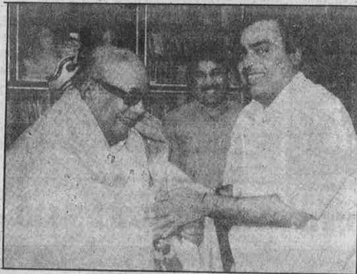
தமிழக விவசாயிகளிடமிருந்து வேளாண் பொருட்களைக் கொள்முதல் செய்யும் திட்டம் குறித்து முதல்வர் கருணாநிதியுடன் பேச்சுவார்த்தை நடத்த வந்த தரகு முதலாளி முகேஷ் அம்பானி.

இது ஒருபுறமிருக்க, கடந்த மூன்று, நான்கு மாதங்களாக மிளகாய் வத்தல், புளி, பருப்பு, எண்ணெய் வித்துகள் போன்ற உணவுப் பொருட்களின் விலை தாறுமாறாக உயர்ந்து