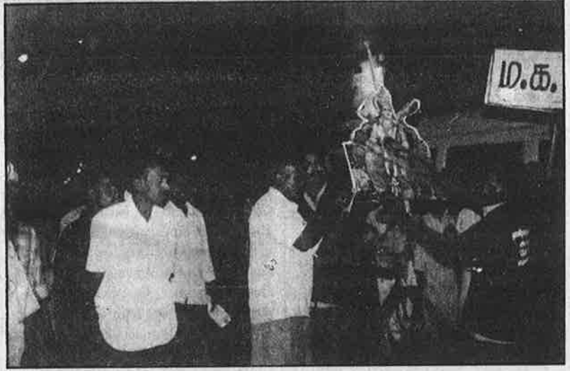
திருச்சி - சிறீரங்கத்தில், பார்ப்பன உயர்வருணத்தினரின் சாதி சங்கத் தலைவன் இராமனின் படத்தைச் செருப்பால் அடித்தும் எரித்தும் ம.க.இ.க. நடத்திய ஆர்ப்பாட்டம்.