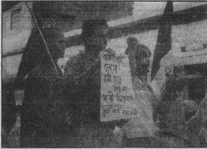
“எங்களுக்குக் கார் வேண்டாம்; அரிசி வேண்டும்” — ‘டாடாமார்க்சிஸ்டு’களுக்கு எதிராக சிங்கூர் விவசாயிகளின் போராட்டம்.