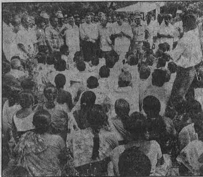
மலட்டு பருத்தி விதையினால் நட்டமடைந்துள்ள விவசாயிகள், தருமபுரி வேளாண்மை துறை அலுவலகம் முன்பு நடத்திய ஆர்ப்பாட்டம்.