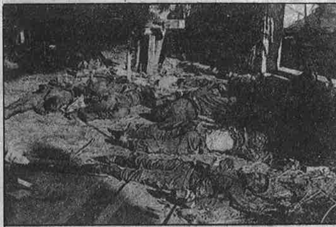
முகமலை தாக்குதலின்பொழுது கொல்லப்பட்ட சிங்கள சிப்பாய்கள்.

யாவுக்கு தெரியாமல் அதிகாரிகளாகவே மேற்கொள்ளும் நடவடிக்கை தான் என்று அவர்கள் பூசி மெழுகுகிறார்கள்.