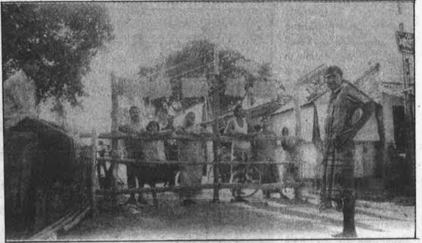
நேற்று வரை விவசாயிகள்; இன்று...? — கிராம நுழைவாயிலில் தடுப்பரண எழுப்பிப் போராடிய சிங்கூர் விவசாயிகள்.

இதே நிலைமைதான் சிங்கூரிலுள்ள ஆயிரத்துக்கும் மேற்பட்ட கூலி விவசாயிகளுக்கும் நேரும். ஏனெனில், கையகப்படுத்தப்படும் நிலத்தின் உடைமையாளர்களுக்குத்தான் அரசு நிவாரணம் தருமெயொழிய, மற்றவர்களுக்கு எதுவும் கிடைக்காது. இக்கிரா