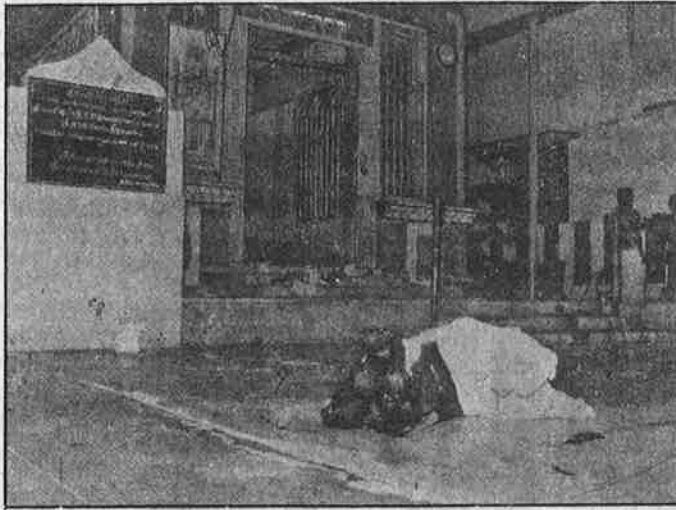
பெரியார் சிலை உடைப்புக்குப் பதிலடியாக, ஈரோட்டில் உள்ள ராகவேந்திரா கோயிலின் மூல விக்கிரகம் உடைக்கப்பட்டது.

பெரியாரின் தொண்டர்கள் என்று கூறிக் கொள்வோர் என்ன செய்தார்கள்? "இனி பொறுப்பதற்கில்லை; நெருப்புடன் விளையாதே" என்று 2 நாள் கழித்து அறிக்கை விட்டார் வைகோ. இதேநிலை தொடர்ந்தால் நாடு தழுவிய போராட்டம் என்று 3 நாள் கழித்து அறிக்கை விட்டார் திருமா. பூணூல் அறுப்பு, இராமன் எரிப்பு போன்ற நடவடிக்கைகளைப் பற்றி பெரிதும் கவலைப்பட்ட 'மார்க்சிஸ்டு' கட்சி கவனத்துடன் செயல்படுமாறு காவல்துறையைக் கேட்டுக் கொண்டது. "இந்து பாசிச அமைப்புகள் தலைதூக்குகின்றன. எச்சரிக்கையுடன் இருக்க வேண்டும்" என்று பயமுறுத்தியது வலது கம்யூனிஸ்டுகளின்