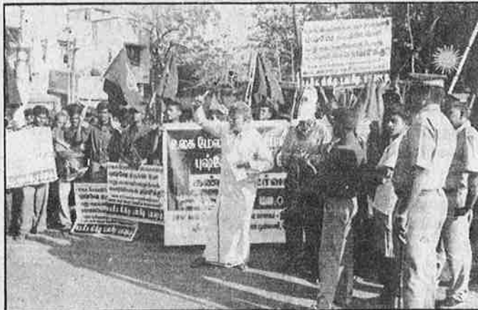
சென்னையில் போலீசார் விதித்த தடையை எதிர்த்துப் போராடி நடந்த ஆர்ப்பாட்டம்.

இந்த நகரங்கள் தவிர்ந்து, சேலம், கரூர், இராணிப்பேட்டை, மதுரை, கடலூர், உசிலம் பட்டி உள்ளிட்டு தமிழகத்தின் பல்வேறு பகுதிகளிலும் பேரணி, ஆர்ப்பாட்டம், பேருந்து பிரச்சாரம், புஷ்டி உருவ பொம்மையைத் தூக்கில் தொங்க விடுதல் ஆகிய வடிவங்களில் புஷ்டி எதிர்ப்பு இயக்கம் நடத்தப்பட்டது.