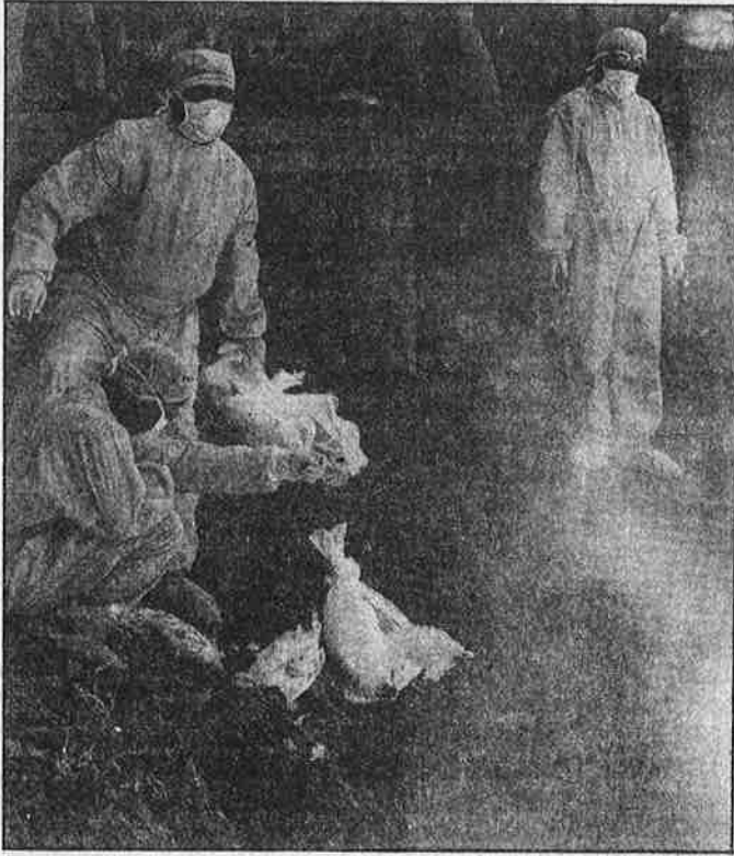
மகாராஷ்டிராவின் நவபுர்பகுதியில் பறவைக் காய்ச்சலால் பாதிக்கப்பட்ட கோழிகளைக் கொண்டு புதைக்கும் சுகாதார ஊழியர்கள்.

உலகளவில் பறவைகாய்ச்சலின் ஊற்றுமூலமே மேற்குறிப்பிட்ட வகையிலான ஒப்பந்த விவசாய நிறுவனங்களே ஆகும். இவர்களின் அத்தீத இலாபத்திற்காக, பரவலாக பல்இனக் கோழிகள் கொண்டு இயற்கை சார்ந்த பாரம்பரிய உற்பத்தியாக இருந்த புறக்கடை (Backyard Poultry) கோழி வளர்ப்பை ஒழித்துக் கட்டினர். அதற்கு மாறாக, ஒரு சில இனங்களைக் கொண்டு கோடிக்கணக்கான கோழிகளை குறிப்பிட்ட வட்டாரத்தில் குவித்து தொழிற்மயமாக்கி இயற்கைக்கு முரணாக அராஜக உற்பத்தியில் ஈடுபடுகின்றனர்.