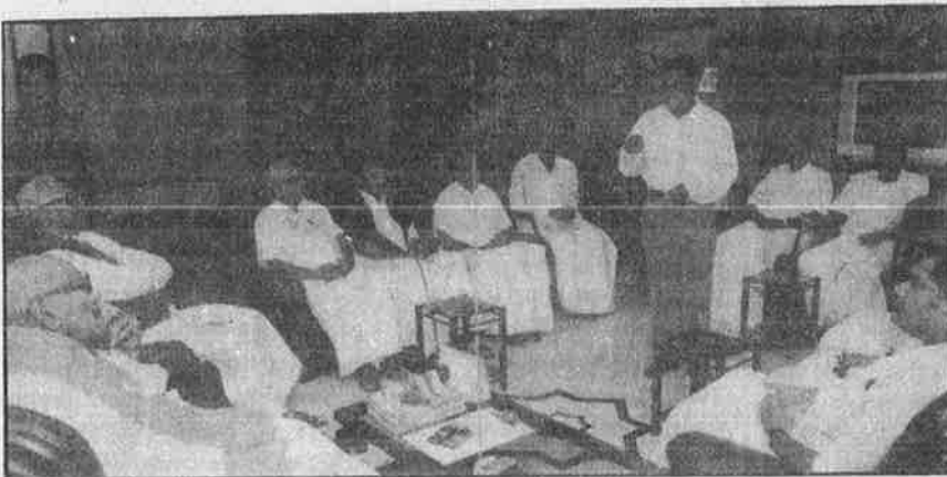
2001 சட்டமன்றத்தேர்தலில் அ.தி.மு.க. பக்கம் இருந்த த.மா.கா., போலி கம்யூனிஸ்டு கட்சிகள் (மேலே), நாடாளுமன்றத்தேர்தலின் பொழுது தி.மு.க. பக்கம் சேர்ந்தன: இந்த அணி சேர்க்கைக்கு அடிப்படை கொள்கையா? கொள்ளையா?

ளும், சில பதவிகளையும் பண்பெட்டிகளையும் விட்டெறிந்தால் யாரையும் விலைக்கு வாங்கிவிட முடியும் என்று அக்கும்பல் உறுதியாக நம்பியது.