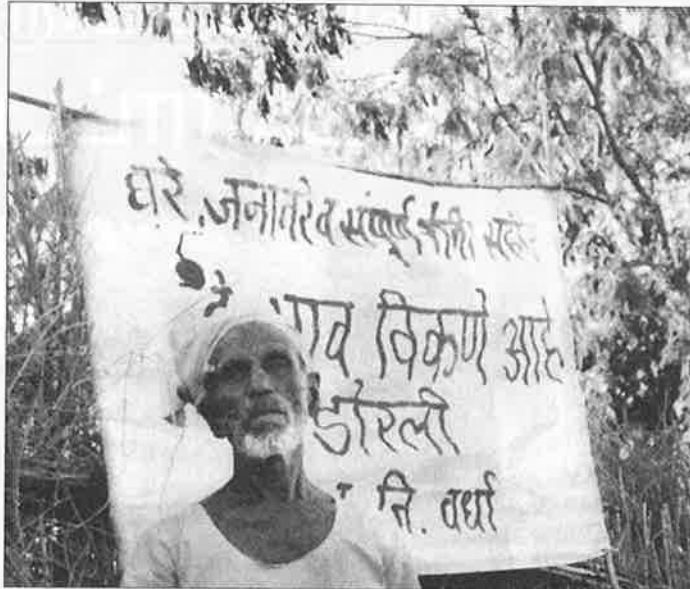
கந்துவட்டிக்கடனை அடைக்க கிராமத்தை விற்கப் போவதாக அறிவித்துக் கட்டப்பட்டுள்ள பதாகை.

நாடெங்கும் தாராளமயம் தோற்று வித்துள்ள பயங்கரத்துக்கும் அவலத்துக்கும் இன்னுமொரு சாட்சிதான் மகாராஷ்டிரா விவசாயிகளின் “சிறுநீரக விற்பனை மையங்கள்.” தொழில் வளர்ச்சியில் முதலிடம் வகிக்கும் பணக்கார மாநிலமாகச் சித்தரிக்கப்படும் மகாராஷ்டிராவின் நிலைமையே இப்படி இருக்கும்போது, நாட்டின் பிற பகுதிகளைப் பற்றி சொல்ல வேண்டிய தில்லை. விலை வீழ்ச்சியால் தக்காளியைத் தெருவில் கொட்டிவிட்டு கடன்சுமை தாளாமல் தற்கொலை செய்து கொள்ளும் விவசாயிகள், ஆலையிலிருந்து வெட்டுவதற்கான உத்தரவு வராமல் நட்டப்பட்டு, கரும்புக் காட்டையே கொளுத்தும் விவசாயிகள், உரிய விலை கிடைக்காமல் காய்கறிகளையும் பழங்களையும் தெருவிலே கொட்டி வேதனையை வெளிப்படுத்தும் விவசாயிகள், வேலை கிடைக்காமல் நாடோடிகளாக