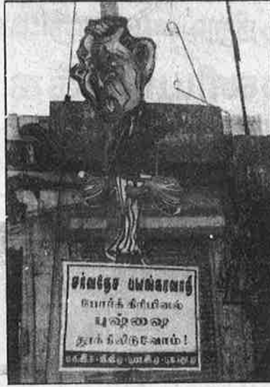
கரூர் நகரில் தூக்கில் தொங்கும் “ஜார்ஜ் புஷ்டி” பி.ரே.தம்.”

புஷ்டி முகமூடி அணிந்து கொண்டு நடத்தப்பட்ட பேருந்து பிரச்சாரத்தைத் தடுப்பதற்காக முனைந்த போலீசார், “இ.மு.க. மூடியைப் பார்த்துக் குழந்தைகள் பயப்படுவதாக” ஒரு புரூகு மூட்டையை அவிழ்த்துவிட்டது. ஈராக்கில் ஐந்து இலட்சம் குழந்தைகள் சாவுக்கு காரணமான இவனை அம்பலப் படுத்தவில்லை என்றால், இன்னும் பல இலட்சம் குழந்தைகள் இறந்து போக நேரிடும் எனத் தோழர்கள் பதிலடி கொடுத்தவுடன் மறு பேச்சில்லாமல் வாயை மூடிக் கொண்டனர்.