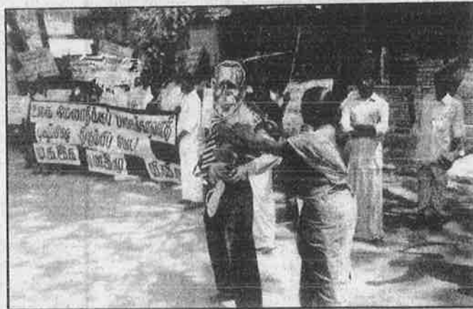
மதுரையில் நடந்த ஆர்ப்பாட்டத்தில் செருப்பு மாலை போடப்பட்டு அவமானப்படுத்தப்படும் “ஜார்ஜ் புஷ்”.

● ஓசூரில் பு.ஜ.தொ.மு., வி.வி.மு., ஆகிய அமைப்புகள் இணைந்து பிப். 28 அன்று நடத்திய கண்டன ஊர்வலம் பொதுமக்களின் கவனத்தை ஈர்க்கும் படி சிறப்பாக நடந்தது.