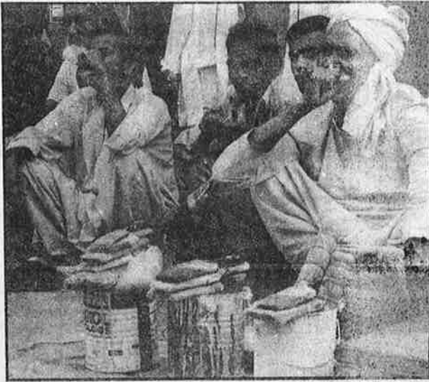
கூலி குறைவாக இருந்தாலும், ஏதாவது வேலை கிடைக்குமா எனக் காத்திருக்கும் தில்லியைச் சேர்ந்த உதிரித் தொழிலாளர்கள்.

இதற்கு நேர்மாறாக, தரகு முதலாளிகளுக்கு வழக்கம் போலவே வரிச் சலுகைகள் வாரி வழங்கப்பட்டுள்ளன. முதலாளித்துவ நிறுவனங்களின் வருமானத்தின் மீது விதிக்கப்படும்