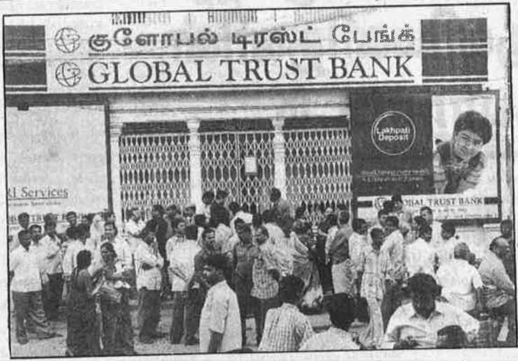
குளோபல் டிரஸ்ட் பேங்க் திவாலானதையடுத்து கோவையிலுள்ள அத்தனியார் வங்கிக் கிளையின் வாயிலில் பீதியுடன் திரண்ட முதலீட்டாளர்கள்: தாராளமயத்தின் மகிமை!

பங்குச் சந்தை ஊக வணிகத்துடன் நேரடியாகப் பிணைக் கப்பட்ட இந்த வங்கி, அதன் ஏற்ற இறக்கங்களால் தடுமாறத் தொடங்கியது. இருப்பினும், கொழுத்த ஆதாயத்தை ஈட்டும் வெறியோடு, பங்குச் சந்தை சூதாட்டத்தில் இறங்கியது. ஆனால், பங்குச் சந்தையோ அர்சத் மேத்தா, கேதான் பரேக் போன்ற மோசடிப் புர்வழிகளால் ஏற்கெனவே நெருக்கடியில் சிக்கிக் கொண்டிருந்ததால், இந்தச் சூதாட்டத்தில் குளோபல் டிரஸ்ட் வங்கி தொடர்ந்து நட்டமடைந்தது. தமது முதலீடுகள் பாதுகாப்பாக இல்லாததை உணர்ந்த சர்வதேச நிதி கார்ப்பரேஷனும் உலக வங்கியும் தமது முதலீடுகளைத் திரும்பப் பெற்று, தாமே ஊட்டி வளர்த்த இந்த வங்கியை கைக்குவின. ஆனால், அவை திணித்த தாராளமயக் கொள்கையின் தோல்