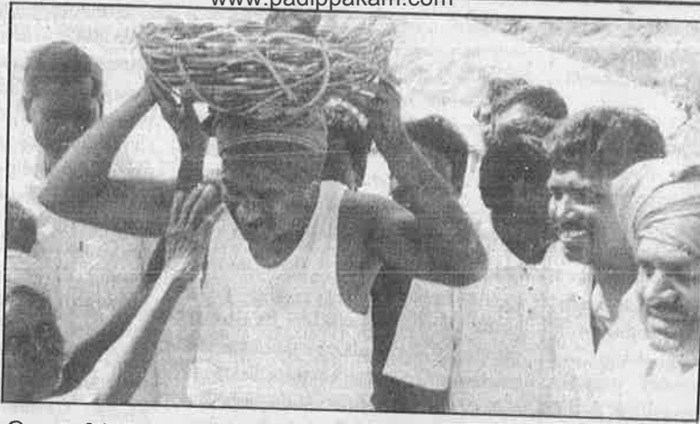
இராமதாசின் வாரிசு அன்புமணி: பதவியைப் பிடிக்க "பசுமைத் தாயகம்" நாடகம்.

இராஜீவ் காந்தியும் இளையவர், புதியவர், பழைய கறைகள் இல்லாத திருவாளர் பரிசுத்தம் என்று பட்டமளித்து வரவேற்கப்பட்டார். அவர், தான் இடதுசாரியும் கிடையாது; வலது சாரியும் கிடையாது; சித்தாங்களி எனக் கட்டுப்படுத்தப்படு