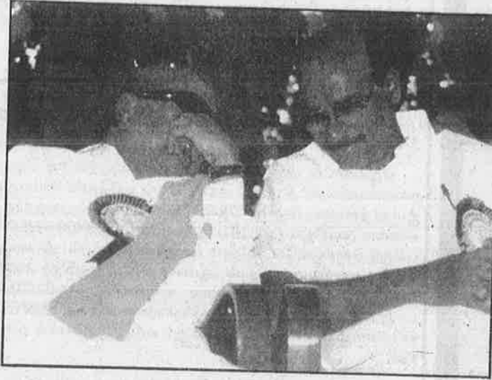
வாரிசு அரசியலில் இட ஒதுக்கீடு: கருணாநிதிக்கு இரண்டு: ராமதாசுக்கு ஒன்று.

ஸ்டாலினைப் போல வாசன், தயாநிதி, அன்புமணி ஆகியோரின் அரசியல் நுழைவுக்கு நீண்டகால முயற்சிகள் தேவையாக இருக்கவில்லை. உண்மையில் இவர்கள் கட்சியிலும் பதவிகளிலும் திணிக்கப்பட்டார்கள். அதிலும் வாசனை விட மற்ற இருவரும் அதிரடியாக வந்து கட்சி மற்றும் பதவிகளை ஆக்கிரமித்துக் கொண்டார்கள்.