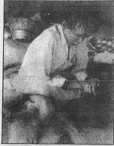
ஆந்திர மாநில விவசாயி ஜனாரெட்டியின் மருத்துவக் கடன் மட்டும் ரூ. 3 இலட்சத்தைத் தாண்டியது. எனினும், தனியார் மருத்துவமனையால் அவரது உயிரைக் காப்பாற்ற முடியவில்லை.

வடக்கு குஜராத்தைப் பொருத்த வரை நிலத்தடி நீரை எடுத்துப் பயன்படுத்தாமல் விவசாயமே செய்ய முடியாது. அம்மாநிலத்தில் ஏற்கெனவே பம்பு செட்டுகளுக்கான மின் கட்டணம் (ஒரு குதிரை சக்தி மோட்டாருக்கு ரூ. 350/-) மிக அதிகம். மின்சார வாரியத்