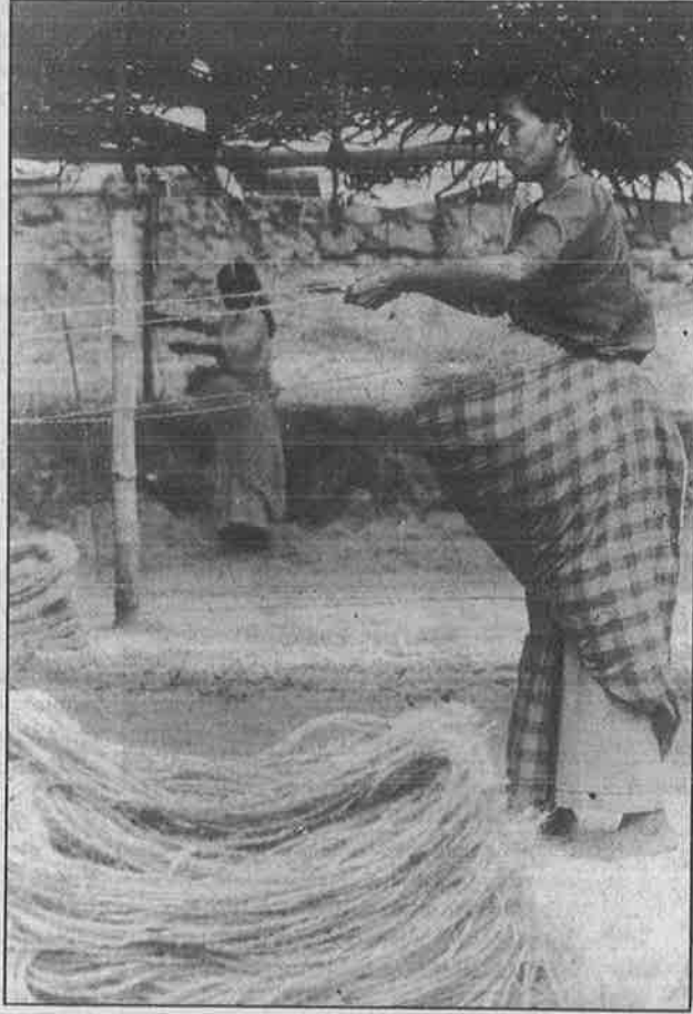
கேரளாவில் நார்க்கயிறு தயாரிக்கும் தொழிலில் ஈடுபட்டுள்ள 4 இலட்சம் தொழிலாளர்கள், காங்கிரசின் ஆட்சியில் முன்னெப்போதும் கேட்டிராத வறுமையில் சிக்கிக் கொண்டனர்: தாராளமயத்தின் பின்விளைவு.

தாராள இறக்குமதியால் பாதிக்கப்படாத பணப் பயிர் விவசாயமே இன்று இந்தியாவில் கிடையாது. கேரளாவில் மட்டும் ரப்பர், தேயிலை, காபி, ஏலக்காய் விவசாயத்தில் ஈடுபட்டுள்ள 14