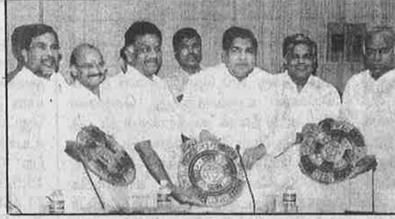
காவிரியில் தண்ணீர் திறந்து விட மன்றாடி, கர்நாடக முதல்வர் தரம் சிங்குக்குப் (இடமிருந்து இரண்டாவது) பொன்னாடை போர்த்தி விடும் தி.மு.க. கூட்டணிக் குழு (மேல் படம்). இதற்குப் போட்டியாக கர்நாடக முதல்வரைப் பார்த்து, தஞ்சாவூர் தட்டைத் தரும் அ.தி.மு.க. குழு (கீழ் படம்) கபினி அணையை வெள்ள அபாயத்தில் இருந்து பாதுகாப்பதற்காக கர்நாடகா உபரி நீரைத்தான் திறந்து விட்டது. தி.மு.க. கூட்டணியும், அ.தி.மு.க.வும் அதை தங்களின் சாதனையாகப் பீற்றிக் கொண்டு தமிழக மக்களை ஏய்க்கின்றன.

தந்திரங்களை மேற்கொள்கிறது. ராவி-பியாஸ்-சட்லஜ் நதிநீர் பங்கீடு பிரச்சினையில் மின்னல் வேகத்தில் செயல்படும் மத்திய அரசு காவிரிப் பிரச்சினையில் கர்நாடகாவின் குழுச்சி, தந்திரம், நிர்ப்பந்தங்களுக்குப் பணிந்து, தமிழகத்திடம் மாற்றாந்தாய் மனப்போக்கை மேற்கொண்டு வருகிறது.