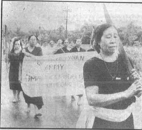
ஆயுதப் படையினர் சிறப்பு அதிகாரச் சட்டத்தை நீக்கக் கோரி மணிப்பூர் பெண்கள் நடத்திய தீப்பந்த ஊர்வலம்.

இந்தச் சட்டம் மணிப்பூர் மாநிலத்தில் கடந்த 24 ஆண்டுகளாக நடைமுறையில் இருந்து வருகிறது. வேறு மாதிரியாகச் சொன்னால், அம்மாநிலத்தில் கடந்த 24 ஆண்டுகளாக அறி