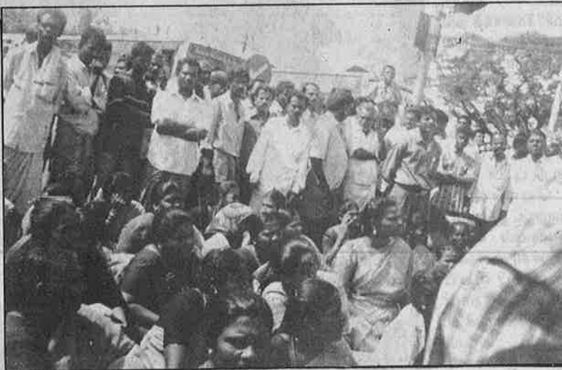
பு.மா.இ.மு. தலைமையில் எரிந்த பள்ளியின் மாணவர்களது பெற்றோர்கள் திரண்டு நடத்திய சாலை மறியல்.