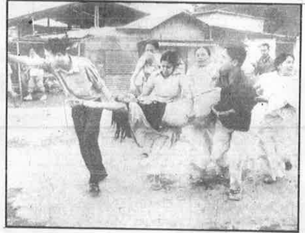
மனோரமாவின் படுகொலையை கண்டித்து நடந்த ஆர்ப்பாட்டத்தின் மீது போலீசு நடத்திய கண்ணீர் புகை குண்டு வீச்சு தாக்குதலில் காயமடைந்த பெண்ணைத் தூக்கிச் செல்லும் ஆர்ப்பாட்டக்காரர்கள்.

மனோரமாவைச் சித்திரவதை செய்து, பாலியல் பலாத்காரப்படுத்தி, துப்பாக்கியால் சுட்டுக் கொலை செய்துவிட்டுத் தூக்கியெறிந்துவிட்டதாக இந்திய இராணுவத்தின் மீது மணிப்பூர் மக்கள் அனைவரும் ஒரே குரலில் குற்றஞ் சுமத்தியுள்ளனர். தீவிரவாத ஒழிப்பு என்ற பெயரில் நடத்தப்பட்டுள்ள இந்தப் பச்சை படுகொலையைக் கண்டித்து, 40-க்கும் மேற்பட்ட பெண்கள், தங்களின் ஆடைகளைக் களைந்துவிட்டு, "இந்திய இராணுவமே, எங்களையும் பாலியல் பலாத்காரப்படுத்து" என்ற ஆர்ப்பாட்ட முழக்கம் எழுதப்பட்ட பதாகையை உடம்பில் போர்த்திக் கொண்டு, மணிப்பூர் மாநிலத் தலைநகர் இம்பாலில் உள்ள அசாம் துப்பாக்கிப் படைப் பிரிவின் தலைமையகம் முன் நடத்திய ஆர்ப்பாட்டம்தான் அட்டையில் உள்ள படம். பெண்கள், நிர்வாணமாக நடுத்தெருவுக்கு வந்து போராடுகிறார்கள் என்றால், இந்திய இராணுவத்தின் அட்டுழியங்கள் எவ்வளவு தூரம் எல்லை மீறிப்போயிருக்க வேண்டும்!