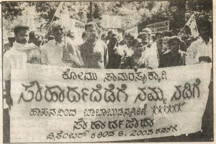
பிரபல நாடகக் கலைஞர் கிரிஷ் கர்னாட் (இடமிருந்து மூன்றாவது) தலைமையில் நடந்த மதவெறி எதிர்ப்பு ஆர்ப்பாட்டம்.

அதேசமயம், டிசம்பர் 7-8 தேதிகளில் இந்து வெறியர்கள் பாபாபூதான்