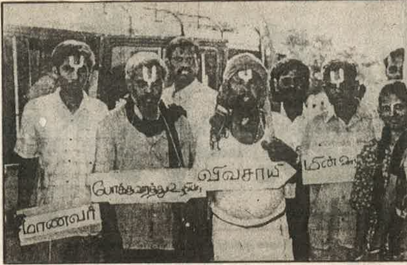
ஜெயலலிதா உழைக்கும் மக்களின் உரிமையைப் பறிப்பதை, பட்டை நாமம் போட்டு 'அம்பலப்படுத்துகிறது' சி.ஐ.டி.யு. நாமம் போட்டுக் கொள்வதுதான் போர்க்குணமா?

ஆனால், ஏகாதிபத்திய, நிலப்பிரபுத்துவத்திற்கு எதிராக மிகப்பெரும் போராட்டங்கள் நடத்தப் போவதாக 3 ஆண்டுகளுக்கு ஒருமுறை, பில்லி - குன்யம் எடுக்கும் மாந்திரீக சடங்கு போல் சிவப்பு மையில் எழுதி மாநாட்டு திடலிலேயே புதைத்து விடுகிறார்கள். ஆண்டுக்கு 40 நாட்கள் சுத்தமாக இருந்து ஐயப்பனுக்கு மாலை போட்டு மகர ஜோதியைத் தரிசிக்கும்