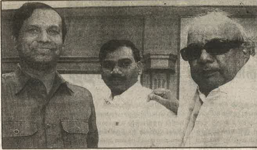
தேசிய ஜனநாயகக் கூட்டணி மற்றும் அரசியல் இருந்து தி.மு.க. விலகும் முடிவை அறிவிக்கும் கருணாநிதி; (உடனிருப்பவர்கள்) தி.மு.க.வின் மைய அமைச்சர்கள் டி.ஆர். பாலு (இடது) மற்றும் ஏ.ராஜா.

பிளவுவாதி, தேசத்துரோகி என்று அவதூறுப்பிரச்சாரம் செய்யப்படும். இதுதான் ஆர்.எஸ்.எஸ். - பா.ஜ.க. - ஜெயலலிதா ஆகிய பார்ப்பன - பாசிச பயங்கரவாதிகளின் உத்தியாக உள்ளது. ஏனென்றால், பயங்கரவாத - பிளவுவாதப் பீதியூட்டி, அரசியல் எதிரிகள் மீது தேசத்துரோகிகள்