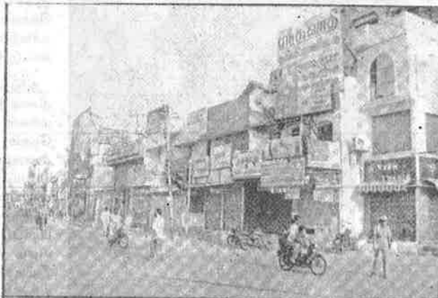
நூல் விலையேற்றத்தைக் கண்டித்தும், நூல் ஏற்றுமதியை நிறுத்தக் கோரியும் திருப்பூர் நகரில் நடந்த கலையடைப்பு போராட்டம்.

விட்டுள்ளது தமிழக அரசு. சீப்பை ஒளித்து வைத்தால், கல்யாணம் நின்று விடுமா?