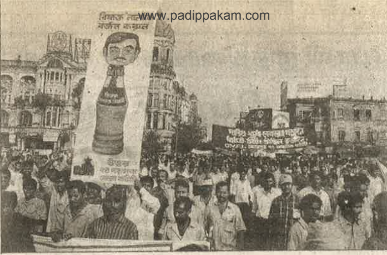
ஊர்வலத் தடை உத்தரவை எதிர்த்து, இடதுசாரிக் கூட்டணிக் கட்சிகளின் இளைஞர் அமைப்புகள் கொல்கத்தா நகரில் நடத்திய கண்டன ஊர்வலம்: பாசிச எதிர்ப்பு பம்மத்து.

ஆளும் கும்பலும் ஆட்சியாளர் களும் தமது நோக்கங்களை ஈடேற்றிக் கொள்ள மக்களை வதைத்தாலும் அவையெல்லாம் நாட்டு நலனுக்கா னது என்று கதைப்பதும், ஒடுக்கப்பட்ட மக்கள் ஊர்வலமோ - போராட்டமோ நடத்தினால், "ஐயோ இயல்பு வாழ்க்கைக்கு இடையூறு!" என்று ஒப்பாரி வைத்துத் தடைவிதிப்பதும் ஜனநாயகமா? இல்லை; இதுதான் பாசிசம்! ஒரு பிரிவு உழைக்கும் மக்கள் தமது கோரிக்கைகளை வலியுறுத்தி ஊர்வலம் நடத்தும்போது, இதர பிரிவி னருக்கு தற்காலிகமாக இடையூறு