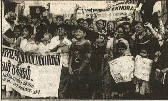
சென்னை - கோடம்பாக்கம் அருகேயுள்ள புலியூர் வீட்டுவசதி வாரிய குடியிருப்பு அருகே அமையவுள்ள அரசு மதுபானக் கடைசையைத் திறக்கக் கூடாது எனக் கோரி ஆர்ப்பாட்டம் நடத்தும் பகுதி மக்கள்.

சட்டப்பூர்வமான எல்லா உதவிகளையும் சேர்த்தாலே தமிழக அரசின் ஆண்டு வரவு செலவு, பட்ஜெட் 25,000 கோடி ரூபாய்தான். போலீசு, சிறை, நீதிமன்றம், சட்டமன்றம் என்று தனது பதாதிகள் செலவு போக, 7 கோடி மக்களுக்கும் இதில் செலவு செய்வதாகச் சொல்கிறது, அரசு. ஆனால், கையளவான தனது கும்பலின் தேவைக்காக, மணல்,