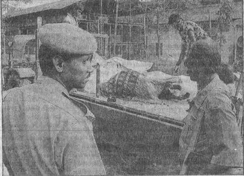
உயிரோடு எரிக்கப்பட்ட சி.ஐ.டி.யு. தலைவனின் குடும்பத்தினர்: தொழிற்சங்க ரவுடித்தனத்தின் எதிர்விளைவு.

கடந்த நவம்பர் 12-ஆம் தேதியன்று 24 பர்கானா மாவட்டத்திலுள்ள கன்சர்ப்பா எனும் கிராமத்தில், மீன் ஏலம் -