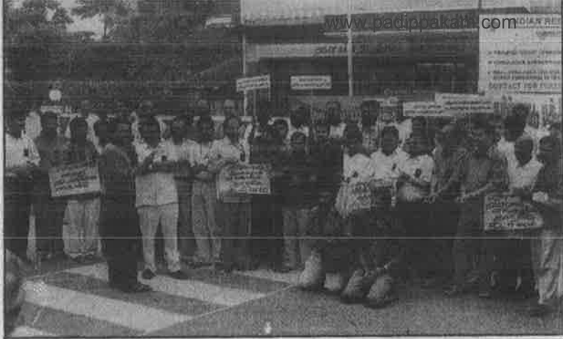
பத்திரிகையாளர்கள், தங்களின் கைகளை கயிறால் கட்டிக் கொண்டு, வாயைக் கருப்புத் துணியால் மூடிக் கொண்டு, கோயம்புத்தூரில் ஜெயாவை எதிர்த்து நடத்திய "அறப்போராட்டம்": குட்டக் குட்ட குனியலாமா?

"இந்து" ஏட்டின் முதன்மை ஆசிரியரோ கட்டுச் சோற்றுக்குள் பெருச்சாளியை வைத்துக் கட்டுவதுபோல ஜெயலலிதாவின் பாசிச குரு "சோ"வோடு சேர்ந்து வீரசவடால் அடித்தார். குளு குளு மானிகை, கார் என்று சொசூசாக வசதியாக வாழ்ந்து பழகிய "இந்து" குடும்பத்தைச் சேர்ந்தவர்கள் சிறைக்கு அஞ்சி நடுநடுங்கி தலைமறைவு நாடகமாடினர். ஜெயலலிதா கும்பலைத் தவிர அதிகாரத்திலிருக்கும் மேல் மட்டத் தொடர்புகளைப் பயன்படுத்தி, இந்த ஒடுக்குமுறையில் இருந்து தப்பித்துக் கொள்ளும் இரகசிய முயற்சிகளில் ஈடுபட்டனர். இதற்காக வாஜ்பாய் - அத்வானி கும்பலிடம் மனுப்போட்டு மன்றாடினர்.