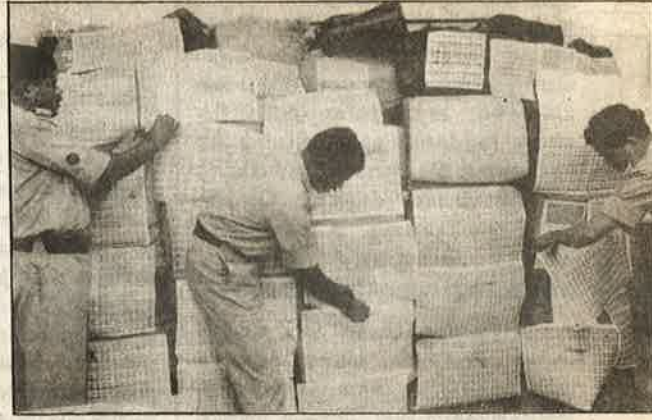
பெங்களூரில் கைப்பற்றப்பட்ட 170 கோடி ரூபாய் பெறுமான போலி நீதிமன்ற முத்திரை வில்லைகள்.