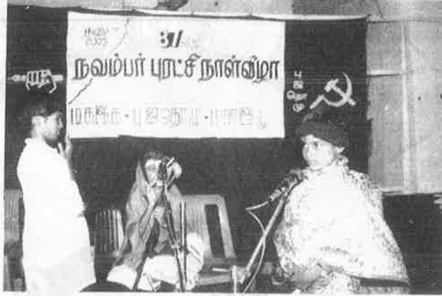
ஜெயா - சங்கராச்சாரி கூட்டணியை நையாண்டி செய்து சென்னையில் சிறுவர்கள் நடத்திய “கோமளவல்லி” நாடகத்தில் ஒரு காட்சி.

★ சென்னையில் ம.க.இ.க., பு.ஜ.தொ.மு., பு.மா.இ.மு. சார்பில் நவம்பர் புரட்சிநாள் புதிய பண்டாட்டு நாளாக மக்களிடம் அறிமுகப்படுத்தப்பட்டது.