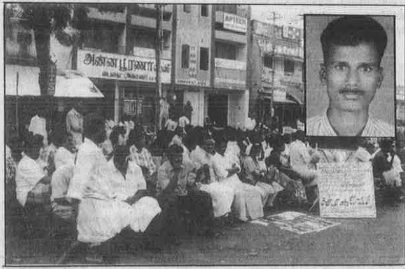
மேல்சாதி ஆதிக்கவெறிக்குத் தாளம் போட்ட போலீசைக் கண்டித்து நடந்த ஆர்ப்பாட்டம். (உள்படம்) மேல்சாதி வெறியனால் தாக்கப்பட்ட சின்னதம்பி.