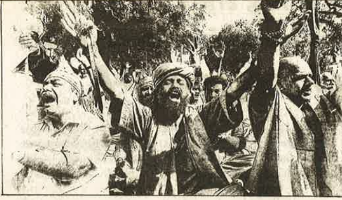
“நீதிமன்றத்திற்கும் சட்டத்திற்கும் கட்டுப்பட மாட்டோம்; அயோத்தியில் ராமன் கோயில் கட்டியே தீருவோம்!”

- நாடாளுமன்றத்தை முற்றுகையிட்டு எச்சரிக்கும் கஞ்சா சாமியார்கள்.