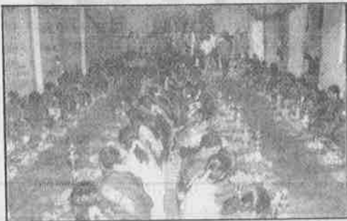
சேலத்தில் நடத்தப்பட்ட விளக்கு பூஜை: பார்ப்பன - ஜெயா ஆட்சியின் கொட்டம்.

வசிக்கும் அப்பஞ்சாயத்து முழுவதும் திரைப்படங்கள், தொலைக்காட்சிகள் பார்ப்பதும் பாடல் ஒலிப்பேழை, குறுந்தகடுகளைக் கேட்பதும் தடை செய்யப்பட்டுள்ளதோடு, மீறினால் தொலைக்காட்சிகளை அடித்து நொறுக்கவும் உத்தரவிட்டுள்ளது. இதைக் கண்காணிக்க ஒரு குழுவை உருவாக்கி இரவு பகலாக காவலிலும் வைத்துள்ளது. அப்பகுதியில் ஏற்கனவே பயன்படுத்தி வந்த தொலைக்காட்சி, வானொலி பெட்டிகளை அதன் உரிமையாளர்கள் பஞ்சாயத்தாரிடம் ஒப்படைத்து விற்கச் சொல்லிவிட்டனர். இந்நடவடிக்கையை தாலிபான் ஆட்சியாளர்களைப் போலவே, "வரும் தலைமுறையைப் பண்பாட்டுச் சீரழிவினிருந்து காப்பாற்றுவோம்" என்று நியாயப்படுத்துகிறது 'பத்வா'.