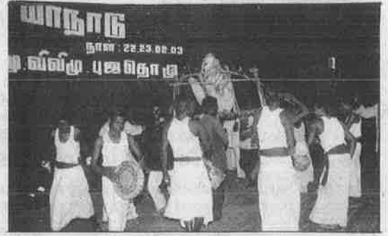
பார்ப்பன பயங்கரவாதத்திற்கு பாடைகட்டி, சங்கு ஊதி, சாப்பறை அடித்து....

மேலும், சக்கிலியப் பெண்ணை மணப்பதற்காக, பார்ப்பனச் சாதியைத்