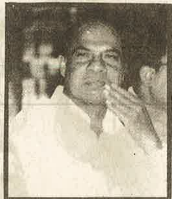
பகற்கொள்ளைக்கு உரிமை கோரும் 'கல்வி வள்ளல்' ஜேப்பியார்.

அடுத்து, சுயநிதிக் கல்லூரிகளின் சேர்க்கை அரசுக் கல்லூரிகளின் சேர்க்கையைவிட ஒரு மாதம் முன்பே முடிக்க