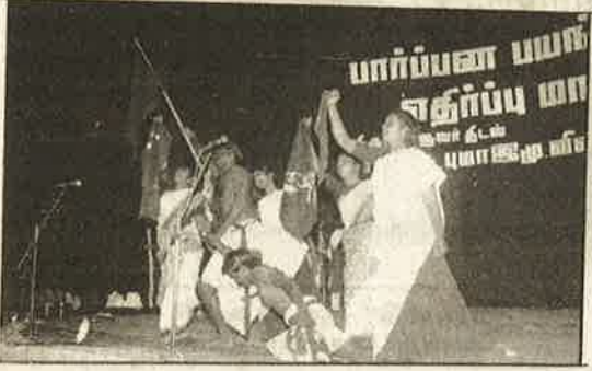
வெல்லப்போவது யார்? இந்துத்துவமா? நக்சல்பாரியா? - ம.க.இ.க.வின் புரட்சிகர கலைநிகழ்ச்சி.

கான உள்ளூர் மக்களையும் தன்பால் ஈர்க்கவும் செய்தன.