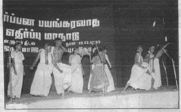
"அடிமாடு" - நாடகக் காட்சி; "கோமாதா" மோசடிக்கு பதிலடி.

அமைப்பு குஜராத் இனப் படுகொலை பற்றி விசாரணை நடத்தி வெளியிட்டுள்ள "மனிதத்துவத்திற்கு எதிரான குற்றம்" (Crime Against Humanity) என்ற ஆவணமும் மாநாட்டில் அறிமுகப்படுத்தப்பட்டன. கீழைக்காற்று, பக்தசிங் புத்தகப் பயணம், நியூ செஞ்சுரி புக் ஹவுஸ் உள்ளிட்ட பல்வேறு புத்தக வெளியீட்டாளர்கள் மாநாட்டு அரங்கில், கடைகளைத் திறந்திருந்தனர்.