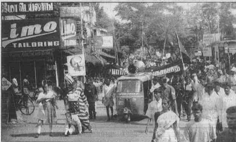
பார்ப்பன பயங்கரவாதத்தை வீழ்த்த அணிதிரண்ட மாநாட்டுப் பேரணி.

கடந்த ஒன்பது ஆண்டுகளாக தமிழ் மக்கள் இசை விழாவை நடத்தி வருகிறோம். அவற்றின் தொடர்ச்சியாகவே, இம்மாநாட்டைக் காண வேண்டும்” எனக் கூறினார்.