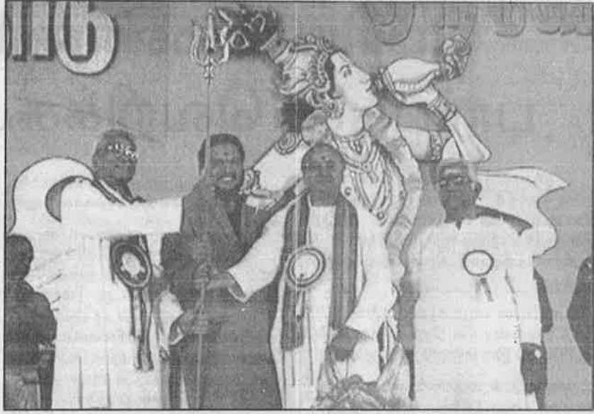
மதச்சார்பற்ற ஜனநாயகச் சக்திகளை ஒழிக்க தொகாடியாவுக்கு வழங்கப்படும் குலாயுதம்: பார்ப்பனப் பேய்களின் சதிராட்டம்.

பார்ப்பன பயங்கரவாதிகள் ஏதோ குருட்டாம் போக்கில், கும்பல் கூட்டி கைத்தட்டலுக்காக கத்திவிட்டு கலைந்து போகிறார்கள் என்பதில்லை. தங்களுடைய சித்தாந்த, அரசியல், அமைப்பு நடவடிக்கைகளுக்கு பருண்மையான வடிவம் கொடுத்திருக்கிறார்கள். இதை குஜராத் சோதனைக் கூட்டத்தில் வெற்றிகரமாக சாதித்திருக்கிறார்கள்.