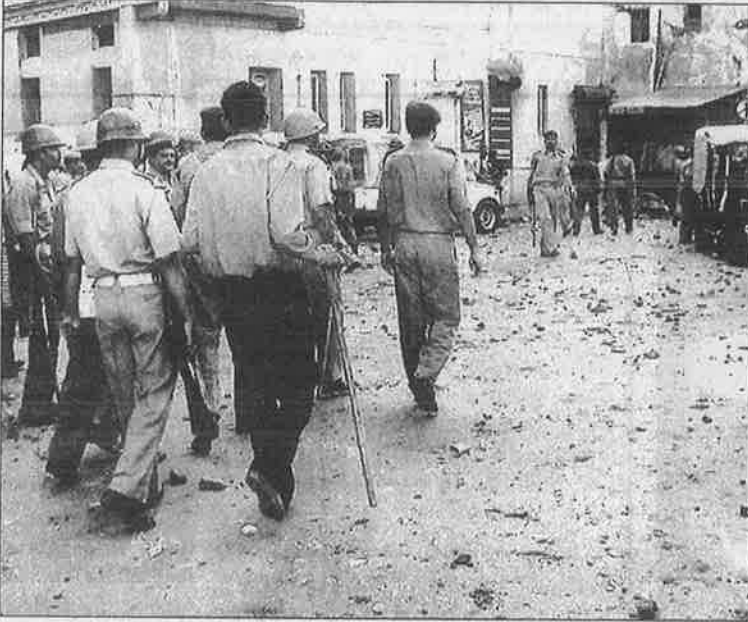
வெற்றியைக் கொண்டாடும் முசுலீம், அகமதாபாத்தில் முசுலீம்கள் வாழும் தரியாப்பூர் பகுதியில் இந்து வெறியர்கள் நடத்திய கலவரத்திற்குப் பின், துணை இராணுவத்தின் ரோந்து.

இந்து மதவெறியர்களிலேயே, அமிலத்தை உமிழக்கூடிய விகவ இந்து பரிசுத்தின் பொதுச் செயலாளர் பிரவீன் தொகாடியா திமிரின் உச்சியில் நின்று கொண்டு வெறிக் கூச்சல் போடுகிறார்: "குஜராத் பரிசோதனையை நாடு முழுவதும் மேற்கொள்வோம். ராஜஸ்தான், சட்டீஸ்கர், ம.பி., தேர்தல்கள் மூலமாக தில்லியிலும் இதையே சாதிப்போம். இன்னும் இரண்டு ஆண்டுகளில் நாடே இந்துவாகும். பாகிஸ்தானையும் கூறு போடுவோம்" என்று கொக்கரிக்கிறார். "இந்துத்துவாவை ஏற்காதவர்கள் தேசத்துரோகிகள்" என்பதில் இருந்து "இந்துத்துவாவின் எதிரிகளுக்கு மரணதண்டனை விதிப்போம்" என்று பாசிச வெறிபிடித்தவனாகப் பேசுகிறார் தொகாடியா.