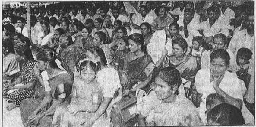
அரசு பேருந்துகளைத் தனியார்மயமாக்கக் கூடாது எனக் கோரி அரசு போக்குவரத்துத் துறை தொழிலாளர் குடும்பங்களும் (மேல்படம்) வேலை நீக்கம் செய்யப்பட்ட சாலைப் பணியாளர்களுக்கு மீண்டும் வேலை தரக்கோரி அத்தொழிலாளர்களது குடும்பங்களும் நடத்திய உண்ணாவிரதப் போராட்டங்கள். இத்தகைய போராட்டங்களுக்கு ஜெயலலிதா மசிவாரா?

ரிக்காவிலேயே திவாலாகிப்போனது. ஆனால், இங்குள்ள சிக்கல் - நெருக்கடி குறையவே இல்லை.