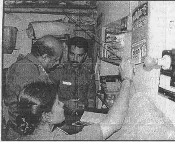
பயங்கரவாதப் பீதியூட்டுவதற்காகவே, கைது செய்யப்பட்ட பெண் தோழர் ஒருவரின் வீட்டில் போலீசு நடத்திய சோதனை.

தருமபுரி மாவட்டப் பகுதியில் இந்த வகையான நாட்டுத் துப்பாக்கிகள் ஆயிரக்கணக்கில் புழக்கத்தில் இருப்பது ஊரறிந்த உண்மை. ஆனால், போலீசோ இதை முடி மறைத்து விட்டு, தேடுதல் வேட்டையின் பொழுது ஆயுதக் கிடங்கையே கைப்பற்றி விட்டதைப் போலப் புளுகிக் கொண்டு திரிகின்றனர். கைது செய்யப்பட்ட தோழர்களின் வீடுகளில் நடத்தப்பட்ட சோதனையின் பொழுதும், தோழர்களின் கல்விச் சான்றிதழ்கள், குறிப்பேடுகள், சில துண்டுக் காகிதங்களைத்தான் போலீசு பொறுக்கி எடுத்துக் கொண்டு போய் இருக்கிறது.