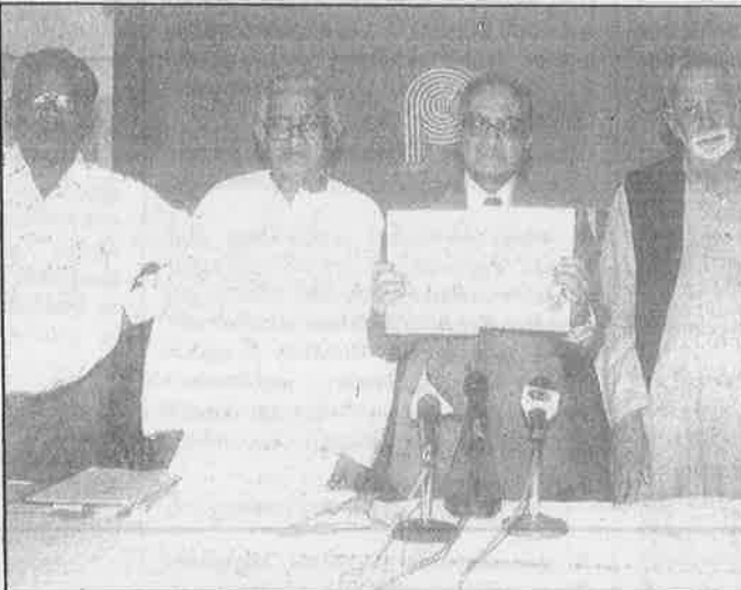
குஜராத்தில் நடந்த இனப்படுகொலையின் பிரதான குற்றவாளிகள் இந்துவெறி ஆட்சியாளர்கள்தாம்! விசாரணைத் தீர்ப்பு அறிக்கையை வெளியிடும் குடிமக்கள் தீர்ப்பாயக் குழுவினர்.