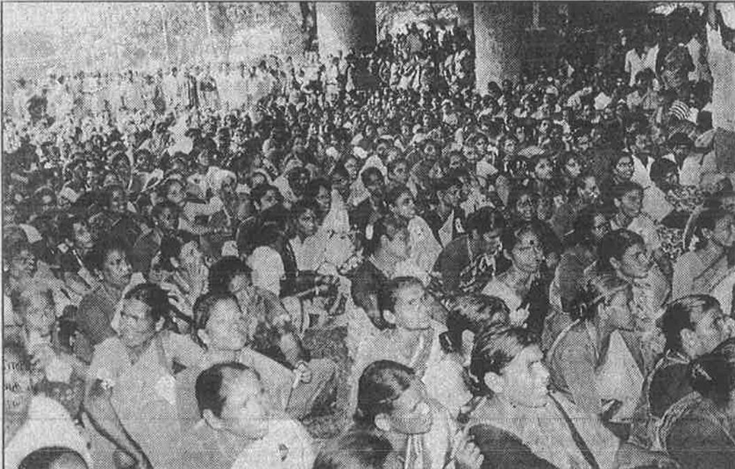
சென்னை மாநகராட்சி துப்புரவுப் பணிகளைத் தனியாரிடம் அளிப்பதைக் கண்டித்து நடந்த ஆர்ப்பாட்டம்.

உலக வங்கி கைக்கூலி ஜெயா அரசுக்கும் ஒட்டுக் கட்சி துரோகிகளுக்கும் எதிராக உழைக்கும் மக்கள் ஒரணியில் திரண்டு போராட வேண்டியதே இன்று அவசியமாக உள்ளது.