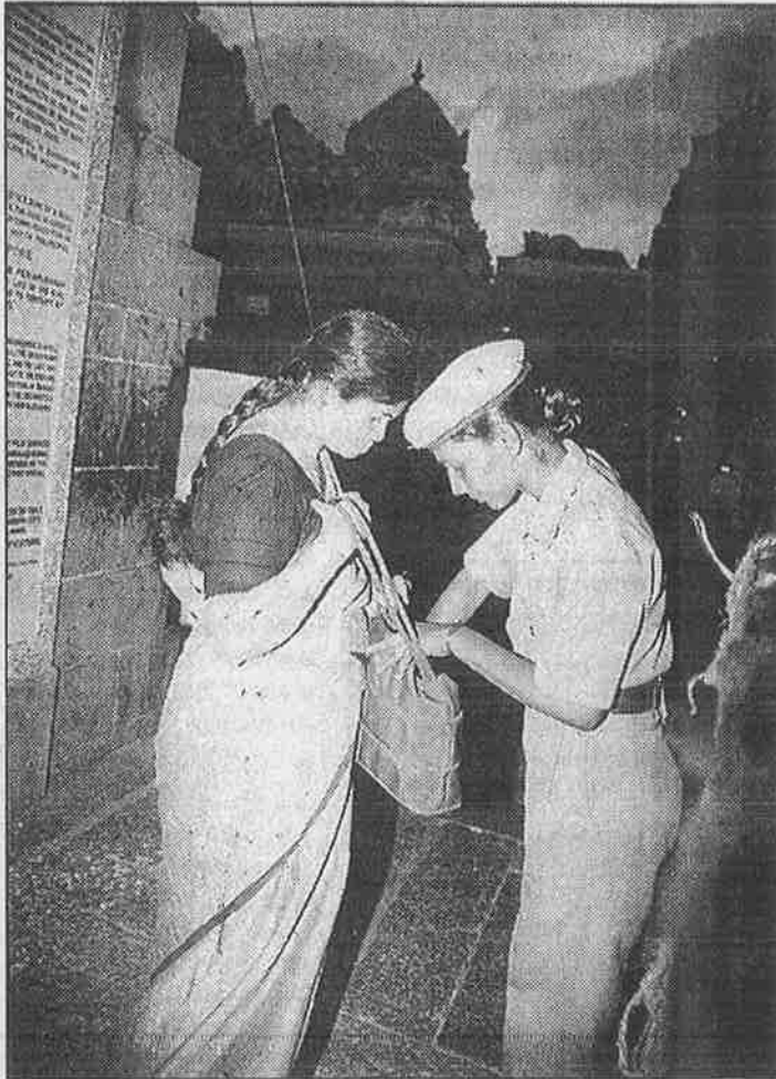
டிசம்பர் 6: தமிழகக் கோவில்களில் பக்தர்களுக்கு ஏற்பட்ட சோதனை

பொழுது, பிடிபட்ட இந்தத் தீவிரவாதிகள், தங்களின் ஒரு கையில் ஏ-கே 47 துப்பாக்கியோடும், இன்னொரு கையில் வெடிகுண்டோடும் பதுங்கி இருந்திருப்பார்களோ என நினைக்கத் தோன்றும். ஆனால் இத்தீவிரவாதிகளைப் பிடித்த பின்பு, இவர்களின் செயல்பாடு பற்றி போலீசு தரும் 'ஆதாரங்களே', இந்த பரபரப்பூட்டலுக்கு நேர் எதிரானதாக இருக்கிறது.