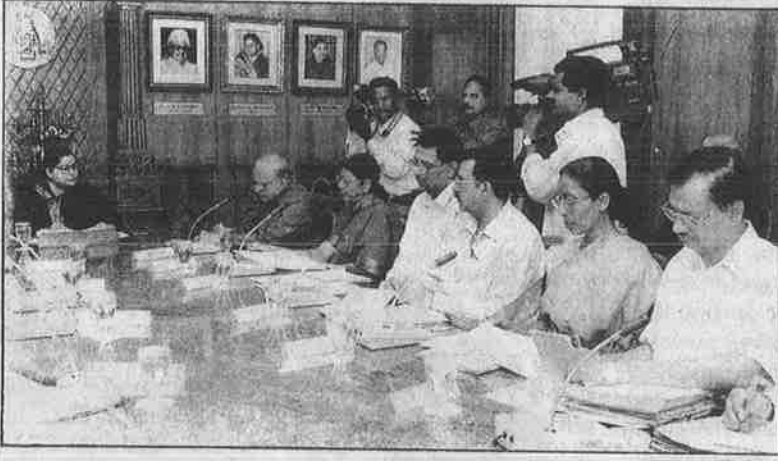
விவசாயிகளுக்கு இலவச மின்சாரத்தை ரத்து செய்த ஜெயா, முதலாளிகளுக்குத் தரிக் நிலங்களைப் பட்டா போட்டுக் கொடுக்க அதிகாரிகளோடு நடத்தும் ஆலோசனை.

வதில் உள்ள குறைபாடுகள் காரணமாகவும், 30 சதவீதம் மின் திருட்டினாலும் ஆண்டுக்கு 200 கோடி ரூபாய் இழப்பு ஏற்படுகிறது.