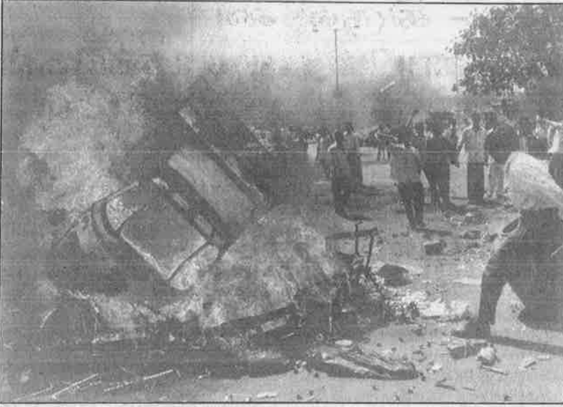
பற்றி எரியும் இந்துவெறி பயங்கரவாதத் தீ: குற்றவாளிகளுக்கு என்ன தண்டனை?

தன்மையின் மூலம், மைய அரசின் இந்துத்துவ கொள்கைகளையே அவர் பிரதிபலித்தார்.