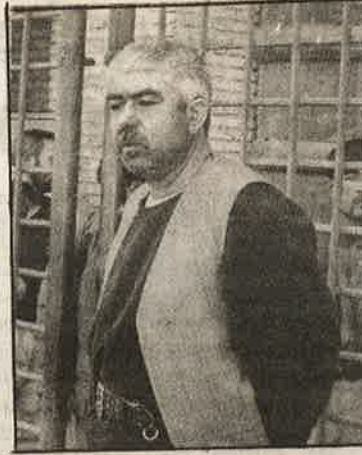
யுத்தப் பிரபு தோஸ்தம்; அமெரிக்காவின் புதிய கொலைகாரக் கைக்கூலி.

“பெட்டகத்தில் ஆடு-மாடுகளைப் போல போர்க் கைதிகள் அடைக்கப்பட்டு