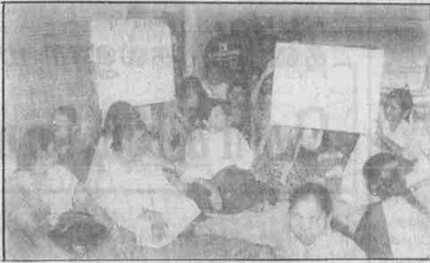
இந்திய பார்மலி கவுன்சிலின் அங்கீகாரம் பெறாமல், மோசடிக் தனமான முறையில் நடத்தப்படும் சென்னையில் உள்ள கே.கே. பார்மலி கல்லூரி நிர்வாகத்தை அம்பலப்படுத்தி, ஏமாற்றப்பட்ட அக்கல்லூரி மாணவிகள் நடத்திய ஆர்ப்பாட்டம்.

இந்தக் கல்லூரிகளுக்கு இந்திய பார்மலி கவுன்சிலின் அங்கீகாரம் இல்லை என்று தெரிந்த பின்னரும், எம்.ஜி.ஆர். மருத்துவப் பல்கலைக் கழகம் இக்கல்லூரிகளுக்கு இணைப்பு வழங்கியிருக்கிறது. மருத்துவத்துறையின் கீழ் இயங்கும் மருத்துவப் படிப்புத் தேர்வுக் கமிட்டியும், ஒவ்வொரு ஆண்டும் மாணவர்களைத் தேர்வு செய்து இம்மோசடிக் கல்லூரிகளுக்கு அனுப்பி வைத்திருக்கிறது. இந்த மோசடிக் கல்லூரிகள் அனைத்தும் மருத்துவப் பல்கலைக் கழகத்தின் இணைப்பையும், மருத்துவப்