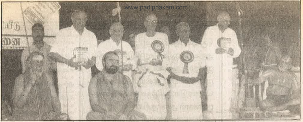
“ஆண்டவனுக்கு மேல் அந்தணர்கள்” என்று பிரகடனப்படுத்தும் பார்ப்பனச் சாதி விழா.

செய்தார். சங்கராச்சாரிகளுக்குள் தீண்டத் தகாதவனாகக் கருதப்படும் காஞ்சி மடாதிபதி, தமிழ்நாட்டில் பார்ப்பனிய ஆதிக்கத்தை வலுவாக நிலைநாட்டுவதன் மூலம் அந்தக் கரையை அழிக்க முயலுகிறார்.