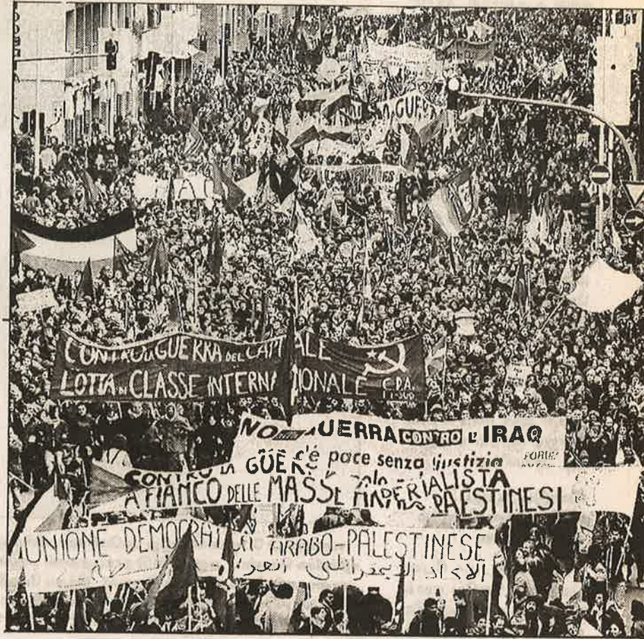
ஈராக் மீது மீண்டும் மிகப் பெரிய போரை நடத்தத் துடிக்கும் அமெரிக்காவின் மேலாதிக்க போர்வெறியை எதிர்த்து, இத்தாலி நாட்டின் ஃபுலோரன்சு நகரில் நடந்த பிரம்மாண்டமான ஆர்ப்பாட்டம். இதில் நான்கு இலட்சம் மக்கள், ஐரோப்பாவின் பல்வேறு நாடுகளில் இருந்து வந்து கலந்து கொண்டனர்.

இந்த எதிர்ப்புகளால், ஈராக் மீது உடனடியாக, தன்னிச்சையாகத் தாக்குதல் தொடுக்கும் தனது திட்டத்தை ஒத்திப்போட்ட அமெரிக்கா, ஐ.நா.வின் பாதுகாப்பு கவுன்சில், ஈராக் மீது கடுமையான மற்ொரு தீர்மானம் நிறைவேற்ற வேண்டும் எனக் கோரியது. "ஐ.நா.வில் ஏற்கனவே ஈராக் மீது 16 தீர்மானங்கள் நிறைவேற்றப்பட்டுள்ள நிலையில், புதிதாகத் தீர்மானம் தேவையில்லை" என பிரான்சும், ரசியாவும் எதிர்த்தன. எனினும், இறுதியாக, அமெரிக்காவின் நிர்பந்தத்துக்கும் மிரட்டலுக்கும் பாதுகாப்பு கவுன்சிலின் அனைத்து உறுப்பு நாடுகளும் அடிபணிந்து, ஒருமனதாக, ஈராக் மீதான புதிய தீர்மானத்தை நிறைவேற்றி