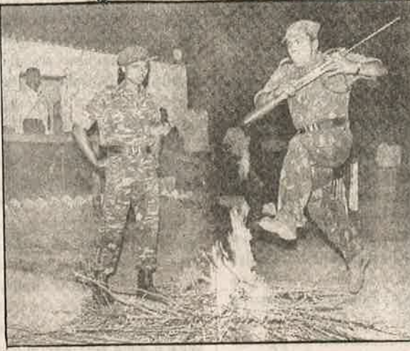
படந்துவரும் பாசிசப் பேரபாயம்: பகிரங்கமாக நடத்தப்பட்ட அதிரடிப்படைய் பயிற்சி முகாமில் பயிற்சிபெறும் சிவசேனா குண்டர்கள்.