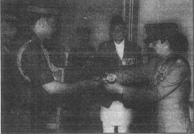
இந்திய இராணுவத் தளபதி பத்மநாபனின் பயங்கரவாத சேவையைப் பாராட்டி வீரவான் பரிசளித்து கௌரவிக்கும் நேபாள மன்னர்.

இந்நெருக்கடிகளிலிருந்து நேபாளத்தை மீட்க மாவோயிஸ்டுகள் மாற்று அரசியல் - பொருளாதாரத் திட்டத்தை முன் வைத்துள்ள போதிலும், அதற்கான பிரச்சாரம், கிளர்ச்சிகளை முன்னெடுத்துச் செல்வதில் இன்னமும் பலவீனமான நிலையிலேயே உள்ளனர். கட்சியின் முழுக்கங்களை தமது சொந்த முழுக்கங்களாக பரந்து பட்ட மக்கள் அனுபவரீதியாக உணர்ந்து ஏற்றுக் கொண்டு போராடுவதற்கு, அவர்களை அரசியல் ரீதியாகப் பயிற்றுவிப்ப