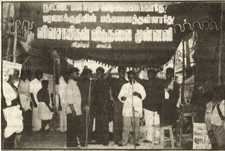
திருவெண்ணெய் நல்லூரில் நடந்த தொடர் முழக்க ஆர்ப்பாட்டம்.

இயக்கத்தை நடத்தியது. துண்டுப் பிரசாரம், சுவரொட்டிகள், தட்டிகள், தெருமுனைக் கூட்டங்கள், மிதிவண்டி ஊர்வலம் முதலான வடிவில் நடந்த இப்பிரச்சார இயக்கத்தின் இறுதியில், மதுரை மாவட்டம் - திருமங்கலம் மற்றும் உசிலம்பட்டியிலும், தேனி மாவட்டம் - கடலூர் மற்றும் கே.கே. பட்டியிலும், விழுப்புரம் மாவட்டம் - திருவெண்ணெய் நல்லூரிலும் 15.7.02 அன்று எழுச்சியிரு தொடர்முழக்க ஆர்ப்பாட்டங்கள் நடைபெற்றன.