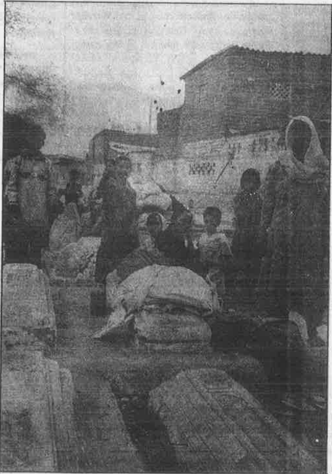
அகமதாபாத்தில் இடுகாட்டில் இயங்கி வரும் ஷா-ஆலம் அகதி முகாம்.

பாஞ்சம்ஹால் மாவட்டத்திலுள்ள ரந்திப்புர், பரோடா மாவட்டத்திலுள்ள கிசான்வாடி உள்ளிட்ட பலவெறு பகுதிகளில் நடந்த அமைதிக் கூட்டங்களில், "முசுலீம்கள் இந்து மதவெறிக் குண்டர்கள் மீது கொடுத் துள்ள புகார்களைத் திரும்பப் பெறாவிடில், கிராமத்திற்குள் நுழைய முடியாது" என மிரட் டப்பட்டுள்ளனர்.