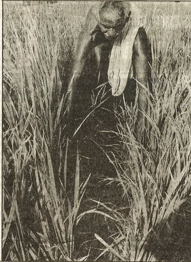
காவிரியில் தண்ணீர் வராததால் தனது நிலம் பாளம் பாளமாக வெடித்துக் கிடப்பதைக் காட்டும் பண்டாரவாடை கிராம விவசாயி; தரிசு நில மேம்பாடு திட்டத்தின் அடுத்த குறி இவரைப் போன்ற சிறு விவசாயிகள்

ஒரு திராட்சைப் பழம் 10 கிராம் எடை இருக்க வேண்டும். பழக்கொத்தின் காம்ப் 15 செ.மீ நீளமிருக்க வேண்டும். அமெரிக்கர்களுக்குப் புளிப்பு கலந்த இனிப்புதான் பிடிக்கும். காய்கறிகளில் இரசாயன உரம் - மருந்து அளவு குறிப்பிட்ட அளவுதான் இருக்க வேண்டும்” என பல தரக் கட்டுப்பா