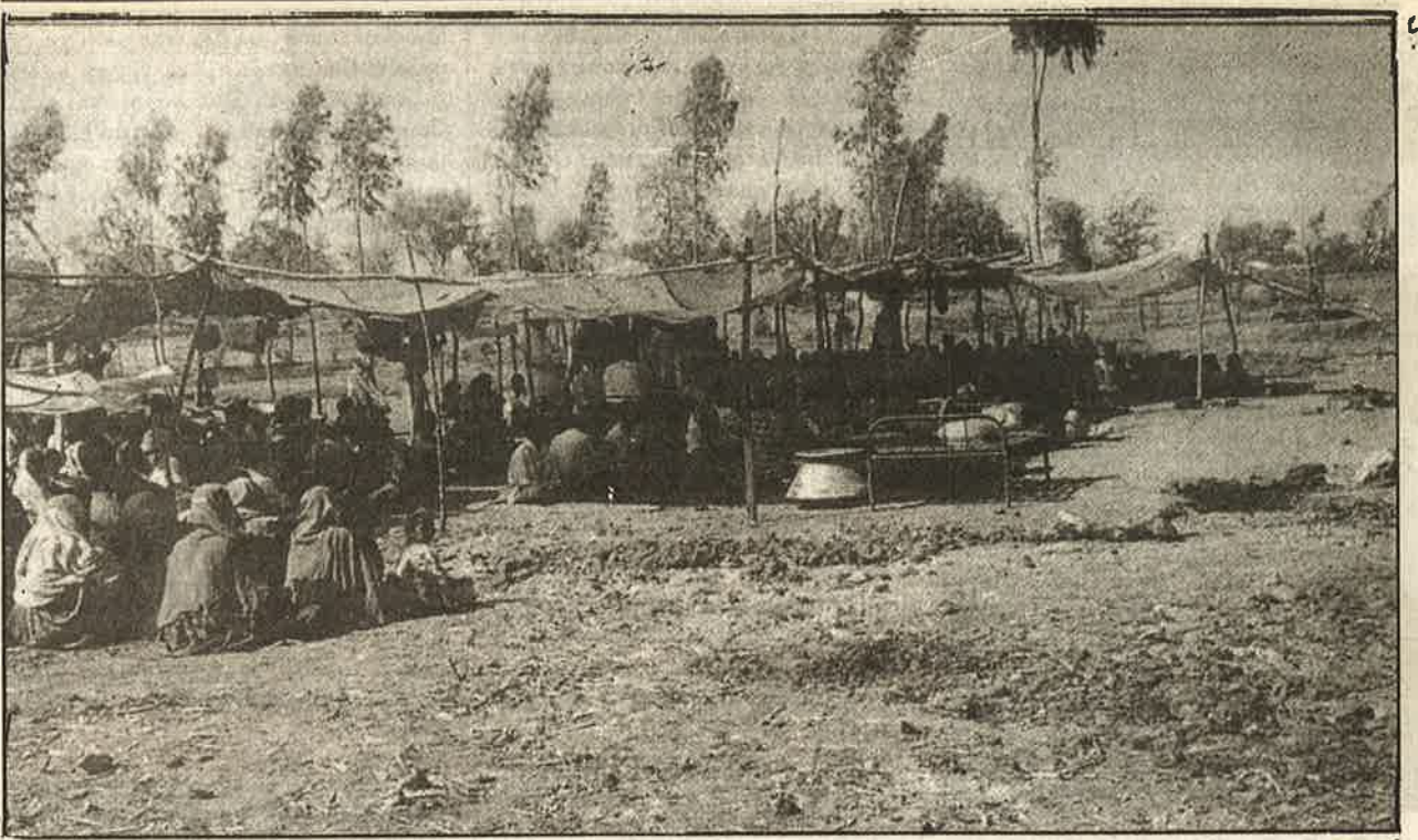
நேபாளியா கிராமத்தில் எவ்வித வசதிகளும் இன்றி வெட்ட வெளியில் இயங்கும் அகதி முகாம்.