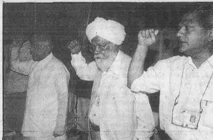
ஐதராபாத் மாநாட்டில் ஜோதிபாக, சுர்ஜித், யெச்சூரி: “காங்கிரசை ஆட்சிபிடம் ஏற்றியே தீருவோம்” என்று சபதமெடுக்கின்றனரா?

இந்தப் பிராந்தியத்தில் அமைப்பை விரிவுபடுத்துவது மற்றும் உறுதிப்படுத்துவதற்கான முக்கியத்துவத்தை மிகவும் தூக்கலாக வைத்தது. ஆனால், பிரச்சினை இன்னமும் நீடிக்கிறது; இந்தப் பிராந்தியத்தில் ஒரு திருப்பு முனையை ஏற்படுத்த இயலாதவர்களாக இருக்கிறோம்.