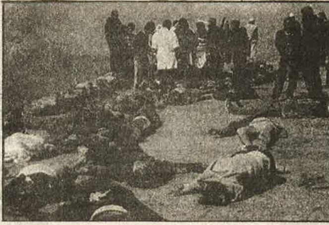
புரட்சிகர வீரசாகசம்: மாவோயிஸ்டுகளின் தாக்குதலில் பலியான அரசு பயங்கரவாதப் படையினர்.

இத்தகைய நிலைமை ஏற்படும் என்பதை உணர்ந்த மாவோயிஸ்டுகள் கடந்த ஆண்டு நவம்பரில் லகாலி இராணுவ முகாமையும், டாங் மாவட்டத் தலைமை அலுவலகத்தையும் பெருந்திரளாக வந்து தாக்கினர். இத்தாக்குதலில் உயர் இராணுவ அதிகாரிகள் உள்ளிட்டு அரசுப் படையினர் 26 பேர் பலியாகினர். அதைத்