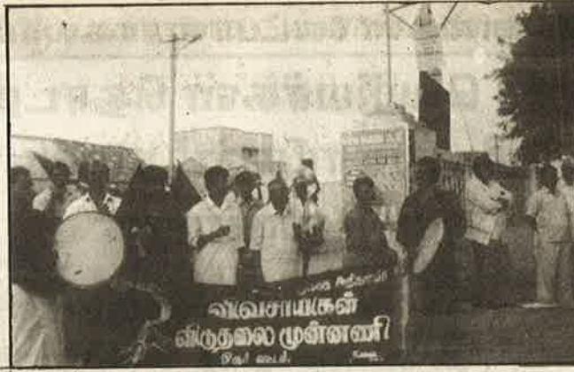
பயங்கரவாத மருத்துவர்களைத் தண்டிக்கக் கோரி ஓசூரில் நடந்த ஆர்ப்பாட்டம்.

வைப்பதைத் தடைவிதிக்கவும், தனியார் மருத்துவமனைகளில் சிகிச்சைக்கு குறைந்தபட்ச கட்டணம் நிர்ணயம் செய்யவும் கோரிய தோடு, தனியார் மருத்துவக் கொள்ளையர்களின் சொத்துக்களைப் பறிமுதல் செய்யவும், பயங்கரவாத மருத்துவர்களை வீதியில் இறங்கித் தண்டிக்கவும் உழைக்கும் மக்களை அணிதிரட்டின.