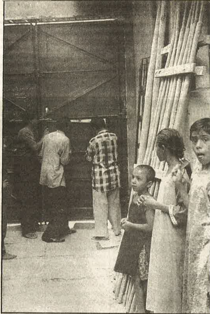
இந்து மதவெறியர்களின் தாக்குதலில் இருந்து தங்களைத் தற்காத்துக் கொள்ள தரியார்புர் பகுதி நுழைவாயிலில் இரும்புக் கதவை அமைக்கும் முசலீம்கள்.

அகதி முகாம்களில் தங்கியுள்ள 60,000-க்கு மேற்பட்ட முசலீம்கள், தங்களின் சொந்த வீட்டிற்கு / கிராமத்திற்குத் திரும்ப முடியவில்லை. பாதிக்கப்பட்ட முசலீம்களுக்கு உரிய நிவாரணம் வழங்கப்படவில்லை. முசலீம் இனப்படுகொலையை நடத்திய இந்து மதவெறி பாசிஸ்டுகள் கைது செய்யப்படவில்லை. இப்படிப்பட்ட நிலையில், "அகமதாபாத்தில் ஜெகந்நாதர் யாத்திரை 'அமைதி'யாக நடந்து முடிந்திருப்பது;