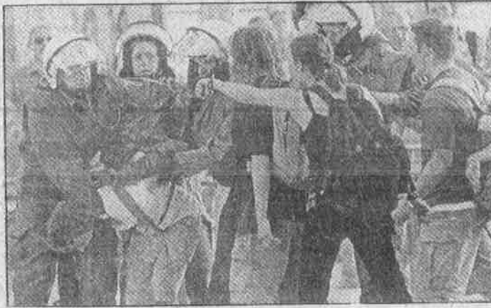
"கொலைகார புஷ்வே திரும்பிப் போ!" - பெர்லின் நகரில் போலீசுடன் மோதலாக முடிந்த புஷ் எதிர்ப்பு ஆர்ப்பாட்டம்.

மாகாண கவர்னராக இருந்த போது 152 பேருக்குத் தூக்குத் தண்டனை வழங்கிய கொடுஞ்செயலை எதிர்த்தும், இன்றும் கூட அமெரிக்காவில் ரக தூக்கு தண்டனையை ரத்து செய்யாததை எதிர்த்தும், பாரீசின் சுதந்திரதேவி சிலை முன்பாக புஷ் எதிர்ப்பு ஆர்ப்பாட்டங்கள் நடந்தன. பிரான்சின் நார்மண்டி பிராந்தியத்தில் உள்ள கேயன் நகரில் இரண்டாம் உலகப் போரில் இறந்த அமெரிக்கப் போர்வீரர்களுக்கு அஞ்சலி செலுத்த புஷ் சென்றபோது, வழி பெய்கும் தடையை மீறி மக்கள் ஆர்ப்பாட்டங்களைத் தொடர்ந்தார்கள்.