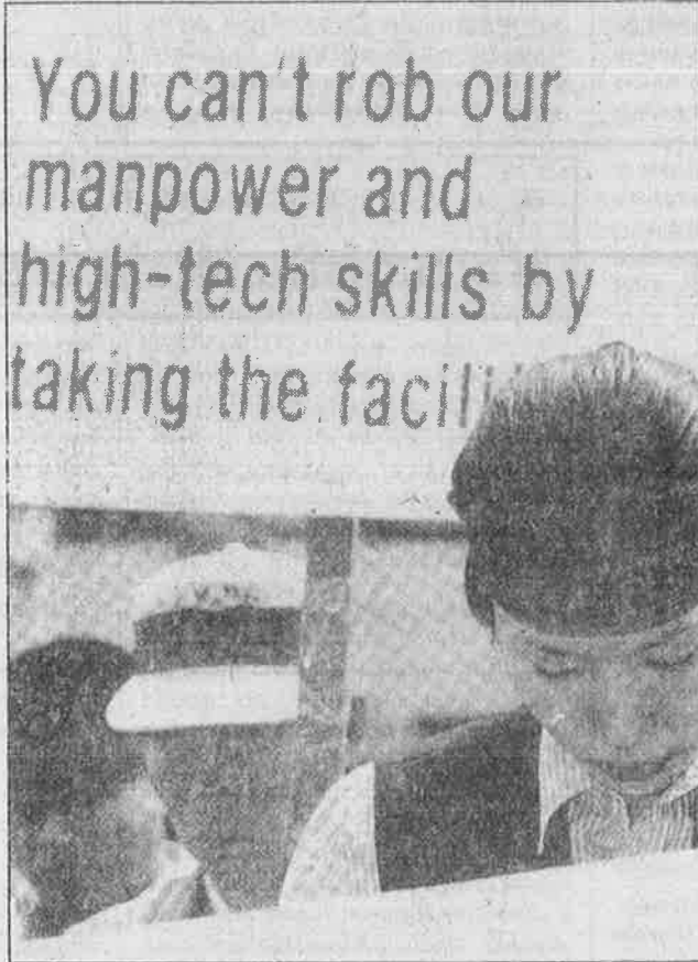
வேலையிழந்த ஜப்பானியத் தொழிலாளர்கள் ஆலை மூடலுக்கு எதிராக நடத்தும் ஆர்ப்பாட்டம்.

வங்கிகள் முட்டுக் கொடுத்துக் கொண்டிருப்பதாலேயே ஜப்பானில் பல ஏகபோகத் தொழில் நிறுவனங்கள் திவாலாகாமல் நிற்கின்றன. ஆனால் இதற்கு மேலும் முட்டுக் கொடுக்க முடியாமல் வங்கிகள் பாதாளச் சரிவிள் விளிம்பில் நிற்கின்றன. எந்த வங்கி எப்போது திவாலாகுமோ என்ற அச்சமே நாட்டைக் கவலியுள்ளது. வங்கிகளில் சாதாரண சேமிப்புகளுக்கு வட்டி கிடையாது. நீண்டகால வைப்புத் தொகைகளை முதிர்வடைந்ததும் எடுக்கவும் முடியாது. அதற்குப் பதிலாக அர்ஜெண்டினா பாணியில் அரசாங்கக் கடன் பத்திரங்களே தரப்படுகின்றன. இந்த உத்தரவாதமற்ற நிலையைக் கண்டு பீதியடைந்த ஜப்பானிய மக்கள், தமது சேமிப்புகளை வங்கியில் போடாமல், தங்கமாக மாற்றி வைத்துக் கொள்கிறார்கள்.