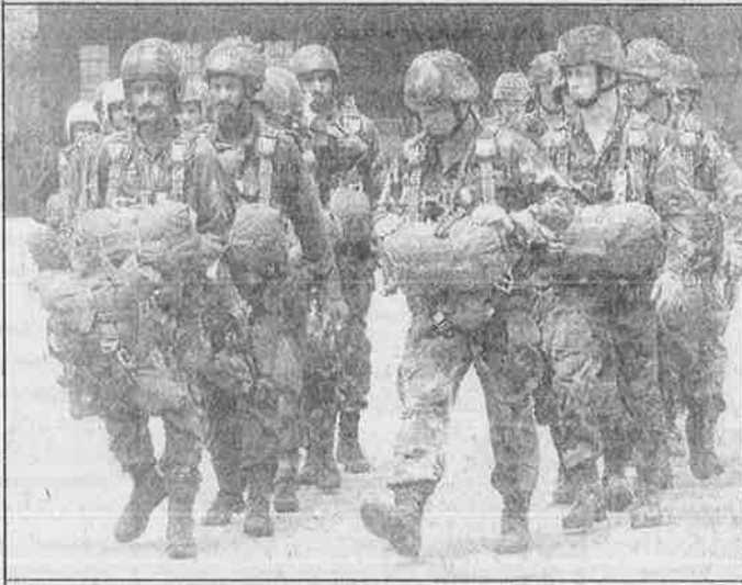
அமெரிக்க இராணுவத்துடன் சேர்ந்து இந்தியாவில் போர் பயிற்சியில் ஈடுபடும் இந்திய இராணுவம்.

பாகிஸ்தான் தனக்கு அடங்காத போக்கிரிக் குழுக்களை அடக்குவதை காகமீர் பிரச்சினையை அந்நாடு கைகழுவி வருகிறது என்பதாகப் பார்க்க முடியாது. "காகமீர் எங்களின் தேசியப் பிரச்சினை" என்று தான் முஷாரப் இன்னமும் கூறிக் கொண்டிருக்கிறார். போக்கிரி ஜிகாதிக்கு குழுக்களின் மீது முஷாரப் நடவடிக்கை எடுப்பதற்கு ஈடாக, அமெரிக்கா காகமீர் பிரச்சினையில் வெளிப்படையாகவே தலையிட்டு மத்தியஸ்தம் பண்ண வேண்டும் என்பதுதான் முஷாரப்பின் தந்திரம்.