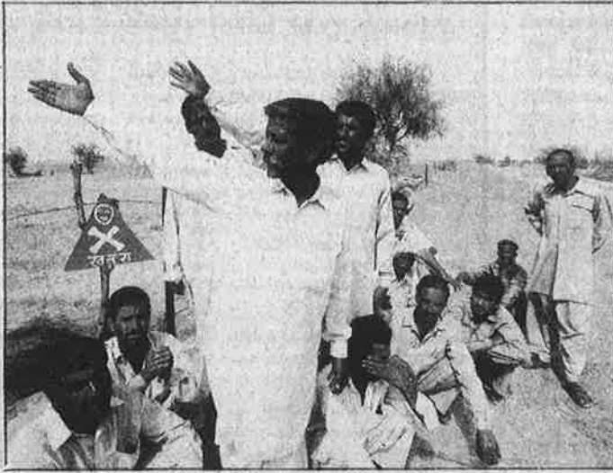
கண்ணி வெடி புதைக்கப்பட்டதால், தங்களின் நிலத்தைப் பறிகொடுத்தவிட்ட இராசஸ்தான் விவசாயிகள்.

கட்சி முடிய, முதலாளித்துவ ஓட்டுக் கட்சிகள் போட்ட போர்வெறிக் கூச்சலை, இடது - வலது போலி கம்யூனிஸ்டுகள் உள்ளிட்ட இடதுசாரிக் கட்சிகள் பாகிஸ்தானிடம் இருக்கும் அணு ஆயுதங்களைக் காட்டித் தடுத்து நிறுத்த முயன்றார்கள். இந்தப் 'பெரு முயற்சி'யையும் அக்கட்சிகள் நாடாளுமன்றத்திலும், பத்திரிகைகளிலும் தான் செய்தன; அதற்கு வெளியே இந்தப் போர்வெறிக் கூச்சலைக் கண்டித்து எந்தவொரு இயக்கமும் எடுத்ததாகத் தெரியவில்லை. இடதுசாரிகள் எடுத்துவிட்ட பாக்.கின் அணு ஆயுத பூச்சாண்டிக்கு முதலாளித்துவ ஓட்டுக் கட்சிகள் சொன்ன பதில்: "நம்மிடமும் அணு ஆயுதங்கள் உள்ளன!"