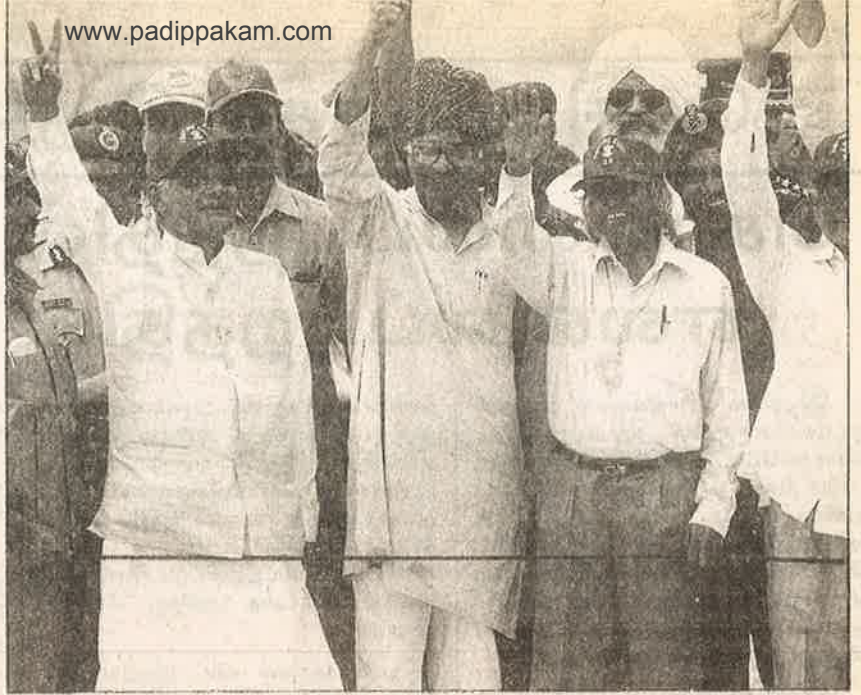
அகண்ட பாரதக் களவுடன் நடந்த பொக்ரான் குண்டு வெடிப்பு களத்தில் இந்துவெறி ஆட்சியாளர்களுடன் ஆர்.எஸ்.எஸ். விஞ்ஞானி அத்துல் கலாம்.

போலி கம்யூனிஸ்டுகள் குஜராத் இந்து வெறியாட்டம் பற்றிய லெட்சுமி செகலின் கருத்தை ஆதரிக்கும் அதேசமயம், இந்தியாவின் அணு ஆயுதப் போர்வெறிக் கொள்கை பற்றி வாய் திறக்க மறுக்கின்றனர். இந்திய அரசின் வங்கதேசப் போர், ஈழ ஆக்கிரமிப்புப் போர் உள்ளிட்டு அதன் துணை வல்லரசு - வட்டார மேலாதிக்க கொள்கையை விசுவாசமாக ஆதரித்து வந்த தமது துரோகம் அம்பலமாகி விடுமோ என்ற அச்சத்தில், அரசியல் பின்னணி எதுவுமில்லாததால் கலாமை ஆதரிக்க முடியாது என்று வேறொரு கார