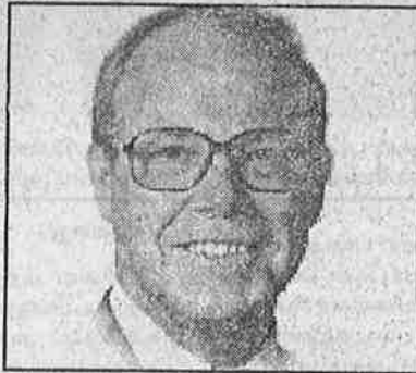
அமெரிக்காவின் அடாவடித் தளத்தால் பதவி பறிக்கப்பட்ட ஐ.நா. மன்ற தட்பவெப்ப நிலை மாற்ற அமைப்பின் தலைவர் ராபர்ட் வாட்சன் (மேல்), இரசாயன ஆயுதத் தடைக்கான அமைப்பின் தலைவர் ஜோஸ் பஸ்தானி (நடுவில்) மற்றும் ஐ.நா. தலைமை ஆயுத பரிசோதகர் ஹான்ஸ் ப்ளிக்ஸ்.

சோதகரான ஹான்ஸ் ப்ளிக்ஸ் என்பவரது நேர்மையைப் பற்றி துப்பு துலக்க தனது உளவு அமைப்புகளுக்கு அமெரிக்கா உத்தரவிட்டுள்ளது. அமெரிக்காவின் ஆயுத இருப்பை அவர் ஆராய முற்பட்டதுதான் இதற்குக் காரணம். உலகில் தட்பவெப்ப நிலை மாற்றத்தால் ஏற்படும் அழிவுகளைத் தடுக்க முயற்சிக்கும் கிபோடோ ஒப்பந்தத்தில் கையெழுத்திட மறுத்துவரும் அமெரிக்கா, கடந்த ஏப்ரலில் வியன்னாவில் நடந்த ஐ.நா.வின் அணு ஆயுதத்தை ஒப்பந்தம் குறித்த கூட்டத்தையும் புறக்கணித்து விட்டது.