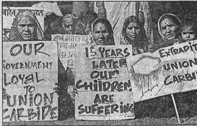
கொலைகார முதலாளிக்கு விருது வழங்கிய மக்கள் வீரோ ஆட்சியாளர்களுக்கு எதிராக போபால் மக்களின் ஆர்ப்பாட்டம்.

அதேசமயம் இத்தரகுப் பெருமுதலாளி நாட்டிற்கு அரிய சேவைகள் செய்துள்ளதாகப் பாராட்டி, வெட்கமின்றி விருது அளிக்கக்கிளம்பியுள்ளது பா.ஜ.க. அரசு. அடுத்த ஆண்டில் இத்தரகு திசைகள், கொலைகாரன் வாரன் ஆண்டர்சனுக்கு பத்ம ஸ்ரீ விருது அளித்து கௌரவித்தாலும் ஆச்சரியப்படுவதற்கில்லை.