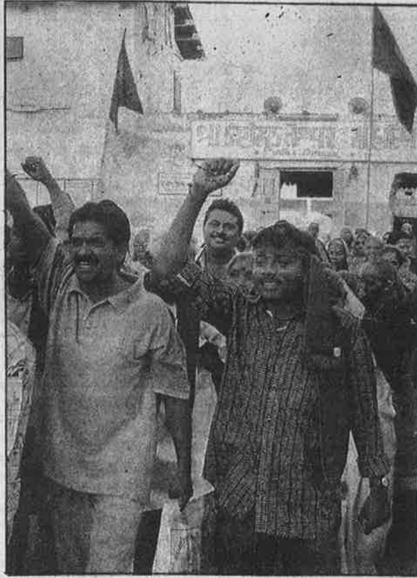
முசுலீம் எதிர்ப்பு முழக்கங்களைப் போட்டுக் கொண்டு அகமதாபாத்தில் இருந்து அயோத்திக்குச் செல்லும் வானரப் படை.

ஓட்டுக் கட்சிகள் புனிதமாக மதிக்கும் சட்டத்தின்படியே, உச்ச நீதிமன்றத் தீர்ப்பு வருவதற்கு முன்பாக, அயோத்தியில் பாபர் மசூதி வளாகத்தினுள் இராமர் கோயிலைக் கட்டும் நோக்கத்துடன் யாகம் நடத்துவதும், அதற்காக அங்கே இந்துக்களைக் கும்பலாகத் திரட்டி பலப்பீர்ட்சை நடத்துவதும் கிரிமினல் குற்றமாகும். இராம சேவகர்கள், பெரும்பான்மை மதத்தினர் என்ற திரிமின் காரணமாக, "நாங்கள் இந்தக் கிரிமினல் குற்றத்தைச் செய்யப் போகிறோம்; உன்னால் முடிந்தால் தடுத்துப் பார்" எனப் பகிரங்கமாக சவால் விட்டுத்தான் அயோத்திக்குப் போகிறார்களே தவிர, சும்மா ஊரைச் சுற்றிப் பார்த்து வரச் செல்லவில்லை. எனவே, இந்து மதவெறிக் குண்டர்கள் தலைமையில் அயோத்திக்குப் போகும் இந்த இராம சேவகர்களை அப்பாவி இந்துக்கள் எனக் கூறுவதே கடைந்தெடுத்த அயோக்கியத்தனமாகும். இப்படி அயோத்திக்குச் செல்லும் ஆயிரக்கணக்கான இராம சேவகர்களில் ஒரு 58 பேர் கோத்ராவில் முசுலீம்களால் தாக்கப்பட்டு கொல்லப்பட்டது. இந்து மதவெறியர்கள் விதைத்த வினையின் விளைவுதான். எனவே, இதனை உழைக்கும் மக்கள் கண்டிக்கவோ, இதற்காகக் கண்ணீர் வடிக் கவோ அவசியமேயில்லை.