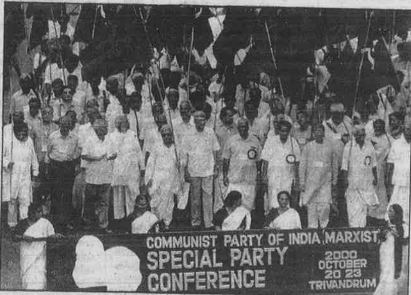
புதிய - மேம்படுத்தப்பட்ட கட்சித் திட்டத்தை வகுத்த சி.பி.எம்.-இன் திருவனந்தபுரம் சிறப்பு மாநாட்டுப் பேரணி: புரட்டல்வாதப் பாதையில் பீடுநடை.

போக எதிர்ப்பு மக்கள் ஜனநாயகப் புரட்சி"யின் இரண்டாவது கடமையாக அந்நிய ஏகபோக மூலதனத்தை வேரோடு பிடுங்கி, மொத்தமாகத் தூக்கியெறிந்து முற்றாக ஒழித்துக் கட்டுவதாக 1964 கட்சித் திட்டம் அறிவித்தது. ஆனால், அத்திட்டத்தை மேம்படுத்துவதாகக் கூறிக் கொண்டு 2000-ஆம் ஆண்டு நவம்பரில் நிறைவேற்றிய "புதிய" திட்டம், "இந்திய மற்றும் அந்நிய மூலதனத்தின் ஏகபோகத்தன்மைகளை மட்டும் அகற்றும், தெரிந்தெடுக்கப்பட்ட துறை