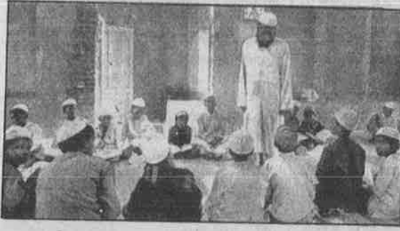
கொல்கத்தா அருகே பாங்களில் முசுலீம் ஏழைக் குழந்தைகளுக்குக் கல்வியளிக்கும் மதராசா.

நாளேடும் தவறான செய்தி வெளியிட்டுள்ளதாக 'மார்க்சிஸ்ட்' முதல்வர் வெட்கமின்றி ஒப்புக் கொள்கிறார்.