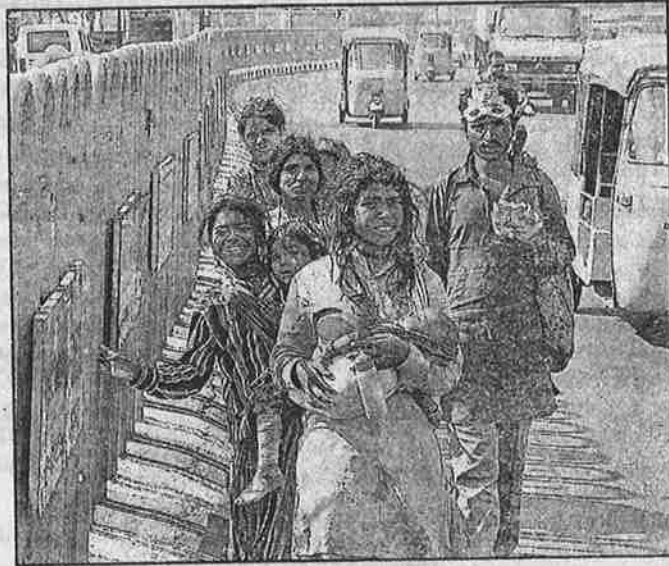
நிலநடுக்கப் பேரழிவில் வீடு-வாசல்களை இழந்து, அரசாங்கத்திடமிருந்து எவ்வித நிவாரண உதவியும் கிடைக்காமல் சென்னைக்கு வந்து பிச்சை எடுக்கும் குஜராத் மக்கள்.