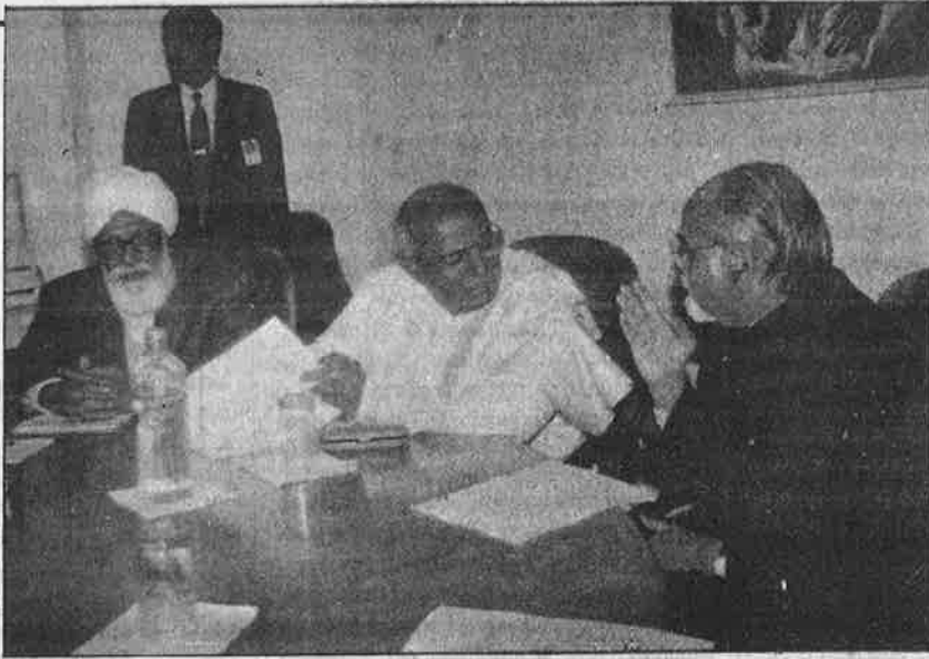
நட்டஈடு கொடுத்து நிலங்களை வாங்கி, நிலச்சீர்திருத்தம் செய்யக் கிளம்பியுள்ள சர்ஜித் குஜ்ரால், தேவேகவுடவுடன் மூன்றாவது அணியை உருவாக்கும் தரகு வேலையில்.

களில் அந்நிய நேரடி முதலீட்டை அனுமதிக்கும், அந்நிய நிதி மூலதன நுழைவை தடுக்காது நெறிப்படுத்தும்" என்று கூறுகிறது.