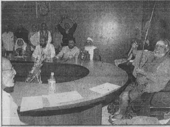
வி.இ.ப. சார்பாக முசுலீம் மதத் தலைவர்களிடம் பேரம் நடத்தும் ஜெயேந்திர சரசுவதி: சமரசத் தூதுவரானா? சதிகார வில்லனானா?

துரோகம் ஒருபுறமிருக்கட்டும்; நீதிமன்றம் அயோத்தி பிரச்சினையில் இந்து மதவெறியர்களுக்குச் சாதகமாக நின்றது கொள்ளவில்லையா? பாபர் மசூதியை இடித்துத் தள்ளி விட்டு, அங்கு சட்ட விரோதமாகக் கட்டப்பட்ட இராமர் கோயிலுக்குச் சட்டபூர்வ அங்கீகாரம் அளித்த உச்சநீதிமன்றம், நியாயமான முறையில் முசுலீம்களுக்குச் சாதகமாக இறுதித் தீர்ப்பு வழங்கும் என எதிர்பார்க்க முடியுமா? அப்படியே உச்சநீதிமன்றம் நியாயமான தீர்ப்பை வழங்கினாலும், இந்து மதவெறியர்கள் அந்தத் தீர்ப்புக்கு மதிப்பு கொடுத்து மசூதியைக் கட்ட அனுமதித்து விடுவார்களா? அப்படி அவர்கள் அனுமதிக்காதபொழுது, அந்தக் கும்பலோடு நேருக்கு நேர் மோதும் துணியும், திராணியும் போலி கம்யூனிஸ்டுகள் உள்ளிடாது எந்த மதச்சார்பற்ற கட்சிக் காவது உண்டா?