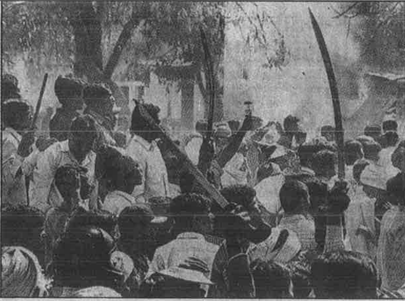
அகமதாபாத்தில் உள்ள பாபு நகரை ஆயுதங்களோடு தாக்கச் செல்லும் இந்து மதவெறி பயங்கரவாதிகள்.

சத்தின் துணைத் தலைவர் கிரிராஜ் கிஷோருக்கு இந்தக் கலவரம் "இந்துக்களின் வன்முறை கலந்த மிகச் சிறிய எதிர்வினை". அத்வானிக்கோ, "பயங்கரவாத பீதியை ஏற்படுத்தாத சாதாரண மதக் கலவரம்".