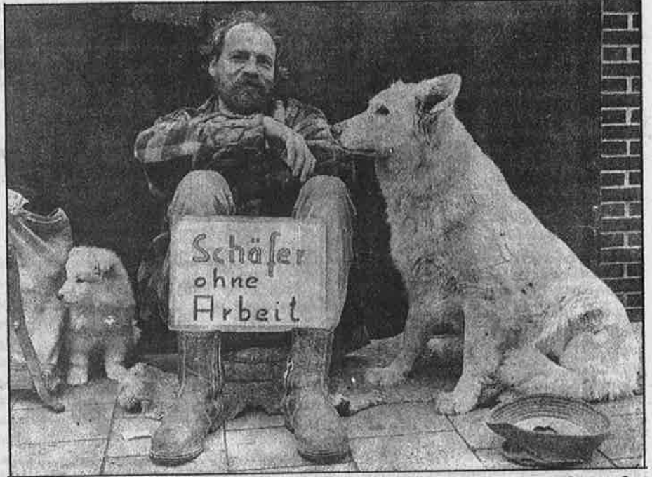
"ஐயா, வேலையில்லாமல் பசியால் துடிக்கிறேன்; தருமம் செய்யுங்கள்!" என்று தட்டியில் எழுதி வைத்துக் கொண்டு தனது நாபுடன் பிச்சை எடுக்கும் ஜெர்மானிய ஆடு-மாடு மேய்ப்பாளர்.

இப்படி வேலையின்றி உணவின்றிச் சாகும் கொடுமை பின்தங்கிய ஏழை நாடுகளில்தான் நடக்கும் என்ற நிலைமைக்கு மாறாக, இப்போது செல்வ வளமிக்க-பொருளாதார பலமிக்க ஏகாதிபத்திய நாடுகளிலேயே அந்த நிலைமை பற்றிப் படர்கிறது. அமெரிக்கா, ஜப்பான், ஜெர்மனி, ரசியா, பிரிட்டன், பிரான்ஸ், இத்தாலி என எல்லா ஏகாதிபத்திய நாடுகளிலும் மாபெரும் பொருளாதாரச் சரிவும் வீழ்ச்சியும் நெருக்கடியும் முறைகுலைவும் அராஜகமும் தீவிரமாகி விட்டன. சந்தைப் பொருளாதாரத்தின் மீள முடியாத தோல்வி - வீழ்ச்சியிலிருந்து தப்பிக்க வழி தெரியாமல் அவர்கள் தத்தளிக்கிறார்கள்.