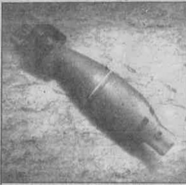
ஆக்கிரமிப்புப் போருக்குப் பின்னரும் லாவோஸ் மக்களைக் காவு கொள்ளும் அமெரிக்கக் குண்டுகள்.

வானிலிருந்து வீசப்படும் உயர் அழுத்த வெடி குண்டுகள், கையெறி குண்டுகள், துப்பாக்கிக் குண்டுகள், பீரங்கி குண்டுகள் என 200 வகையான குண்டுகள் லாவோஸ் நாடெங்கும் சிதறிக் கிடக்கின்றன. வெளிப்படையாகக் கண்ணுக்குத் தெரிந்தால் இவற்றை அகற்றி விடலாம். ஆனால் காடுகளிலும் புதர்களிலும் வயல்வெளிகளிலும் மண்ணில் புதைந்து கிடக்கும் இக்குண்டுகள் எப்போது வெடிக்கும் என்று யாருக்கும் தெரியாது. லாவோஸ் நாட்டின் 18 மாகாணங்களில் மூன்று மாகாணங்கள் தவிர இதர அனைத்து மாகாணங்களிலும் குண்டு வெடிப்புப் பயங்கரம் தொடர்ந்து நீடிப்பதாக அனைத்துலக நிலக்கண்ணி வெடி அகற்றும் நிபுணர்களும் உடல் ஊனமுற்றோர் சங்கங்களும் எச்சரித்துள்ளன.