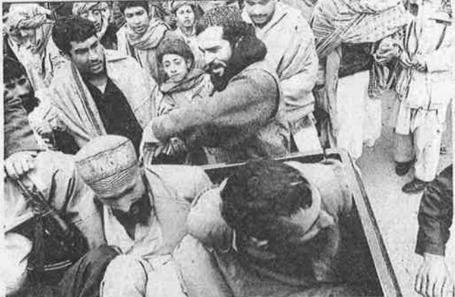
சிறையிலடைக்கக் கொண்டு செல்லும் முன் வடக்குக் கூட்டணிப் படையினரால் தாக்கப்படும் தாலிபான் போர்க்கைதிகள்: அமெரிக்கா பசும்பும் ஜனநாயக ஆட்சியின் மகிமை!

ஆப்கானில் முஜாகிதீனின் பல்வேறு படைப் பிரிவுகளுக்குள் நடந்து வந்த உள்நாட்டுப் போர், அராஜக அதிகாரத்தை வீழ்த்த இசுலாமிய மதவெறி பாசிச பயங்கரவாத ஆட்சியை அல்-கொய்தா படையின் துணையோடு தாலிபான் நிறுவி யது. அராஜக அதிகாரத்தை இழந்த அந்தப் படைப்பிரிவுகள் வடக்கிலும், மேற்கிலும் சில பகுதிகளைத் தக்க வைத்துக் கொண்டு வடக்குக் கூட்டணி அமைத்து தாலிபானுக்கு எதிராகப் போரிட்டு வந்தனர். அவர்களுக்கு ரசியா,