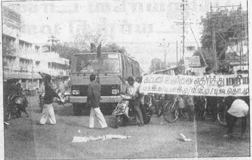
திருச்சி - புத்தூர் நாலுரோடு சந்திப்பில் கயிறு கட்டி சாலை மறியல் போராட்டம்.