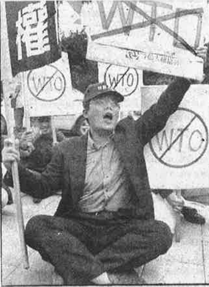
உலக வர்த்தகக் கழகத்தில் தைவான் இணைவதை எதிர்த்து அந்நாட்டுத் தொழிலாளர்களின் ஆர்ப்பாட்டம்.

உ.வ.க.வில் விவாதிக்கப்படவுள்ள “அரசு கொள்முதல்” என்ற புதிய அம்சத்தை எடுத்துக் கொண்டால், ஏழை நாடுகள் தங்கள் நாட்டு விவசாயிகளிடமிருந்து நெல்லைக் கொள்முதல் செய்யலாமா, கூடாதா என்பதைத் தீர்மானிக்கும் உரிமை உ.வ.க.விடம் போய்விடும். ஏழை நாடுகள் தங்கள் நாடுகளின் சிறு தொழிலையும், பொதுத்துறையையும் பாதுகாப்பதற்காக, அரசிற்குத் தேவைப்படும் பொருட்களை அந்நிறுவனங்களிடமிருந்து கொள்முதல் செய்வதை வழக்கமாகக் கொண்டுள்ளன. உ.வ.க. இந்த வழக்கத்திற்கு மங்களம் பாடுமாறு ஏழை நாடுகளிடம் “விவாதிக்கும்”! ஏழை நாடுகளின் அரசுகள் தங்களுக்குத் தேவைப்படும் பொருட்களை வாங்குவதற்கு விடும். “டெண்டர்”களில், எவ்விதப் பாகுபாடும் இன்றி பன்னாட்டு நிறுவனங்களும் கலந்து கொள்ள அனுமதிக்க வேண்டும் எனக் கோரும்.