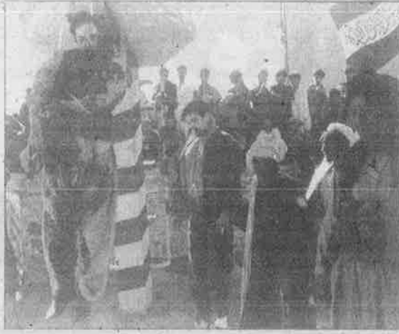
தாலிபான்களின் வெறியாட்டம்: குரூரமான சித்திரவதைக்குப் பின்னர் கூட்டுக் கொல்லப்பட்டு பொது இடத்தில் தூக்கில் தொங்கவிடப்பட்ட முன்னாள் ஆப்கான் அதிபர் நஜிபுல்லா.

ஐந்தாண்டுகளுக்குப் பிறகு, காபூலுக்குள் வடக்குக் கூட்டணிப் படைகள் நுழைந்தபோது, பழி தீர்த்துக் கொள்வதற்கு