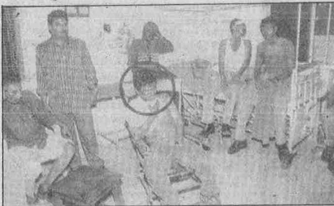
போலீசு-ரவுடி கூட்டணியால் தாக்கப்பட்ட பத்திரிகையாளர்கள்.

அது மட்டுமல்ல, ஊரடங்கிப் போன நள்ளிரவு நேரத்தில் கருணாநிதியைக் கழக்கமாகக் கைது செய்து விட முயன்ற ஜெயாவின் அராஜகத்தை அம்பலப்படுத்திய பத்திரிகையாளர்களை, இந்த முறை அவ்வளவு இலகுவாக விட்டுவிடக் கூடாது என்ற போலீசு திட்டமிட்டிருக்கும்.