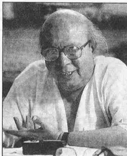
மாட்டுக்கறி உணவுப் பண்பாடு பற்றிய வரலாற்று ஆய்வு நூலை எழுதிய பேராசிரியர் ஜா.

இத்தாலி நாட்டின் ஜெனோவா நகரில் நடந்த ஜி-8 நாடுகளின் மாநாட்டை எதிர்த்து நடந்த போராட்டங்களையடுத்து, ஏகாதிபத்திய நாடுகளும், நிறுவனங்களும் பெரும் பீதியில் உறைந்து போயுள்ளன. இத்தாலி அரசு, அந்நாட்டுத் தலைநகர் ரோம் நகரில் நடைபெறவிருந்த உலக உணவு மாநாட்டை ஏதாவதொரு ஆப்பிரிக்க நாட்டில் நடத்திக் கொள்ள மாறு கேட்டுக் கொண்டுள்ளது. நேப்பிள் நகரில் நடைபெறவிருந்த "நேட்டோ" மாநாட்டையும், அக்டோபரில் நடைபெறவிருந்த ஐரோப்பிய ஒன்றிய மாநாட்டையும் இத்தாலியில் நடத்த முடியாது எனக் கூறிவிட்டது. இது ஒருபுறமிருக்க, உலக வங்கியும், சர்வதேச நாணய நிதியமும் தங்களின் வருடாந்திர மாநாட்டை ஒரு வரகாலம் நடத்தவிருந்ததை, இரண்டு நாட்களாக சுருக்கிக் கொண்டு விட்டன. இந்த மாநாடு வாஷிங்டனில் நடைபெறும்பொழுது, 50,000-க்கும் மேற்பட்ட போராளிகள் ஆர்ப்பாட்டங்களில் கலந்து கொள்வார்கள் என எதிர்பார்க்கும் இந்த நிறுவனங்கள், இந்த இரண்டு நாள் மாநாட்டின் பாதகாப்புக்காக 180 கோடி ரூபாய் ஒதுக்கியுள்ளன.