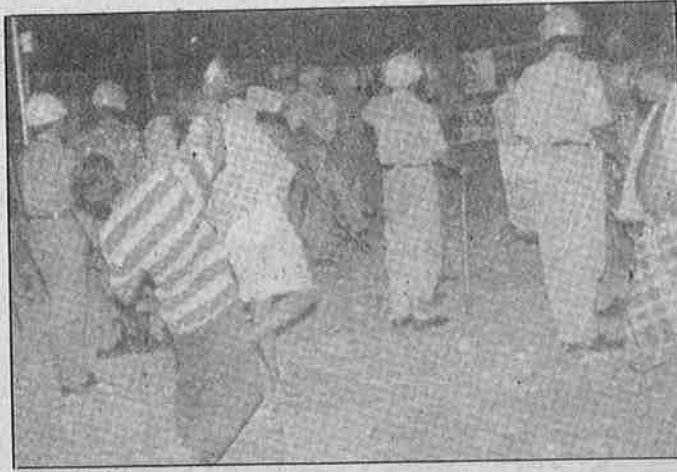
போலீசின் பாதுகாப்போடு பேரணியைத் தாக்கும் அயோத்திகுப்பம் ரவுடி.

“டிஜிட்டல் கேமராவில் இருந்து அசாரணமாக ‘பிளாப்பியை’ உருவி எடுத்த போலீசுக்காரரைப் பார்த்து நான் அசந்து போனேன்” என்கிறார் அடிவாங்கிய ஒரு நிருபர். இதை வைத்துப் பார்க்கும் பொழுது, கலவரத்தைப் புகைப்படம் எடுக்கும் பத்திரிகையாளர்களை எப்படியெல்லாம் ‘சமாளிக்க’ வேண்டும் என போலீசாருக்கு வகுப்பே எடுக்கப்பட்டிருப்பதாகத்தான் கூற முடியும்.