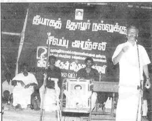
ஆரியப்பட்டியில் நடந்த இரங்கல் பொதுக்கூட்டம்.

விவசாயிகள் விடுதலை முன்னணி, மதுரை, தேனி மாவட்டங்கள்.