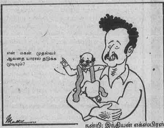
என் மகன் முதல்வர் ஆவதை யாரால் தடுக்க முடியும்?

போலி கம்யூனிஸ்டுகளைப் போலவே, கிருஷ்ணசாமி - திருமாவளவன் தலைமையிலான