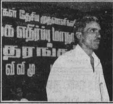
கன் தாரை வார்ப்பு" என்ற தலைப்பில் உரையாற்றினார்.