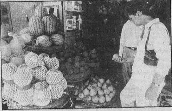
தாராள இறக்குமதி: ஆரோக்கியமா? பேரழிவா?

ஏறத்தாழ ஒன்றரை ஆண்டுகளுக்கு முன்பு புயல் - வெள்ளத்தால் ஓரிசா மாநிலம் தத்தளித்தபோது, அமெரிக்காவிலிருந்து நிவாரண உதவியாக வந்திறங்கிய கோதுமை, மரபணு மாற்றம் செய்யப்பட்டதாகும். இந்திய அரசுக்கு இது தெரிந்திருந்த போதிலும், அதைத் தடை செய்யாமல் பாதிக்கப்பட்ட மக்களுக்கு விநியோகித்துள்ளது. மரபணு மாற்றம் செய்யப்பட்ட சோயா உணவை ஐரோப்பிய ஒன்றிய நாடுகள் தடை செய்துள்ளன. இருப்பினும், அதேவகை சோயா உணவு அமெரிக்காவிலிருந்து 'உதவி' என்ற பெயரில் இறக்குமதி செய்யப்பட்டு, ஒருங்கிணைந்த குழந்தைகள் மேம்பாட்டுத் திட்டத்தின் கீழ் பள்ளிகளிலும் குழந்தைக் காப்பகங்களிலும் தடையின்றி வழங்கப்பட்டு வருகிறது.