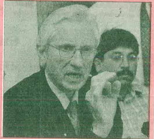
இலண்டன் மருத்துவரும் (மேலே) ஜெர்மன் மருத்துவரும் (கீழே) மாறன் உடல்நிலை குறித்து அளிக்கும் பேட்டி.