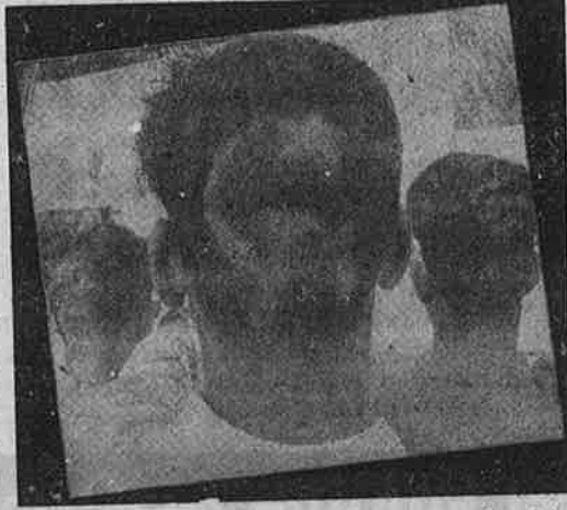
நவீன நாஜிகளின் பாணியில் கட்சி அணிகளின் அரசியல் பிரச்சாரம்.

இதற்கு முந்தைய தேர்தல் தோல்வி களுக்கு வேறொரு காரணம் கூறினர். "இதுசாரி முன்னணி அரசாங்கத்தின் சாதனைகளை மக்களிடம் பிரச்சாரம் செய்யத் தவறிவிட்டனர். இனி மக்களிடம் பிரச்சாரம் செய்யும் கடமைக்கு அணிகள் முன்னுரிமை தருவார்கள்". என்று சொன்னார்கள். திரிணாமுல் காங்கிரசு தொடங்கப்பட்டு அது ஆரம்ப முன்றிகளை ஈட்டியபோது, இதுசாரி முன்னணிக்கு எப்போதும் நகர்ப்புறங்களில் ஆதரவு இருந்ததில்லை. அதற்கு வழக்கமாக உள்ள கிராமப்புறப் பேராதரவு குறையவே இல்லை. இதனால்தான் நகரங்களில் சில இடங்களில் திரிணாமுல் காங்கிரசு வெற்றிபெற முடிந்தது" என்று விளக்கமளித்தனர்.