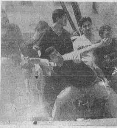
இசுரேலிய இராணுவத்தை வெறும் கற்களைக் கொண்டு எதிர்க்கும் பாலஸ்தீனர்களின் சுதந்திர ஆவேசம்.

களில் வசிக்கின்றனர்) பாலஸ்தீனர்கள் இஸ்ரேலிய இராணுவத்தின் அனுமதியின்றி நடமாட முடியாது. பாலஸ்தீன விவசாயிகள் தங்களின் விளைபொருட்களை விற்பது தொடங்கி வாள்வழிப் போக்குவரத்து நடத்துவது வரை - அனைத்து விதமான பொருளாதார நடவடிக்கைகளுக்கும் இஸ்ரேலின் அனுமதியைப் பெற்றாக வேண்டும். மேலும், தற்பொழுது இஸ்ரேலிய இராணுவத்தால் பாலஸ்தீன மக்கள் சுட்டுக் கொல்லப்படுவதும், இந்த 'சயாட்சி'ப் பகுதிகளில்தான். இவற்றையெல்லாம் அறிந்து கொள்ளும் பொழுதுதான், சயாட்சியின் மோசடித்தனத்தைப் புரிந்து கொள்ள முடியும்.