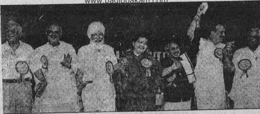
அதிமுக கூட்டணியின் வீரப்பன் எதிர்ப்பு: கிரிமினல் ஜெயா குற்றங்களை மறைப்பதற்கும், அரசியல் ஆதாயம் தேடுவதற்கும்.

ஆனால், ஜெயலலிதாவுக்குப் பின்னே இருக்கும் கூட்டணிக் கட்சிகளும், வீரப்பனுக்குப் பின்னே இருக்கும் தமிழினவாதக் குழுக்களும் ஜெயலலிதா, வீரப்பன் ஆகியோரையும் விஞ்சி விடும் அளவுக்கு அவர்களுக்காக வக்காலத்து வாங்குகின்றனர்.