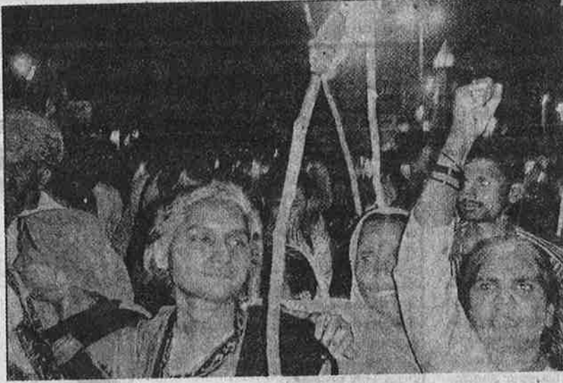
உச்சநீதி மன்றத் தீர்ப்பைக் கண்டித்து நர்மதை பாதுகாப்பு இயக்கம் நடத்திய ஆர்ப்பாட்ட ஊர்வலம்.

நர்மதை அணையால் இதுவரை 88 குடும்பங்கள் பாதிக்கப்பட்டுள்ளதாக அரசின் புள்ளி விவரம் கூறுகிறது. நர்மதை அணை கட்டத் துவங்கி பதிமூன்று வருடங்கள் ஆன பின்னும், இந்த 88 குடும்பங்களுக்கும் ஒரு துண்டு நிலமோ, ஒண்டுக் குடிசையோ உருப்படியாக ஒதுக்கப்படவில்லை. 88 குடும்பங்களின் மறுவாழ்வுக்குக் கடந்த பதிமூன்று வருடங்களில் உருப்படியாக ஒரு நடவடிக்கையும் எடுக்காத அதிகார வர்க்கம், அணை உயர வெளியேற்றப்பட்டுள்ள 40,000 குடும்பங்களின் மறுவாழ்வுக்காக ஒரு திட்டத்தைத் தயாரித்து, அதனை இம்மி பிசகாமல் நடைமுறைப்படுத்தும் என நீதிபதிகள் நம்பினால், ஒன்று, அவர்கள் முட்டாள்களாக இருக்க வேண்டும்; இல்லையென்றால், அவர்கள் தங்கள் அதிகாரத்தின் மூலம் மக்களை முட்டாளாக்குகின்றனர் என்றுதான் பொருள்.