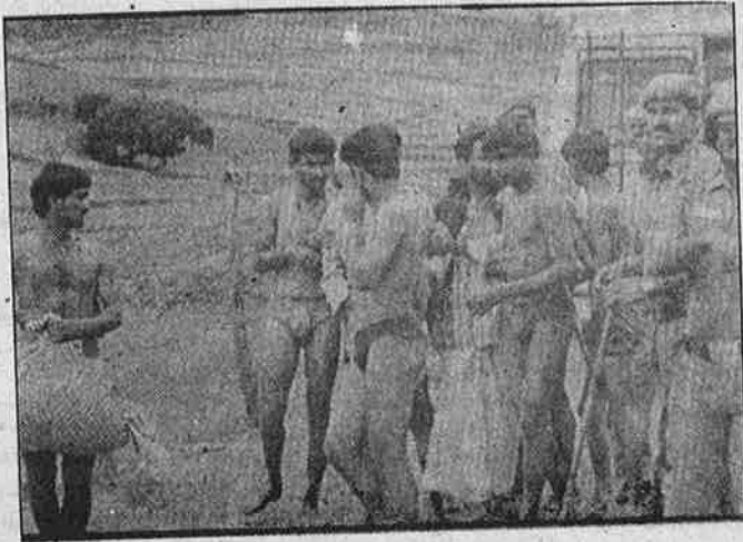
தேயிலை விவசாயிகளின் போராட்டத்தின் போது இளைஞர்களை வதைத்து உள்ளாடையுடன் இழுத்துச் செல்லும் போலீசர்.