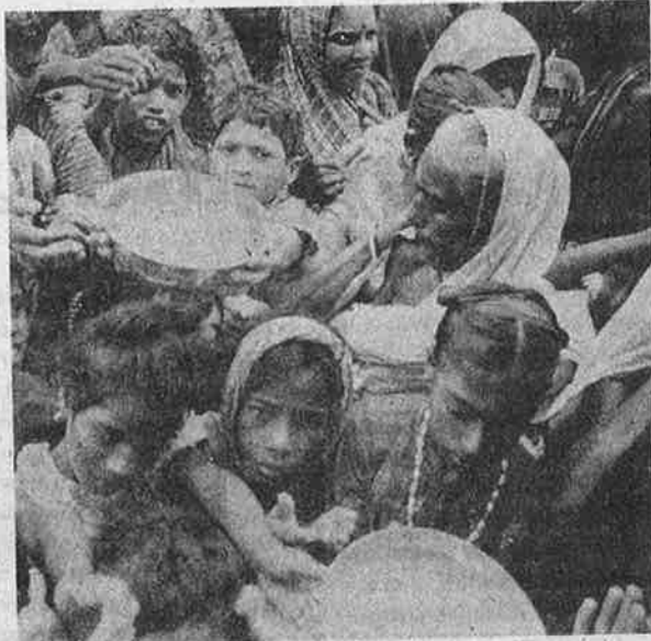
சமீபத்தில் வீசிய புயலால் பாதிக்கப்பட்ட மேற்கு வங்க மக்கள் உணவுக்காகத் தட்டேந்தித் திரியும் அவலம்: ஜோதிபாகவின் 25 வருடகால ஆட்சியின் 'சாதனை'!

இந்த நிலையில், "இடைக்கால நிவாரணம்" என்ற பெயரில் பெறும் சலுகைகள் மூலமே மக்கள் விழிப்புணர்வு பெற்று விடுவர் என்று நம்புவது எவ்வளவு