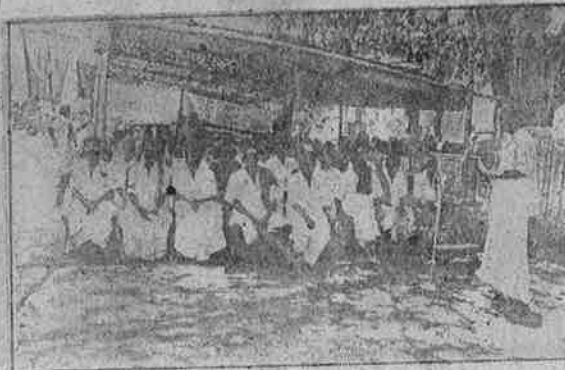
குடிநீர் கட்டண உயர்வை எதிர்த்து வி.வி.மு. நடத்திய ஆர்ப்பாட்டம்.

இந்த அநியாயக் கட்டண உயர்வைக் கண்டித்து கடந்த அக்டோபர் 5-ஆம் நாளன்று செல்லம்பட்டி ஊராட்சி ஒன்றிய அலுவலகம் முன்பாக விவசாயிகள் விடுதலை முன்னணி எழுச்சிமிசு ஆர்ப்பாட்டத்தை நடத்தியது. மதுரை, தேனி மாவட்டங்களில் செயல்படும் வி.வி.மு. கிளைகளின் முன்னணித் தோழர்கள் இதில் சிறப்புரையாற்றினார். பகுதிவாழ் மக்கள், அநியாயக் கட்டண உயர்வுக்கெதிரான இப்போராட்டத்தை வாழ்த்தி பல வகையிலும் ஆதரவு தெரிவித்தனர்.