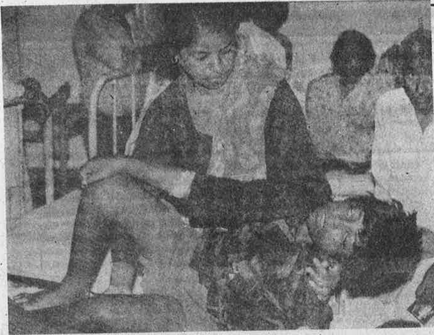
நீர்க்கோர்வை நோயால் பாதிக்கப்பட்டு, உயிருக்குப் போராடும் சிறுவன்: எண்ணெய் கலப்படத்தைக் காட்டி, எண்ணெய் இறக்குமதிக்கு அனுமதி.

ஆண்டுகளில் தகர்க்கப்பட்டு, வெளிநாடுகளை அண்டியிருக்க வேண்டிய நிலைமை செயற்கையாகத் திணிக்கப்பட்டு விட்டது.