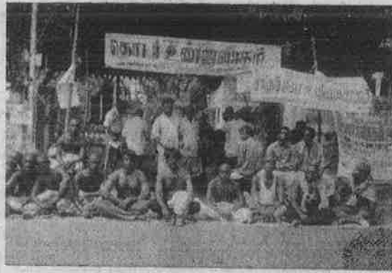
மொட்டையடித்துக் கொண்டு உண்ணாவிரதப் போராட்டம் நடத்தும் சட்டக் கல்லூரி மாணவர்கள்: உரிமைக்கான போராட்டத்தைக் கேலிக்கூத்தாக்குவது நியாயமா?

கேரளாவில் காங்கிரசு மாணவர் சங்கத் தலைவர் மீது ஆளும் 'மார்க்சிஸ்டு' கட்சியின் மாணவர் அமைப்பான